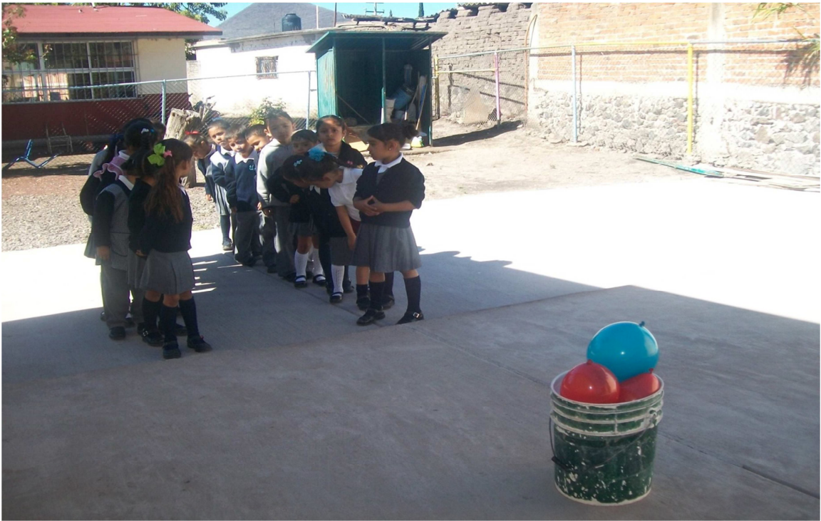
(Anexo 9) Actividad “Corre, corre”