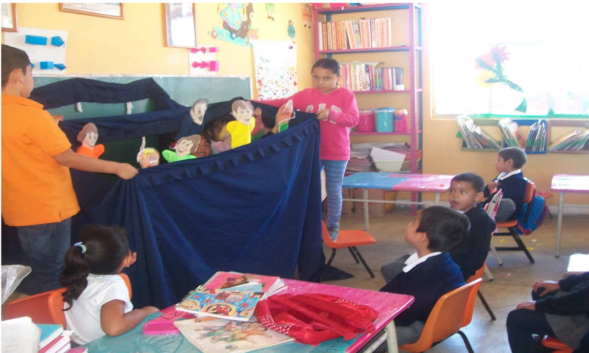
(Anexo 6) "Los tres cochinitos"