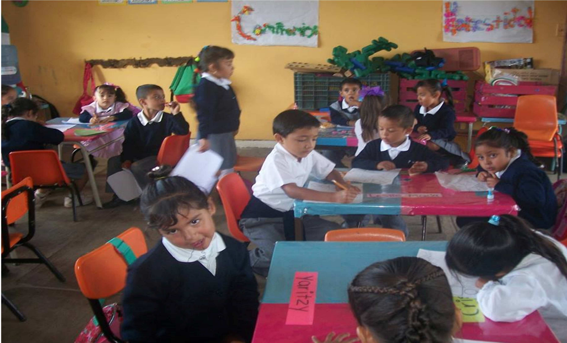
(Anexo 4) Grupo Escolar