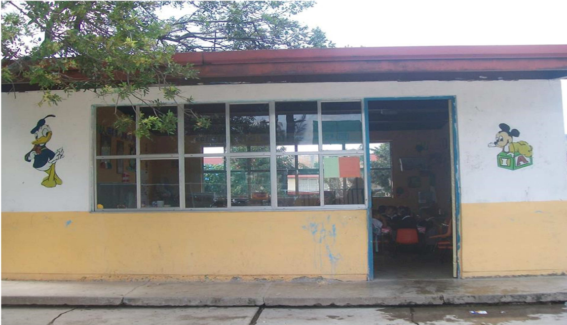
(Anexo 3) Aula de clases