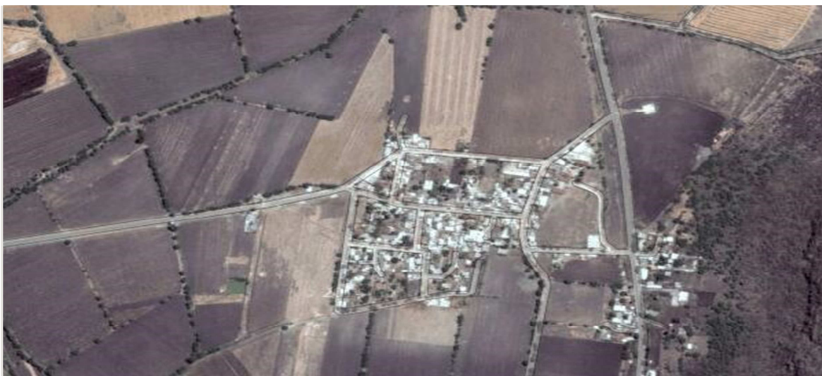
(Anexo 2) Mapa de la comunidad de Veredas