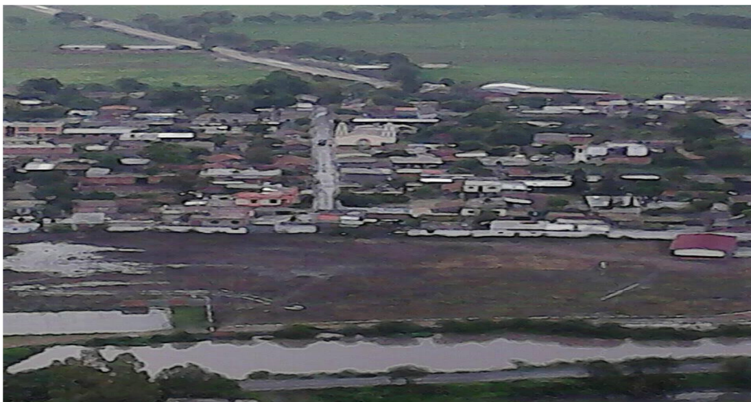
(Anexo 1) Imagen de la comunidad