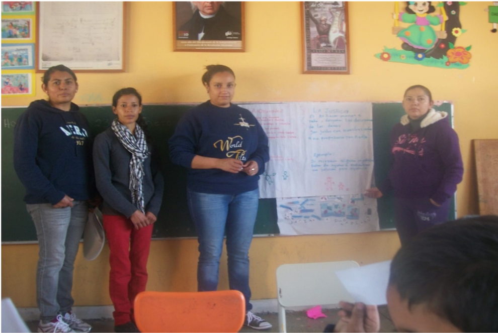
(Anexo 5) Taller con padres de familia