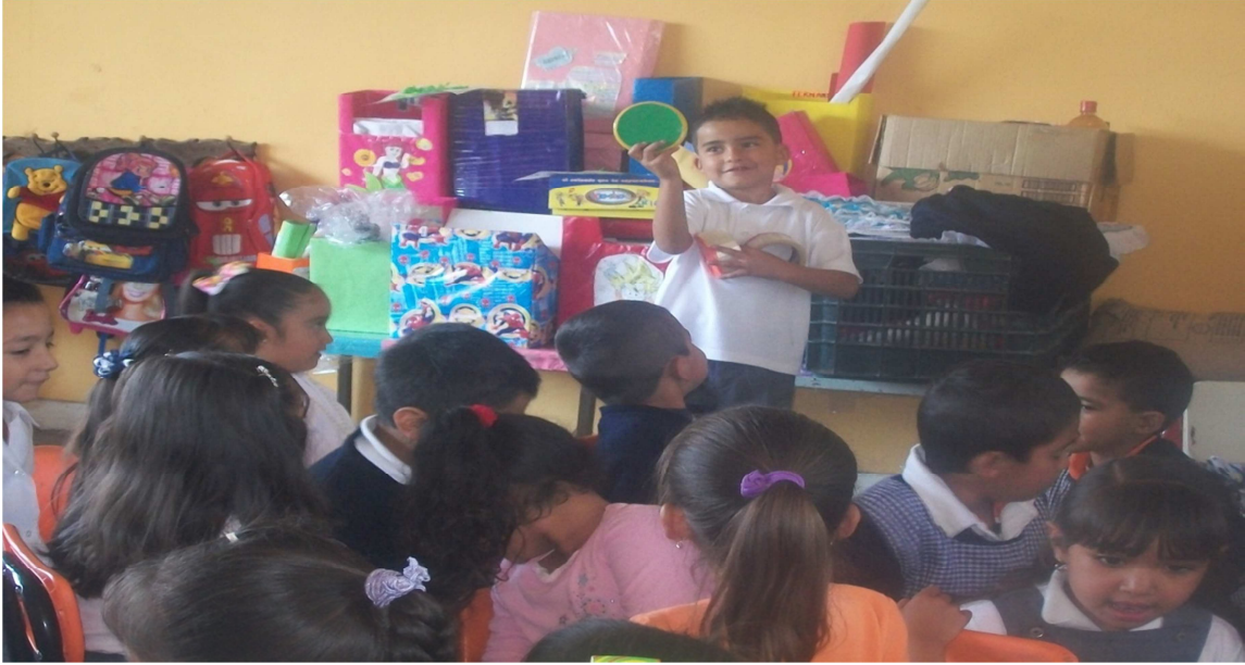
(Anexo 7) Actividad “El guardia y los coches”