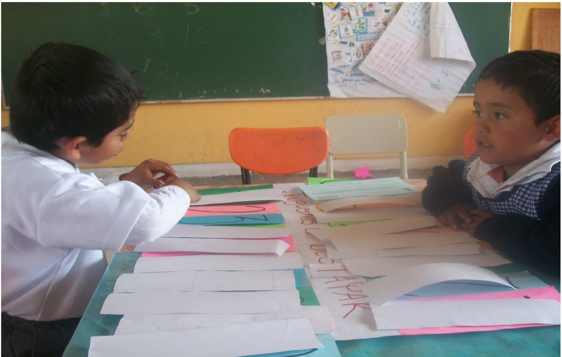
(Anexo 10) “Juego del destape”