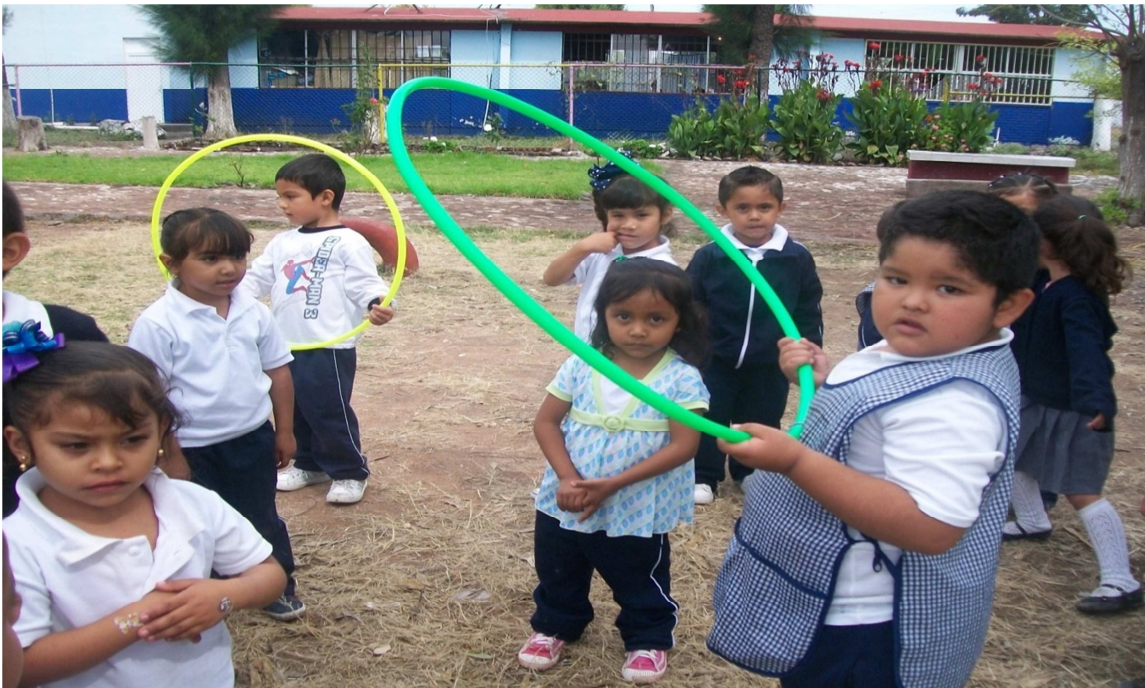
(Anexo 8) Actividad “Las reglas del juego”