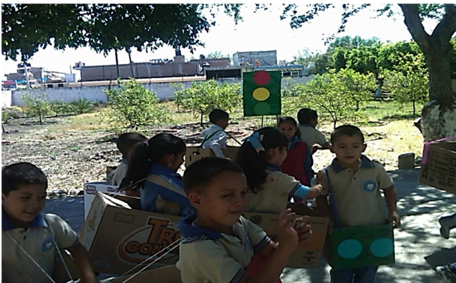
Fotografía # 9

Juego del semáforo: La mayoría de los alumnos logran el control de sus movimientos, mediante el juego pues este ayuda a controlar la velocidad de cualquier parte del cuerpo; pues, además de identificar los diferentes colores y su significado.