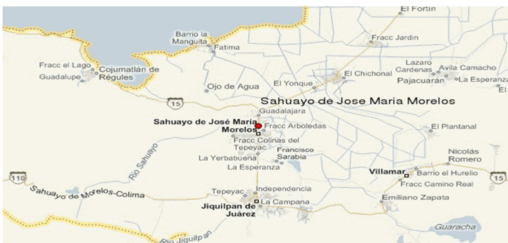
Mapa 1. Sahuayo de Morelos Recuperado de ( www.e-local.gob.mx .) 11/Junio/2012

En 1979 tiene televisor no menos de la mitad de las casas y dos tercios de los habitantes. “la pilmama ahora es la televisión” los alumnos salen volando de las escuelas donde solo estuvieron físicamente, para asistir a los mejores eventos deportivos del mundo. (GONZÁLEZ, 1979: 253)