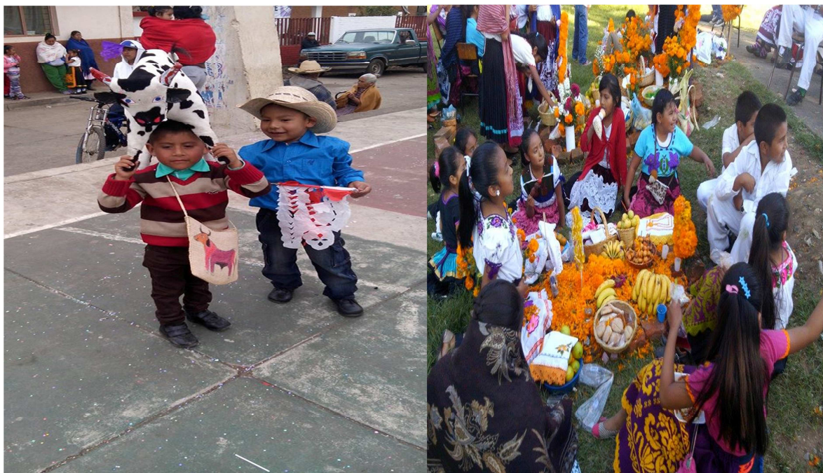
Transmisión cultural, juego del carnaval y celebración de día de muertos

“En las comunidades indígenas mexicanas, como en la generalidad de las sociedades prealfabetas” nada del universo de la conducta de los adultos está escondido o apartado de los niños. Ellos forman activa y responsablemente parte de la estructura social, del sistema económico y del sistema ritual e ideológico, desde sus inicios, el niño está orientado hacia la misma realidad al igual que sus padres y tiene el mismo material físico y social, su potencial cognitivo e institucional”. 40