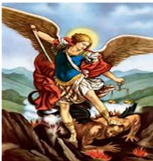
Imagen de San Miguel Arcángel, santo patrono de la comunidad de Tanaquillo.

Arcángel, donde se realizan eventos religiosos, su verbena es empezando con el novenario, en esta celebración los visitan las parroquias vecinas de toda la cañada con sus respectivos patronos, el día de 29 hay mañanitas, primeras comuniones, a la una de la tarde es la misa concelebrada que se ofrece por todos los doce capitanes de San Miguel, acompañan al párroco de esta comunidad los padres de las comunidades vecinas, después de este jubileo es el tradicional churipu y korundas ofrecido por todas las familias de esta comunidad a las personas que vienen de otros lugares a visitar, por la noche es el tradicional baile en la plaza para todo el que guste de escuchar la música o de bailar.