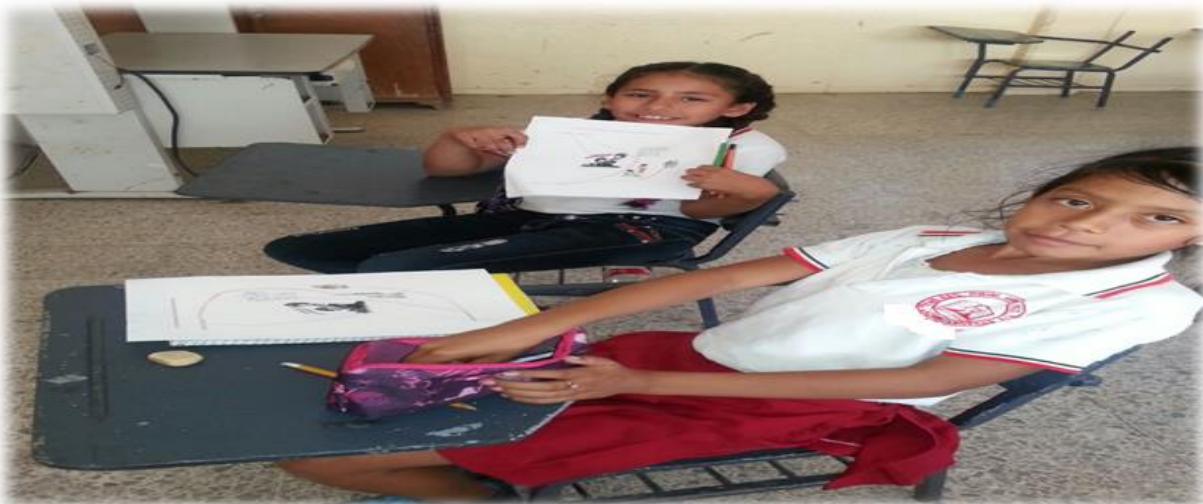
ANEXO 14 Escribiendo emociones que se consideran importantes.