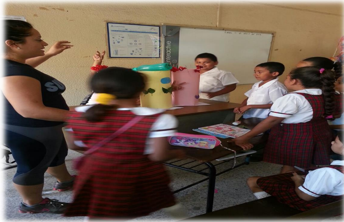
ANEXO 9 Escribiendo buenas actitudes de los compañeros.