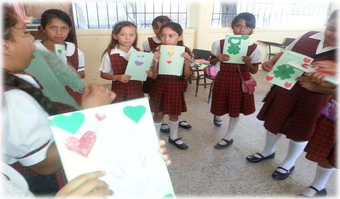
ANEXO 11 Realizando la dinámica la llave de roma.