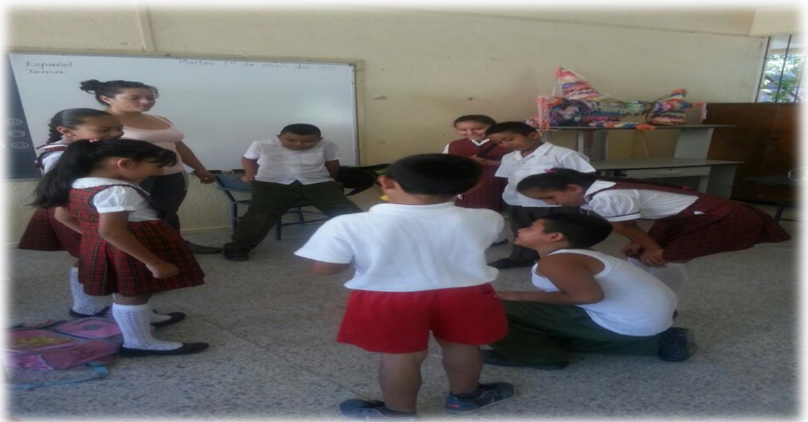
ANEXO 12 Trabajando con la ruleta de las emociones.