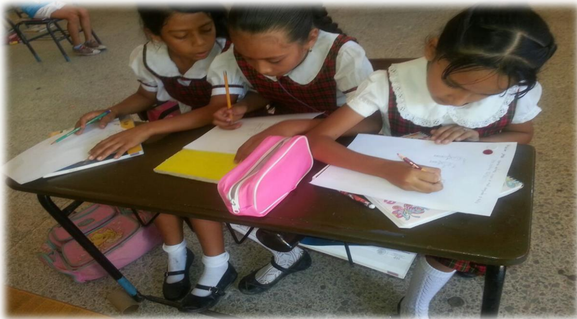
ANEXO 10 Elaborando el álbum personal.