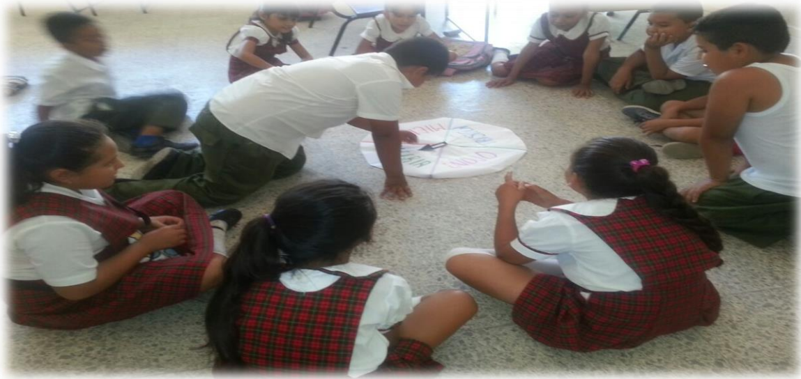
ANEXO 13 Relacionando buenas acciones.