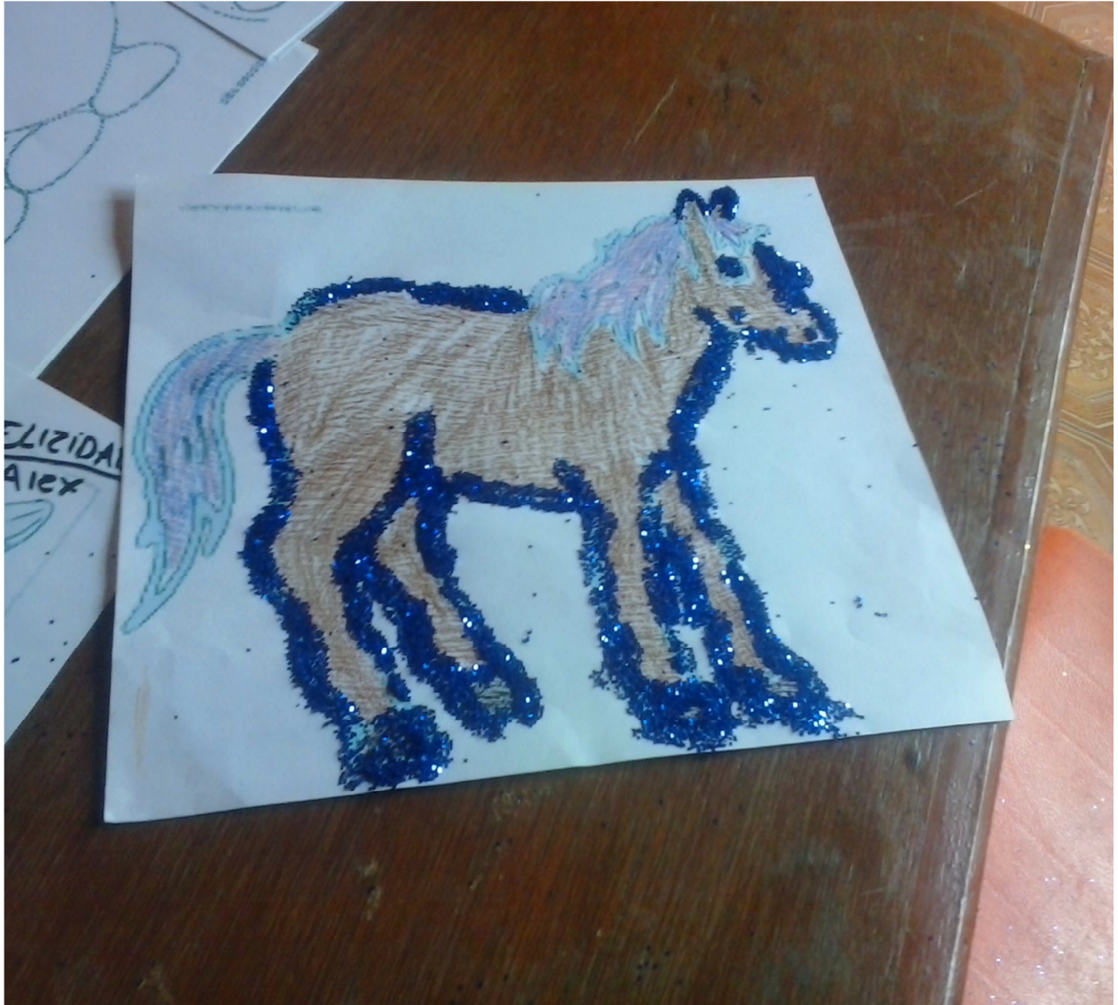
Mi caballito realizado por Alex en la actividad medios de transporte conociendo el cómo transporte, utilizando diferentes materiales: colores, diamantina, resistol etc.