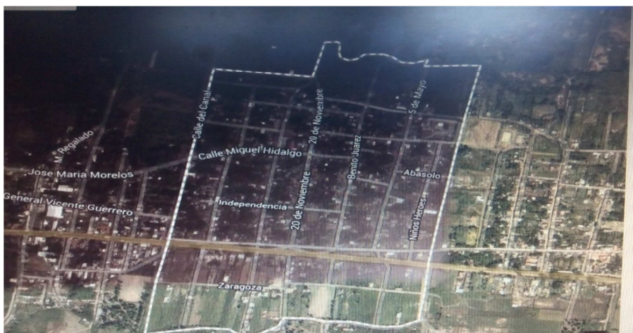
MAPA SATELITAL ACACHUÉN MICHOACÁN

En el antiguo pueblo se conservan algunos de los lugares, como por ejemplo el templo, dicen que se encuentran algunas piedras de cómo era. La gente es bien unida, los jefes de tenencia o encargados de la comunidad convocan juntas en donde seleccionan a los habitantes para que vayan a cuidar el antiguo pueblo; con el propósito de que los habitantes de pueblos vecinos no vayan a robar cosechas o a talar árboles, es uno de los problemas que tiene la comunidad; a esas personas se les llaman "kuares" los que van a cuidar el cerro. Y cada mes o cada 15 días en general todos los hombres, de preferencia los que ya estén casados, van a hacer limpieza por solo un día.