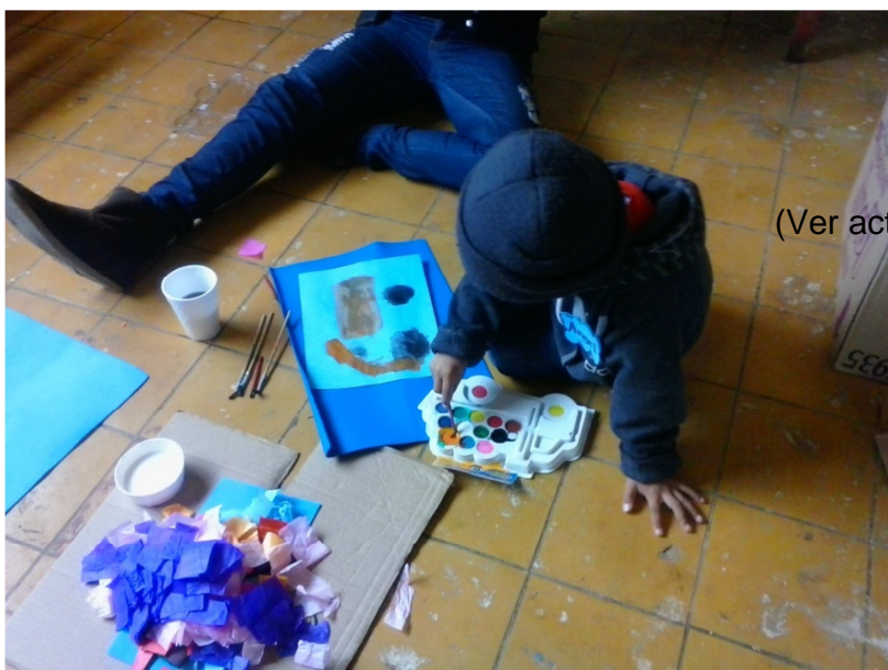
ANEXO # 6. (Ver actividad los medios de transporte).