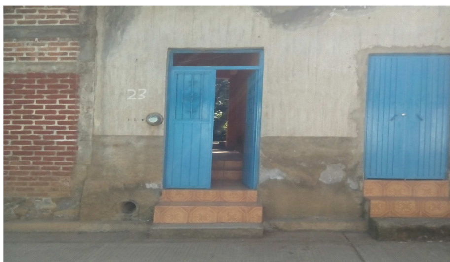
Casa habitación "Espacio Infantil"

Se creó con el propósito de favorecer un desarrollo intelectual del niño y transformar las relaciones establecidas entre interventor-alumno y organizar la distribución de materiales y espacios físicos en donde los pequeños tienen la oportunidad de dialogar con sus pares y con adultos, que permitir la creatividad, resolución de problemas, toma de decisiones, acuerdos, respeto, favorecer el desarrollo físico y cognitivo. Este espacio es utilizado como estrategia didáctica basado en la curiosidad, representa la posibilidad para generar aprendizaje a través del descubrimiento.