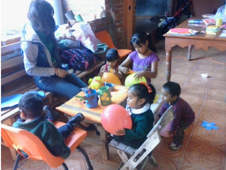
ANEXO # 3 (ver actividad yo subo, tu bajas)