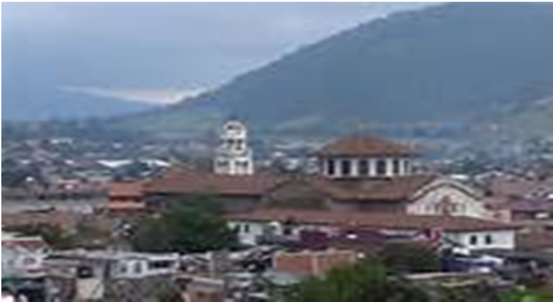
VISTA PANORÁMICA DE LA COMUNIDAD DE CHERÁN MICHOACÁN

IMÁGENES DE LA COMUNIDAD INDÍGENA DE CHERÁN DONDE SE ENCUENTRA EL PREESCOLAR “ROSAURA ZAPATA CANO”