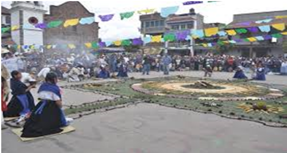
PLAZA MUNICIPAL DE LA COMUNIDAD