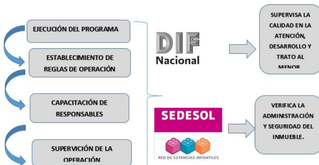
Cuadro 1. Esquema de la puesta en marcha del Programa de Estancias Infantiles. (Programa de Estancias Infantiles para Madres Trabajadoras de la red SEDESOL. Pág. 6).

Una vez acreditado los puntos anteriores, entonces comienza la ejecución del programa, se ilustra en el siguiente cuadro: