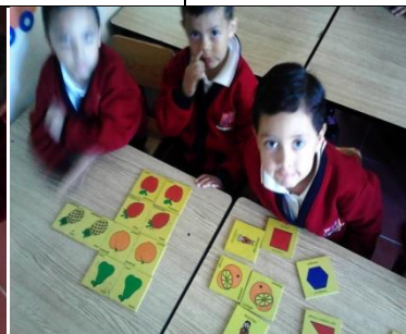
Fotos de la actividad Encuentra el par realizada el día 15 de Septiembre del 2015.

En la primera imagen se muestra como los niños tienen los pares en la mesa y por equipos. En la segunda, se muestran como encuentran el par. Y en la última se puede observar como los alumnos fueron encontrando poco a poco los pares.