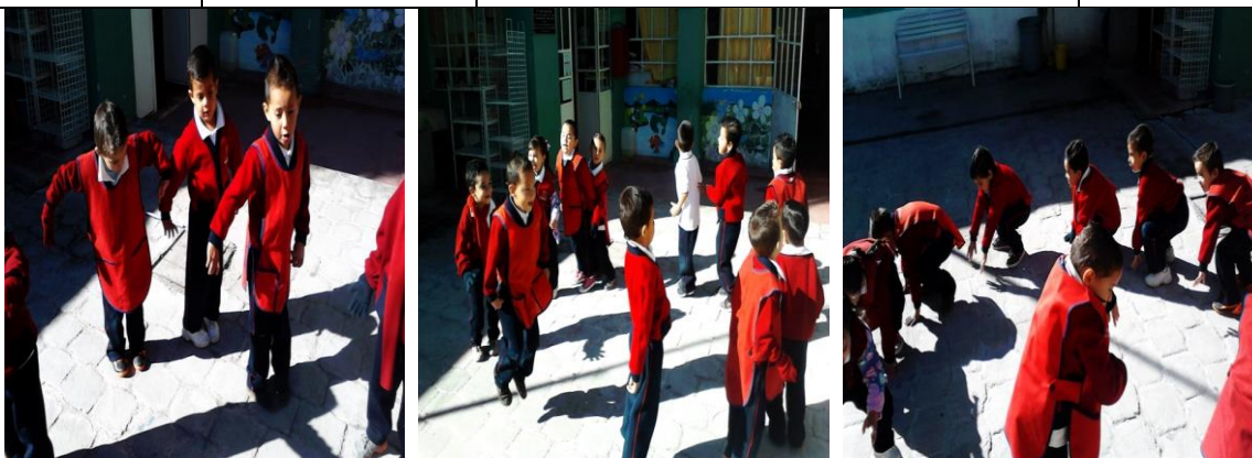
Fotos de la actividad como ranas realizada el día 24 de Noviembre del 2015

En la primera imagen se muestra como los niños van caminando con los pies hacia adentro, en la segunda foto como los niños saltan con los pies juntos y en la tercera fotografía como los niños saltan como ranas.