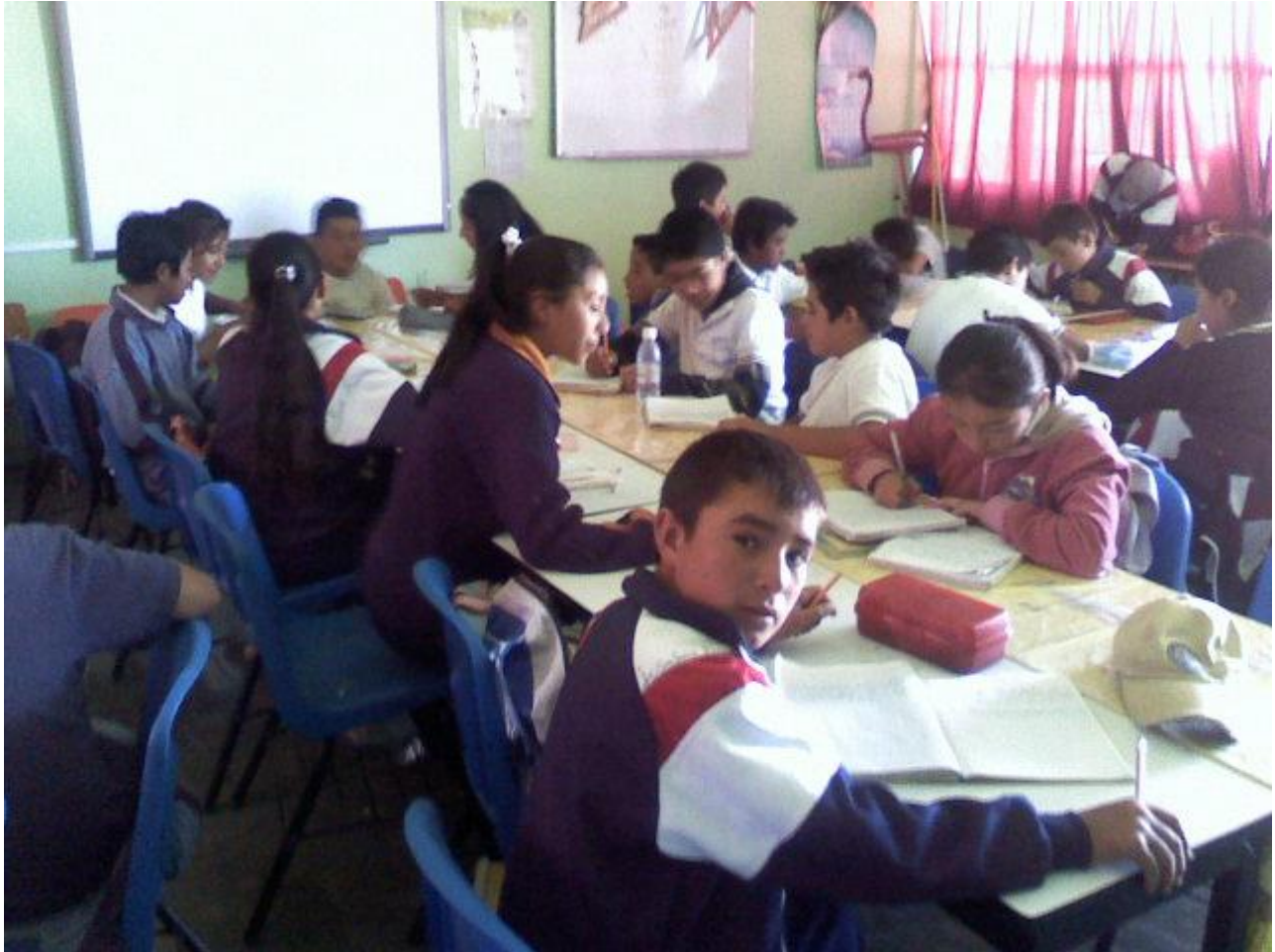
Colaboración y participación en las actividades realizadas.