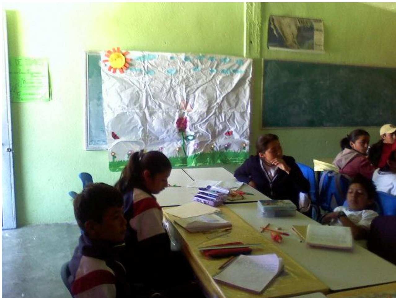
Inquietud por adquirir conocimientos nuevos.