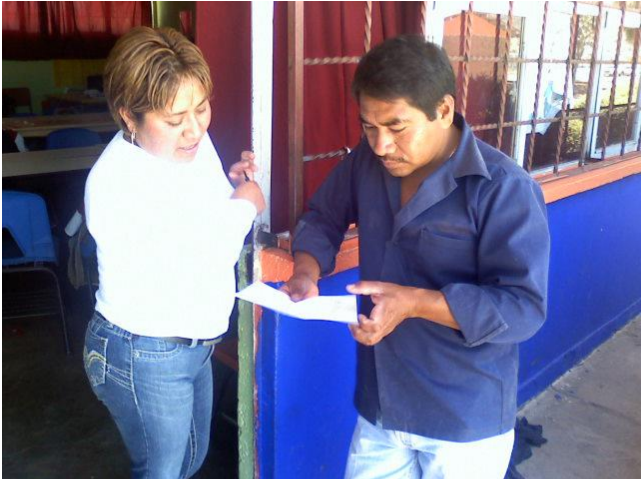
El padre de familia demuestra inquietud hacia las actividades previas del trabajo.