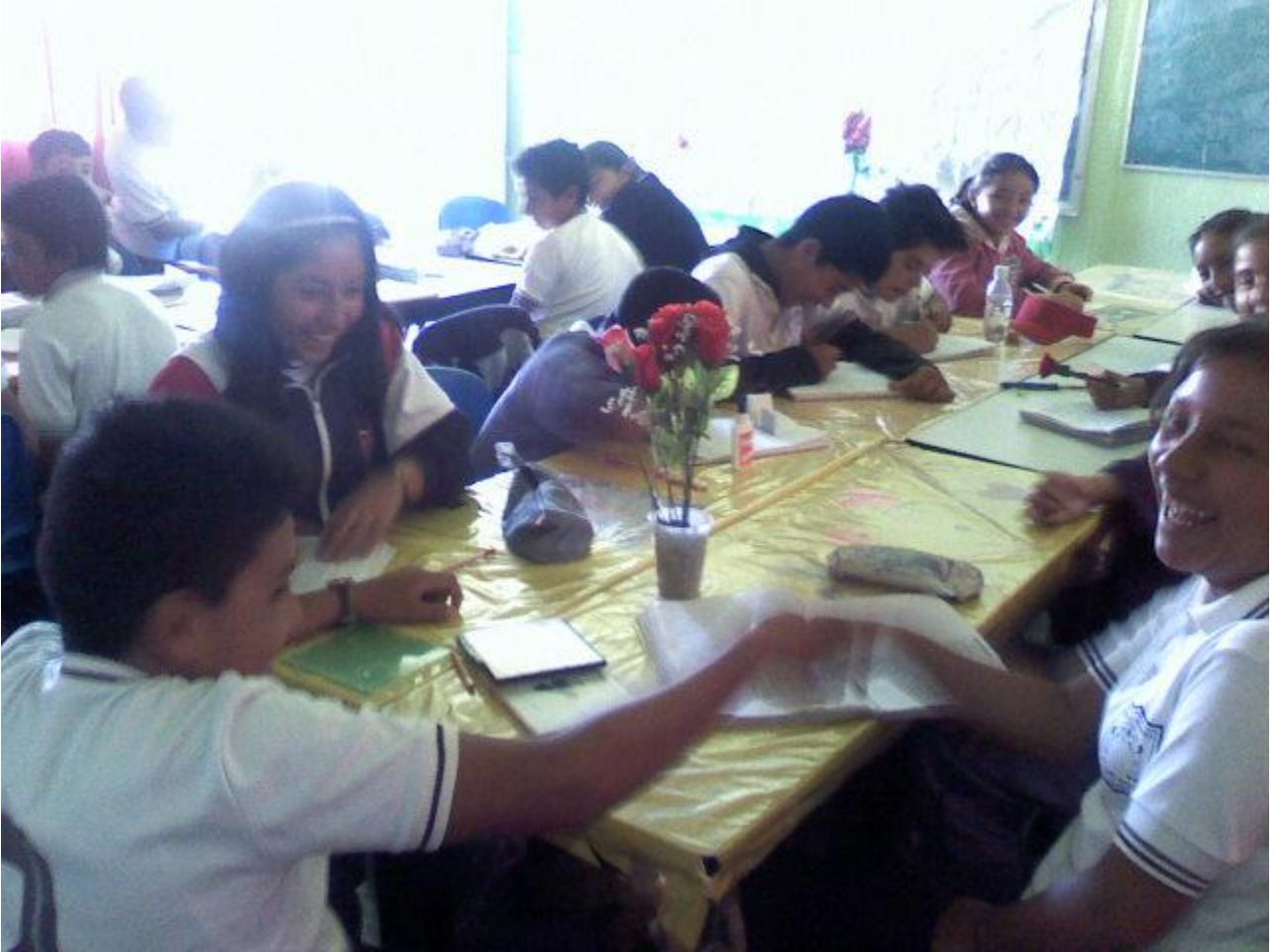
Armonía entre compañeros