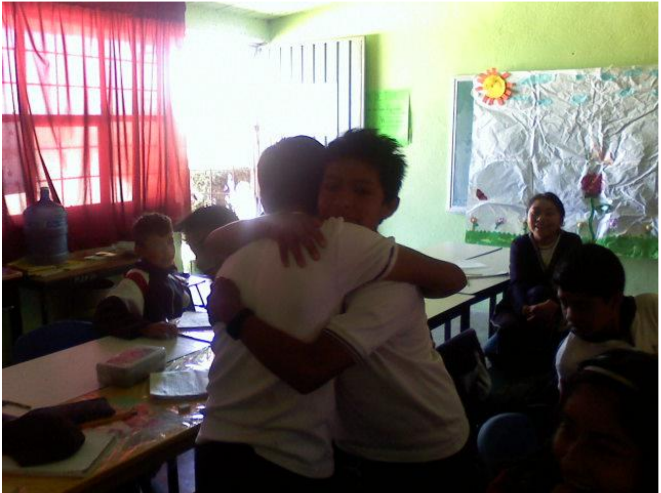
Los alumnos se demuestran respeto y confianza.