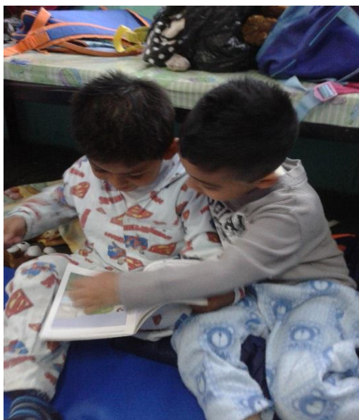
Respetándonos en pijamada literaria

Al final de estos comentarios pude notar que los alumnos han comprendido y sensibilizado que es el valor del respeto, pues hicieron observaciones sobre lo que ocurre en su vida cotidiana, por lo que si bien, no todo el grupo lo ha comprendido y relacionado con su vida cotidiana, al menos pude hacer que algunos de los alumnos conocieran e identificaran algunas características de personas respetuosas y responsables, pero considero que con el tiempo y sus experiencias lo comprenderán como se viven esos valores.