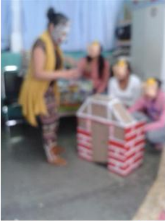
Mamás contando los tres cochinitos