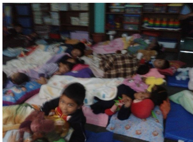
Niños en pijamada literaria