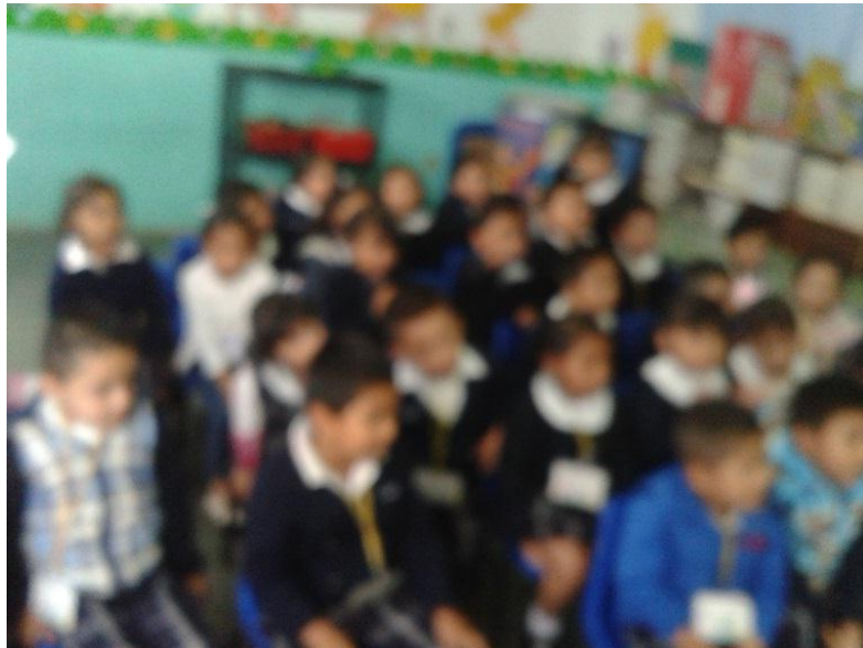
Alumnos escuchando Los tres cochinitos