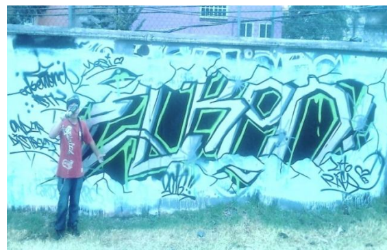
Muestra de graffiti 4

Tuve la oportunidad de entrevistar a una compañera que fue maestra en el CONALEP Tlalpan II, la pregunta central fue ¿qué opinas de qué se permita un espacio para graffitear en la escuela?, a lo que mencionó: “considero que es interesante que se le otorgue un espacio a los graffiteros para poder realizar su