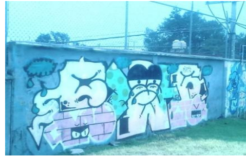
Muestra de graffiti 2