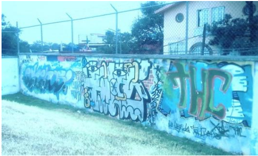
Muestra de graffiti 1