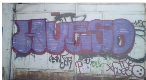
Foto tomada en la colonia El Sol, Nezahualcóyotl