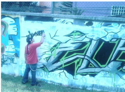
Muestra de graffiti 3