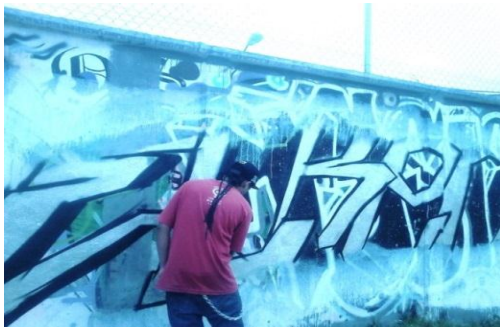
Muestra de graffiti 1

A continuación se muestran algunas fotos donde se puede apreciar cómo se fue realizando la producción del graffiti del joven que participó en la muestra de graffiti 2016.