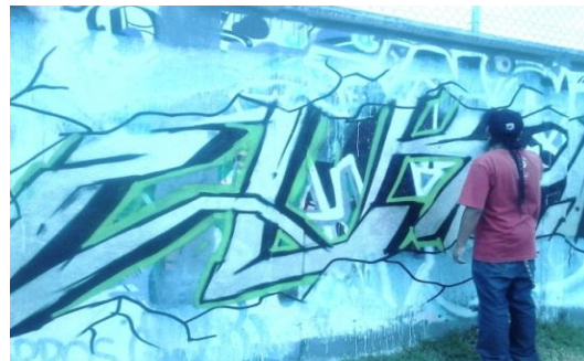
Muestra de graffiti 2