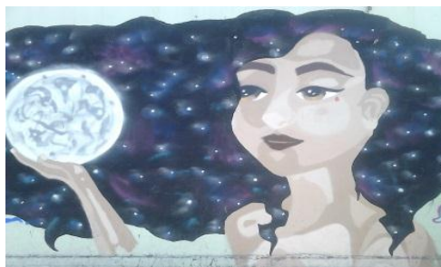
Foto toma a las afueras de la escuela primaria Patria y Libertad,