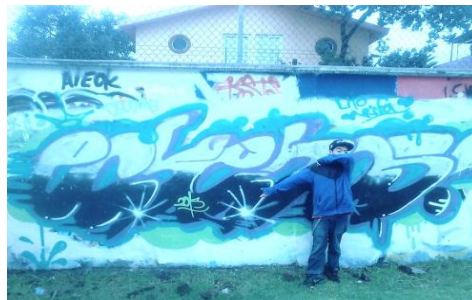
Muestra de graffiti 3

El profesor tuvo una total apertura a que pudiera tener un acercamiento a la próxima muestra de graffiti, así que esperó un tiempo (algunos meses); cuando la fecha se aproximaba me comentó que la asistencia fue minoritaria cerca de 3 o 4 jóvenes.