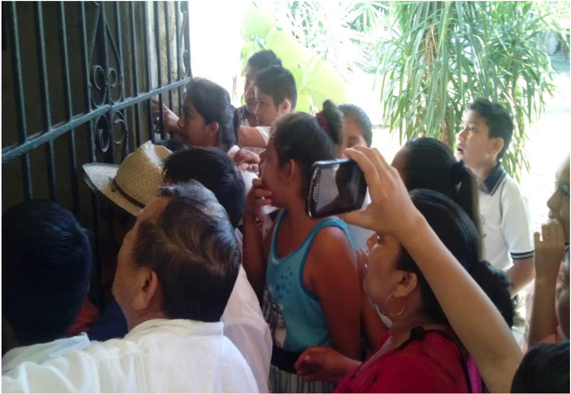
Alumnos, don Nopi y algunos padres de familia, sorprendiéndose de las cosas que observaban en el edificio.