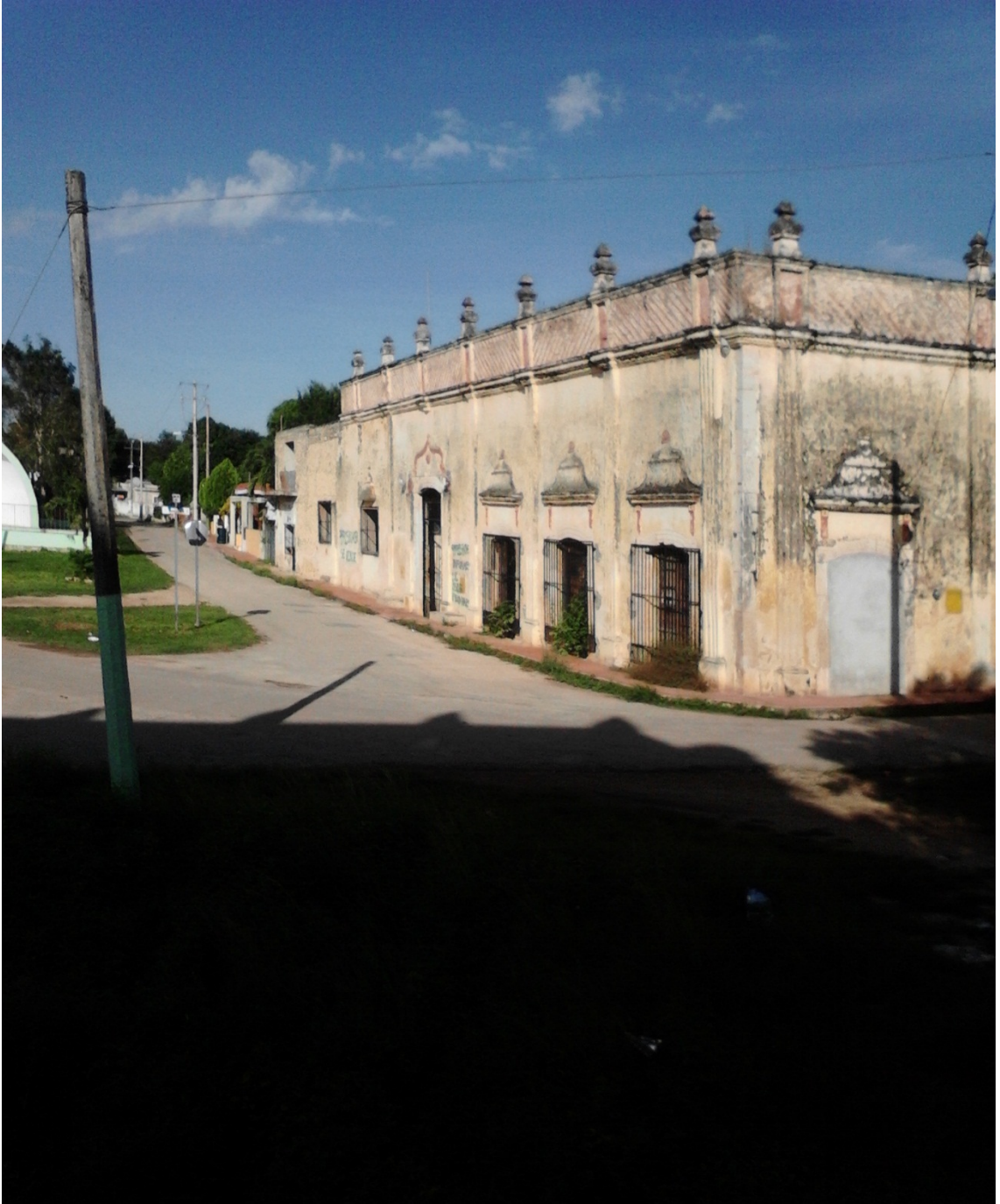
Edificio de la casa del Huay Cot, donde se desarrolló la leyenda.