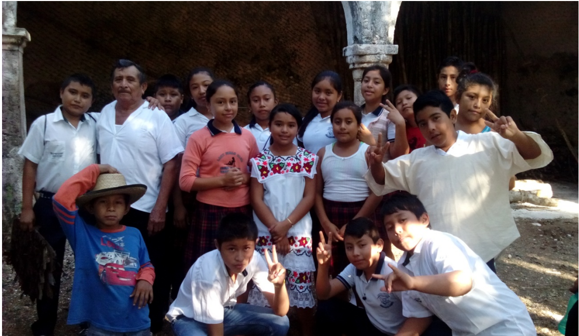
Visita a la casa del Huay Cot, donde algunos niños se vistieron con la ropa típica de aquella época, las niñas con su huipil y los niños con su camisa de manta cruda.