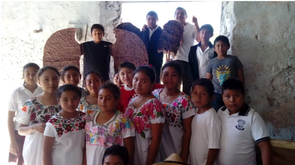
En esta imagen se muestra a las niñas vestidas con su huipil, a los niños que representaron al Huay Cot, como también al informador clave que narró la leyenda.