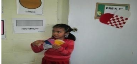
Foto: No. 1; Explicación ante el grupo.

plasmaron las diferentes reglas que tenemos en el salón de clases; cada uno realizó un dibujo y pasó al frente a explicar su lámina con sus propias palabras. (Ver foto No. 1).