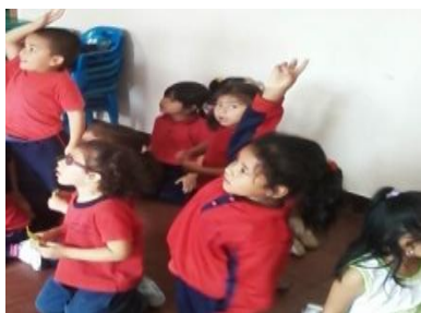
Foto: No. 5; Los niños participando sobre la importancia de cumplir las reglas.

El resto del grupo no respondió, posteriormente, se dialogó sobre la importancia de cumplir de ahora en adelante las reglas que entre todos establecimos, así como las sanciones (no castigos) ante su incumplimiento para que comprendan que el infringirlas tiene consecuencias (Ver foto No. 5).