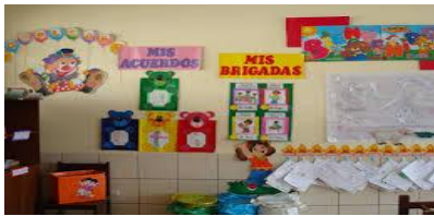
Foto: No. 26; Salón ordenado.

Se trabajo colectivamente para limpiar y decorar el salón de clases y los juguetes. En esta actividad cada uno eligió una tarea de forma que todos colaboran en la realización de la actividad. Cada uno consideró sus habilidades para poder desarrollar con éxito la tarea (Ver foto No. 26). Las tareas fueron limpiar las hojas de las plantas, los estantes, los juguetes, por ejemplo; dichas tareas fueron realizadas por más de un niño; a cada uno se le dio la responsabilidad de limpiar, lavar, secar dos o tres juguetes y después ponerlos en su sitio. Otro grupito, ordenó los rincones. También trasladaron una mesa pequeña y ligera, levantaron la caja de los juguetes, ordenaron el aula; tareas que requirieron la cooperación y colaboración.