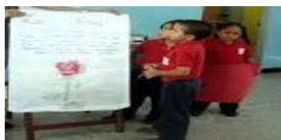
Foto: No. 29; Los niños exponiendo.

Los niños pusieron un nombre al dibujo elaborado y me dictaron un texto sobre lo dibujado; presentaron su trabajo al resto del grupo. En esta actividad se logró que todos participaran, escucharan a sus compañeros.