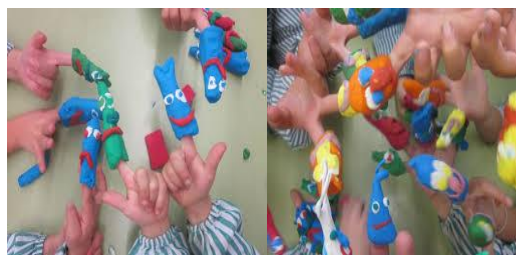
Foto: No.15; Elaboración de sus propios títeres.

Se les explicó a los niños la actividad que se realizó, se centró en una dramatización de un cuento llamado “El Mugrosito”, con títeres que ellos realizarán con plastilina y con la ayuda de la maestra (Ver foto No. 15).