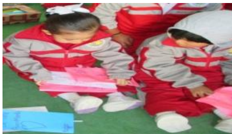
Foto: No. 16; Realizado tarjetas.

En esta actividad elaboraron tarjetas (Ver foto No. 16); dibujaron la imagen de un gesto siguiendo las indicaciones que están al reverso de la tarjeta.