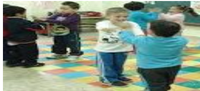
Foto: No. 9; Los niños bailando conforme va la música y expresando sus sentimientos.

Cada uno le dijo a su compañero lo que consideraba, algo positivo de su persona. Esta actividad funcionó para que se acercaran más a sus compañeros, manifestaran y recibieran afecto. Al terminar esta actividad, decían cada uno de ellos lo que sintieron y argumentaron si les gustó o no lo que les dijeron y realizaron.