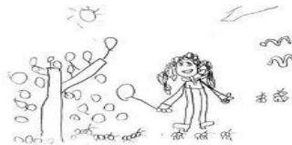
Foto: No. 10; Los niños dibujando expresando sus sentimientos hacia sus compañeros.