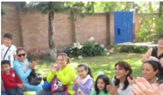
Foto: No. 30; Los niños entrevistando a sus papás.

Los niños presentaron la información recopilada, exponiendo qué es y cuáles son las características del autorretrato, promoviendo y comparando la información que ahora tienen, con la que tenían al inicio de la actividad.