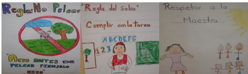
Foto: No. 14; Elaboraron sus pancartas para colocarlos en lugares estratégicos.

Se inició la clase elaborando pancartas sobre el respeto (por equipo) (Ver foto No. 14) y colocarlas en lugares visibles durante toda la semana y al final del día pasar a cada uno de los salones y preguntarles a sus compañeros si saben qué reglas se encuentran dibujadas y escritas fuera de las pancartas. Esta actividad resultó importante, algunos niños no se percataron de los carteles y se les explicó el por qué de ellos y qué mensajes transmiten. Este trabajo en equipos ayudó a los niños a aceptarse con diferencias, establecer metas para obtener un clima de respeto y ayuda; así como la participación de todo el grupo.