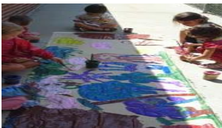
Foto: No. 20; Niños dialogando sobre la importancia de las reglas.

Argumentaron sus pensamientos en estas entrevistas, dialogaron sobre la importancia de cumplir las reglas en el salón y en casa.