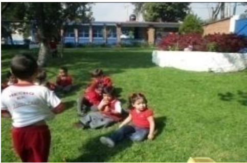
Foto: No. 22; Los niños escuchando el cuento.