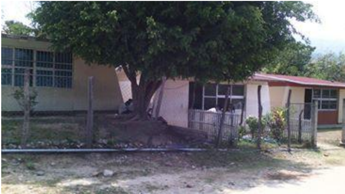
Foto 3: Aulas de clases de la primaria Porfirio Díaz 30/09/2016

La escuela cuenta con seis aulas, una es utilizada como la dirección otra como bodega y las restantes como salones de clases, también cuenta con un cocina comunitaria en donde las madres de familia se encargan de cocinar para los alumnos y una cancha de básquetbol en donde llevan a cabo todos los eventos sociales y cívicos que se llegan a presentar durante el ciclo escolar.