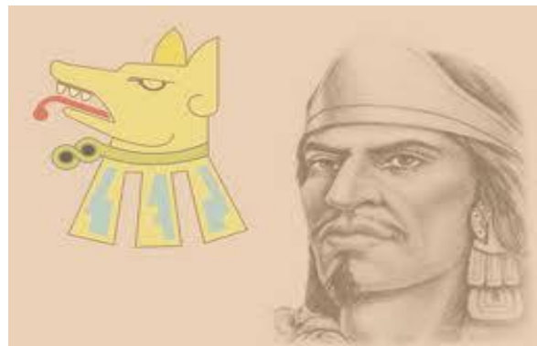
Imagen de Netzahualcóyotl

Netzahualcóyotl es un nombre que procede de la lengua náhuatl Nezahualcoyotzin (que deriva de Nezahual –ayuno- y Coyotl-coyote-) y significa –coyote que ayuna); tomando en cuenta que Netzahualcóyotl proviene del dialecto chichimeca de las radicales Nezahualli , que significa ayuno y coyotl, que significa coyote, es decir “Coyote en ayuno”. LEMA: “lo que hoy construimos florecerá mañana”