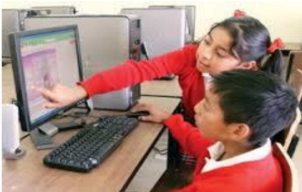
Alumnos de 2 "C" en la sala de computo

Alumnos de 2 "C" de Educación Primaria en la sala de computo, trabajando en programas de internet para mejorar y actualizar su aprendizaje en cuanto a la "comprensión lectora".