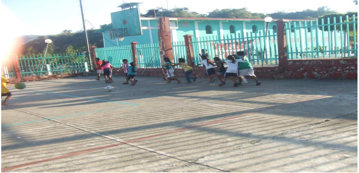
Anexo 6.1. los niños formados en equipos.