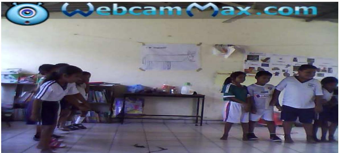
Evidencia de la estaregia N° 4 Casa de ¿?