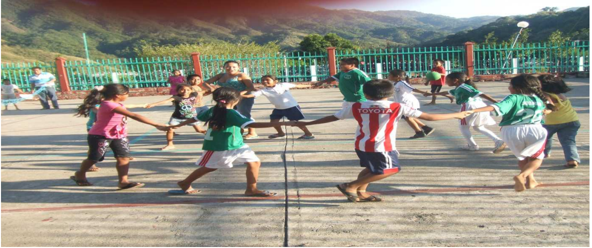
Anexo 7.1. los niños jugando la dinamica casa de ¿?