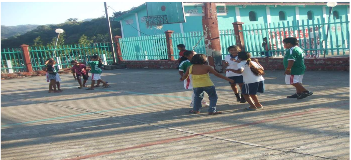
Evidencias de estrategia N° 5 Haciendo fuerte a mi grupo