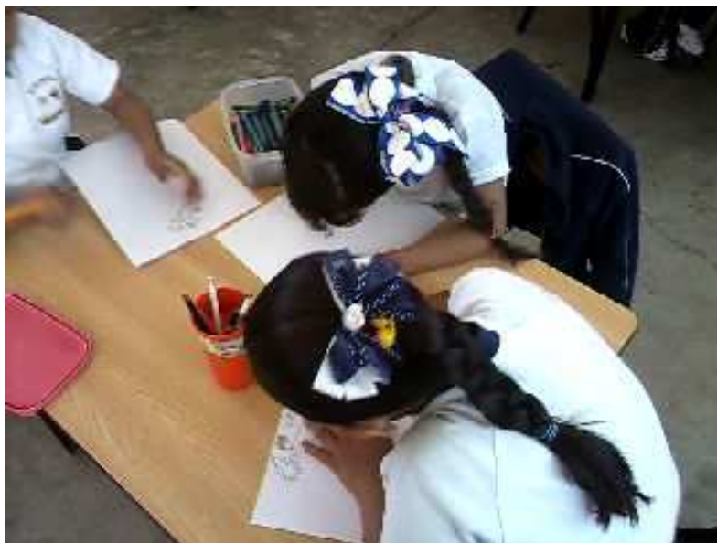
Fotografía 18. Se muestra la imagen con los alumnos de 3er grado, la falta de maduración, para colorear y para realizar trazos, portafolio de evidencias 2012