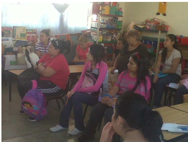
Fotografía 8. Plática con los padres de familia, portafolio de evidencias 2012