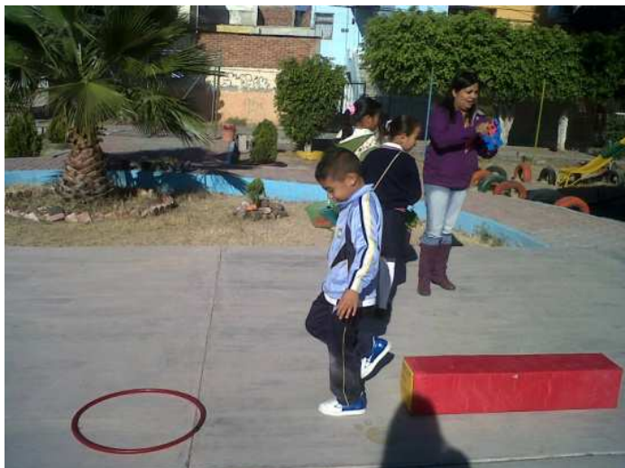
Fotografía 30. Los párvulos jugando y desarrollando su fuerza, equilibrio, e imaginación, imagen aportada del portafolio de evidencias 2013