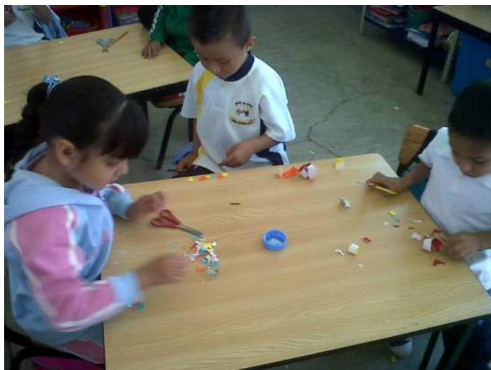
Fotografía 17. Los niños muestran falta de coordinación al momento de recortar, portafolio de evidencias 2012.