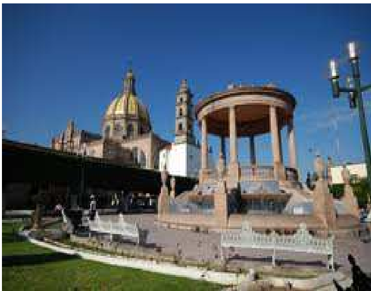
Fotografía 2. Centro histórico de la Piedad Michoacán portafolio de archivos 2013