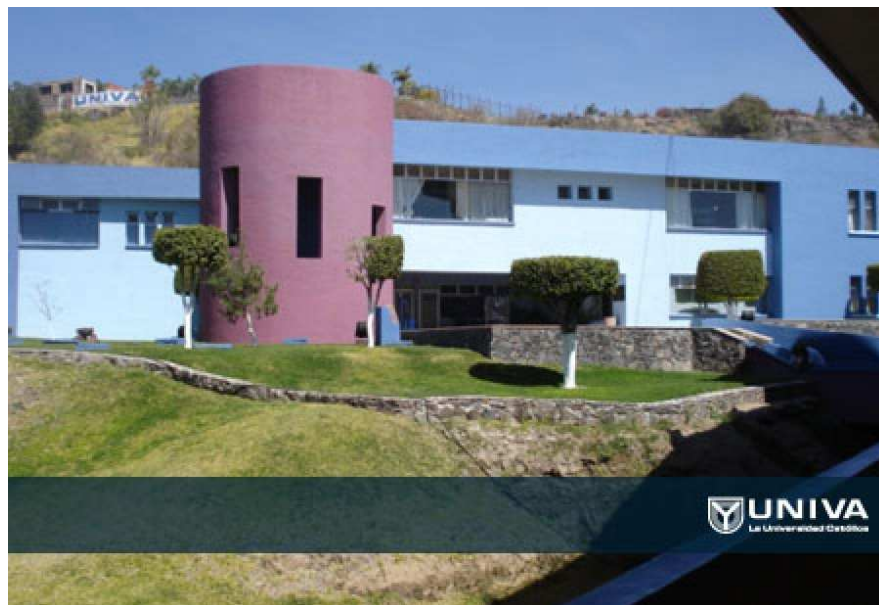
Fotografía 3. UNIVA campus la Piedad, escuela reconocida a nivel nacional, portafolio de archivos, 2013