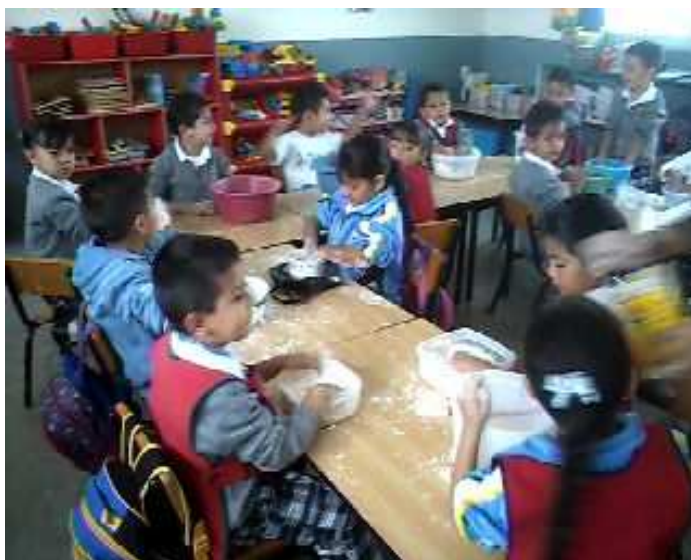
Fotografía 10. Los niños jugando y a la vez tratando de manipular el material, para realizar masa, portafolio de evidencias 2013