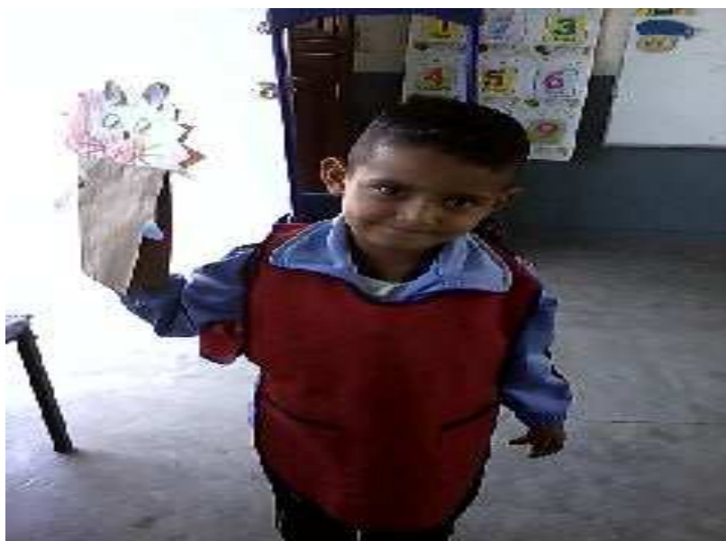
Fotografía 27. Los alumnos trabajando en su león, así mismo desarrollando sus habilidades motrices, creatividad portafolio de evidencias 2013