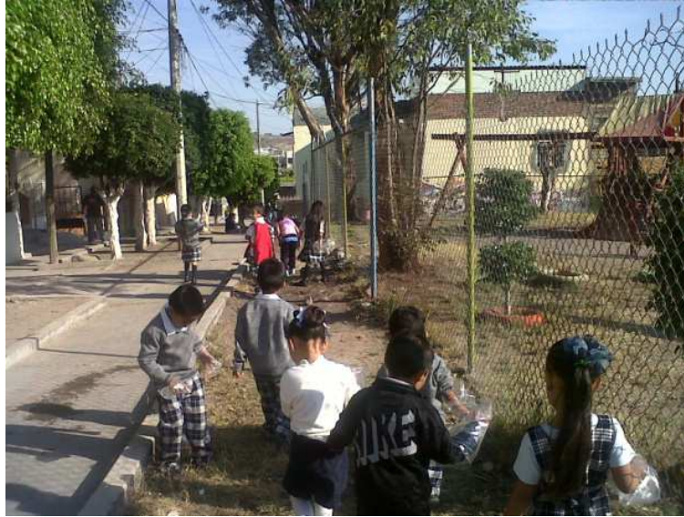
Fotografía 23. Los pequeños de 3er grado salieron emocionados en busca de pequeñas hormiguitas, para conocerlas, enseguida cada niño venció miedos y logro mantener un equilibrio en los rectángulos de esponja, porfolio de evidencias 2012