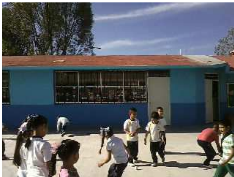
Fotografía 11. Los alumnos jugando, aprendiendo, socializando y desarrollando capacidades, portafolio de evidencias del grupo escolar 2012