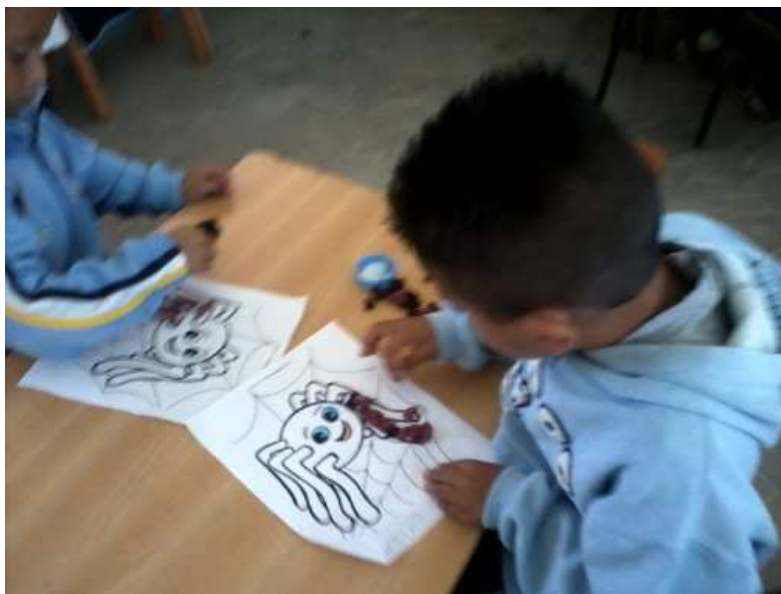
Fotografía 21. Se puede apreciar como el alumno ya obtiene mayor precisión en la elaboración de su trabajo, archivo de evidencias 2012