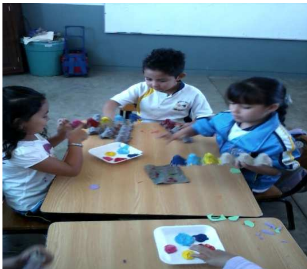
Fotografía 24. Se muestra a los alumnos de 3er año, con gran empeño realizando una oruga, con material reciclado y se realizó un dibujo de la investigación de las hormigas, portafolio de evidencias 2012