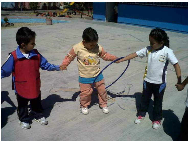
Fotografía 25. Se aprecia el grupo de 3er grado jugando y desarrollando su direccionalidad, espacio y lateralidad, portafolio de archivos 2012