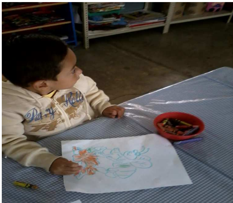
Fotografía 15. Coloreando un dibujo, donde se observa la falta de precisión al momento de elaborar su dibujo, portafolio de evidencias, 2012