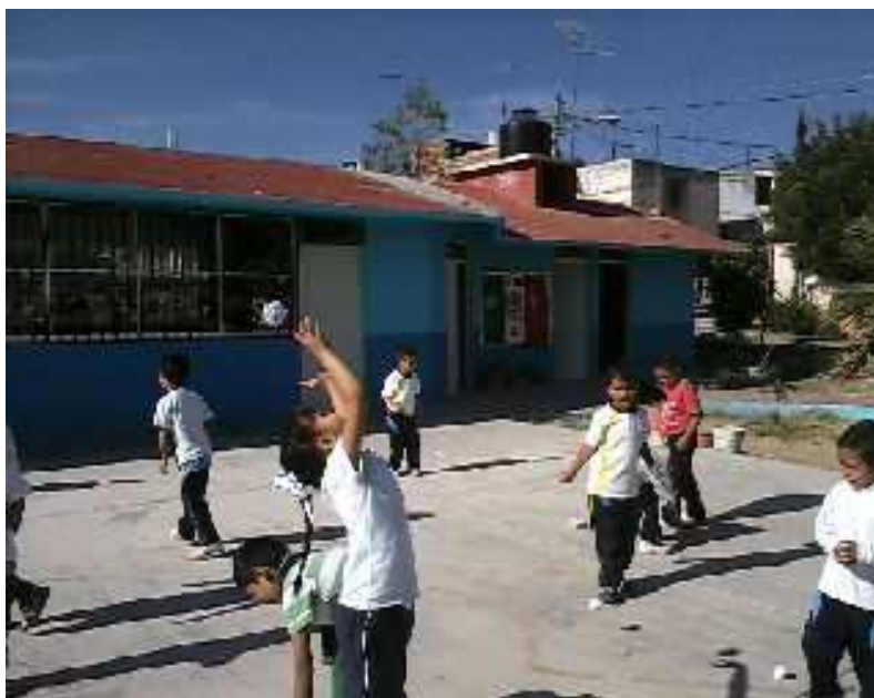
Fotografía 26. Mediante el juego se aprecia el desarrollo del niño, en su noción espacial y su coordinación óculo- manual, portafolio de evidencias 2012