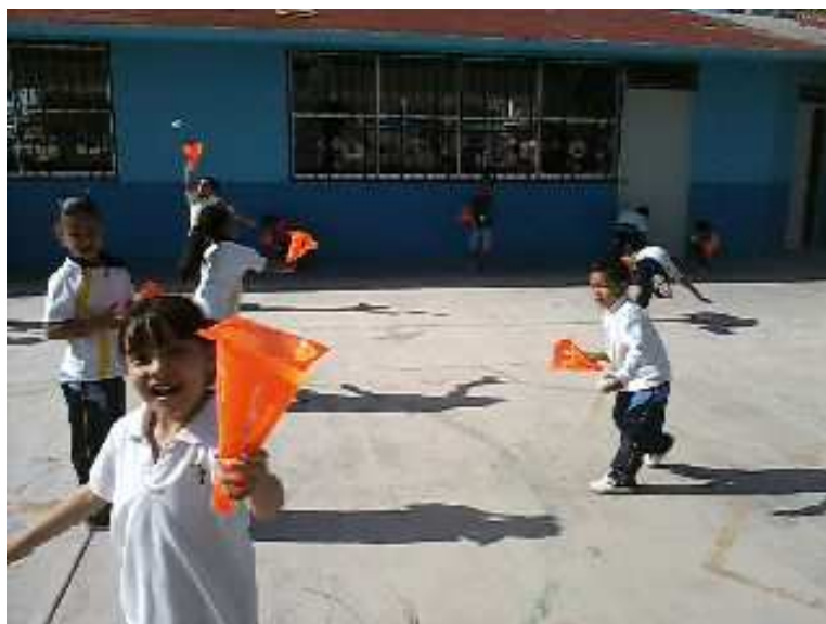
Fotografía 20. El grupo de 3ro jugando entusiastamente, con novedosas actividades en el patio central de la institución, portafolio de evidencias 2012