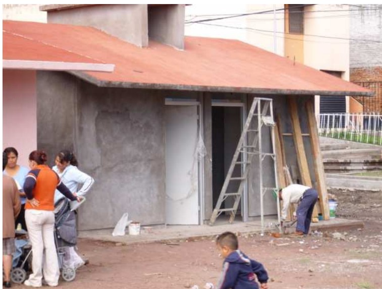
Fotografía 4. Comenzando el Jardín de niños Bertha Von Glumer Leyva, portafolio de archivos de su historia 2001