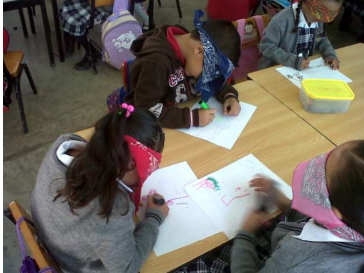
Fotografías 16. Se muestra a los alumnos apropiándose del material, con nuevas estrategias de trabajo, el cual ayuda a desarrollar sus conocimientos y habilidades, portafolio de evidencias 2012