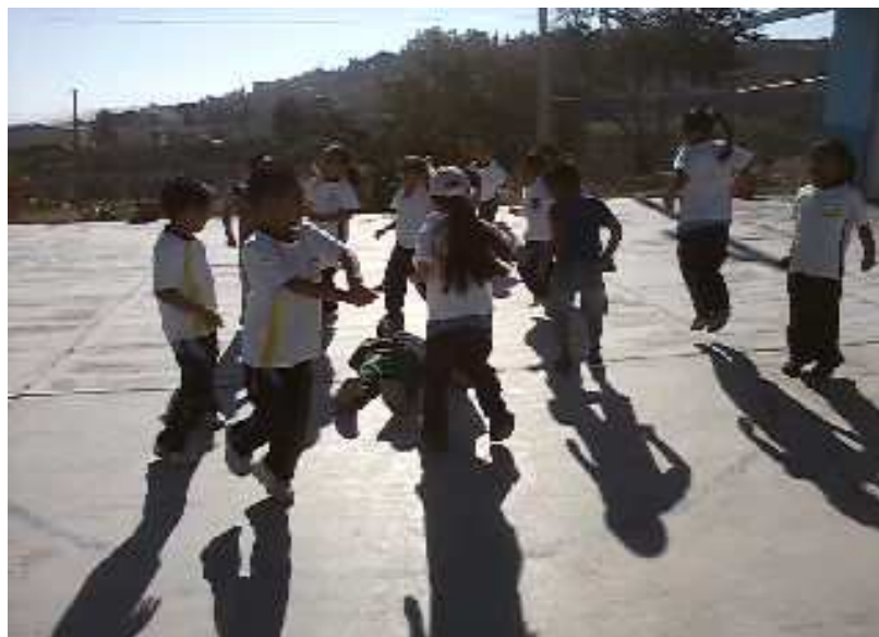
Fotografía 29. Los niños jugando, cantando, socializando y desarrollando sus habilidades, imagen del portafolio de evidencias 2013