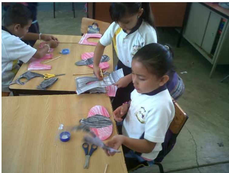
Fotografía 28. Se presenta los niños concentrados realizando sus trazos precisos, para elaborar la actividad, y terminar una catanita, imagen proporcionada del portafolio de evidencias 2013