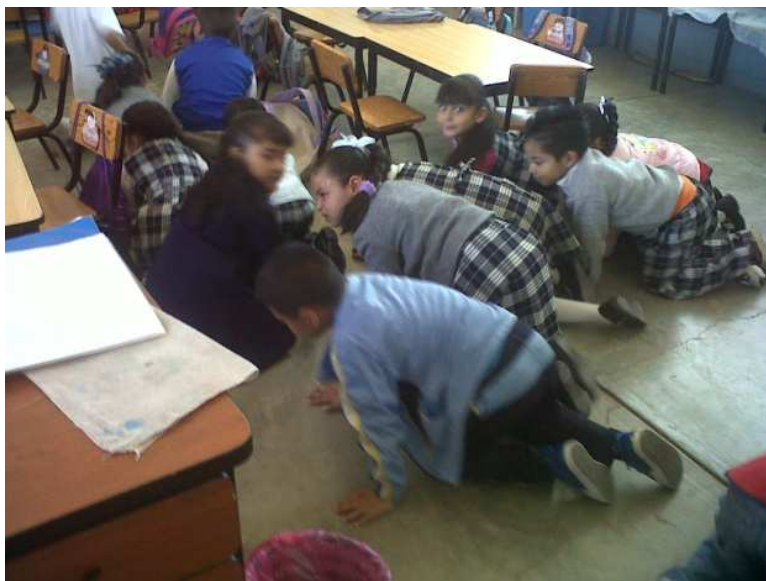
Fotografía 12. Los alumnos desarrollando su psicomotricidad jugando, portafolio del archivo de evidencias del grupo de 3ro, 2013