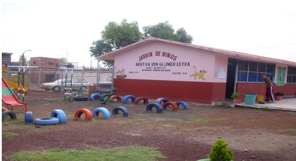
Fotografía 5. El Jardín de niños Bertha von Glumer Leyva después de 12 años, portafolio de evidencias de la escuela 2013.