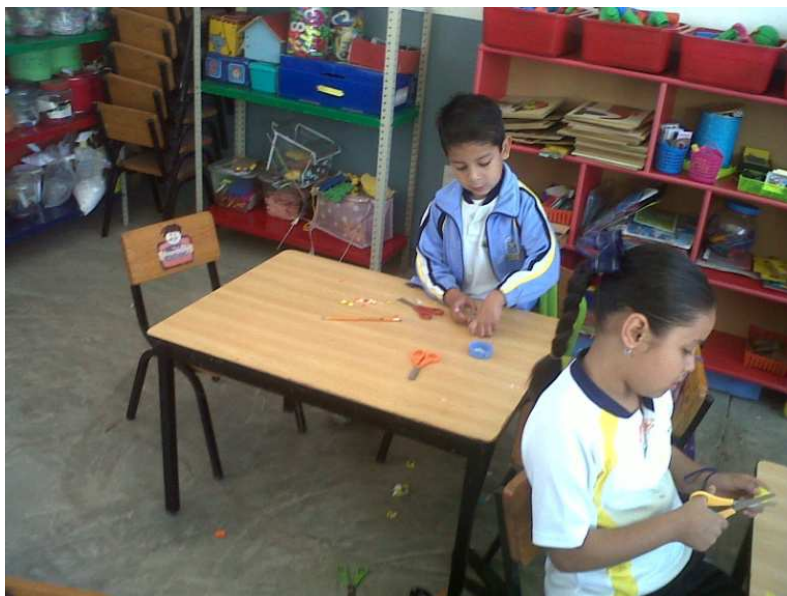
Fotografía 13. Cada alumno sentado en una mesa, con suficiente espacio para trabajar y con atención personalizada, así mismo el niño construyendo su propio aprendizaje, portafolio de evidencias 2012.