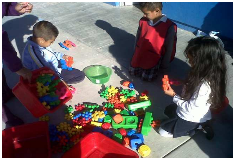
Fotografía 6. Los niños explorando y manipulando el material, portafolio de evidencias preescolar 2012.