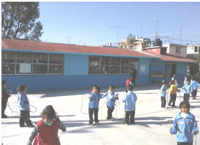
Fotografía 7. Los niños realizando algunas actividades psicomotoras, portafolio de evidencias 2012.