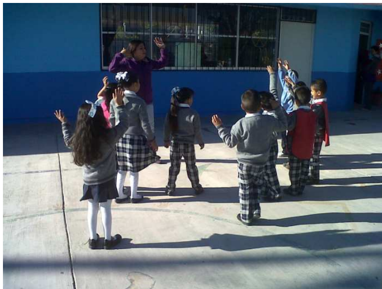
Fotografía 14. Todos los niños levantaban su mano para opinar en la actividad que se requería realizar en su proceso de aprendizaje, portafolio de evidencias del grupo de 3er grado 2012