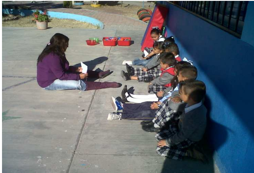
Fotografía 32. Respetando turnos, para escuchar a los compañeros que quieren opinar, para realizar la actividad, portafolio de evidencias 2013