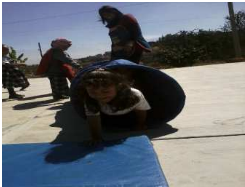
Fotografía 22. Se observa a los niños de 3er grado jugando en el gusano y a la vez desarrollando su psicomotricidad, de la misma manera se aprecia el mejoramiento de las actividades oculo – manual por medio del gusanito portafolio de evidencias 2012.