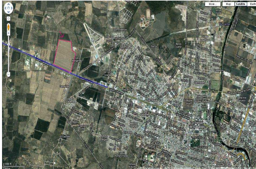
Fotografía 1. Mapa de la Piedad Michoacán, portafolio de archivos 2013