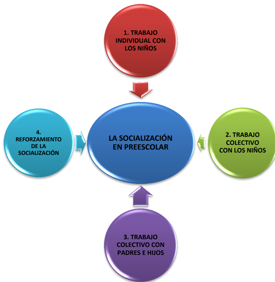
Figura 1. Situaciones didácticas para favorecer la socialización de los niños de 3 años en un ambiente educativo basado en competencias