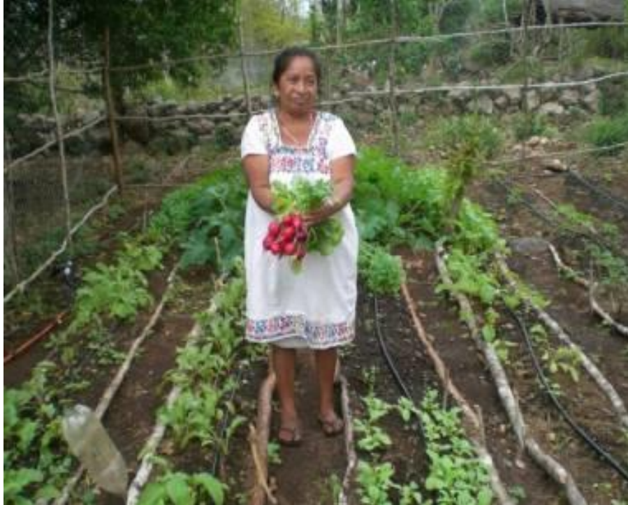
Habitante que se dedica al trabajo de las hortalizas