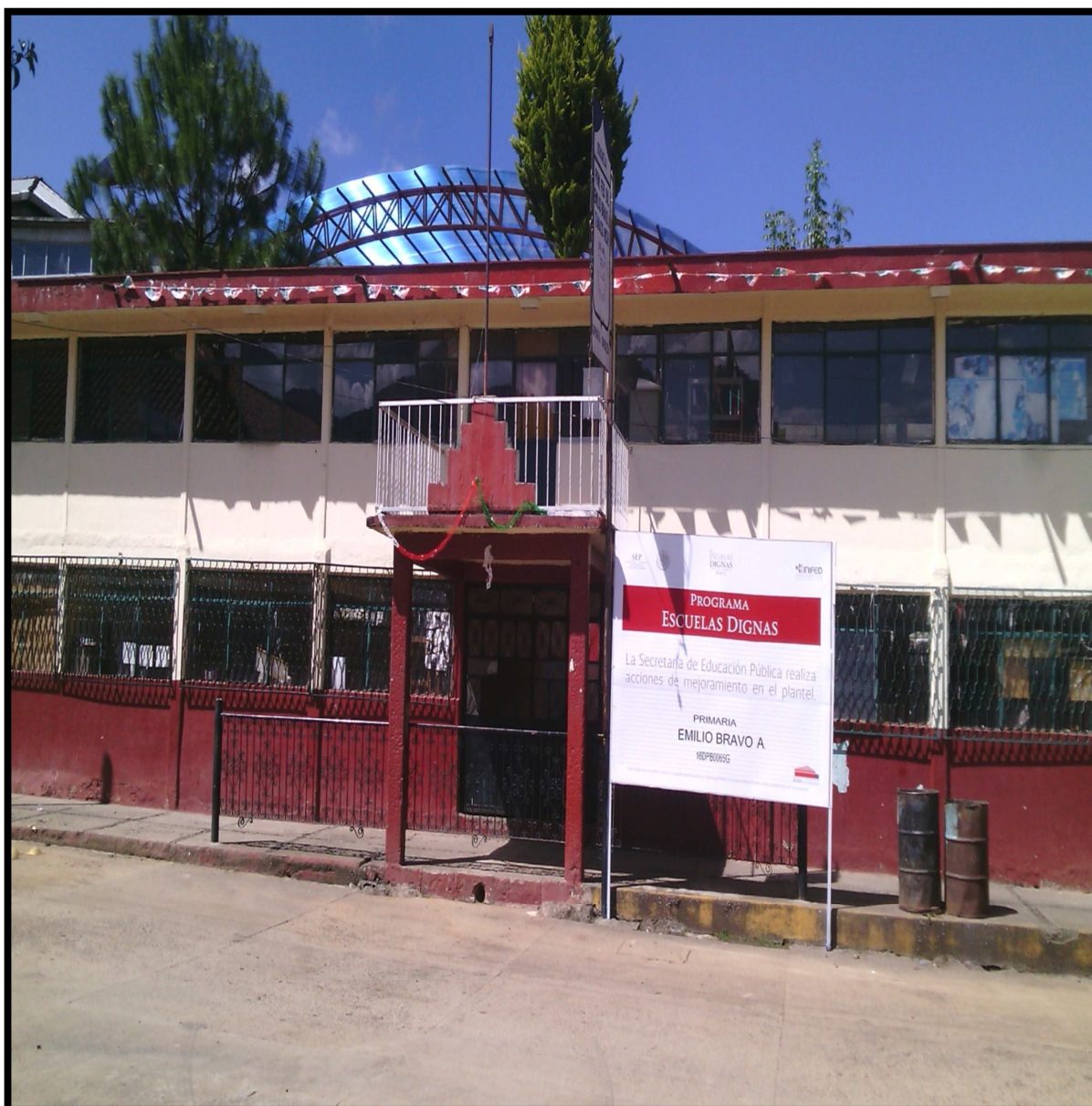
Imagen de la escuela.