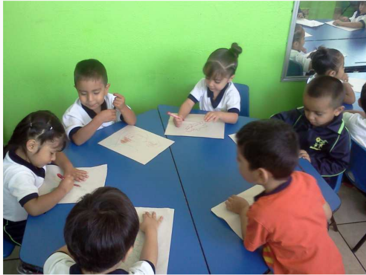
Niños dibujando a sus amigos

En esta actividad comencé cuestionando a los niños ¿si sabían que eran un amigo?, no me contestaron correctamente ya que una niña me contesto: "si maestra es un amigo", así que comencé a explicarles que era un persona con la cual conviven diario, juegan, se abrazan y que casi siempre están juntos, etc. Posteriormente empecé a explicarles la actividad a realizar, empezaron a socializar pero también a pelear un compañero decía yo voy a dibujar a este niño y el otro le contestaba no yo lo voy a dibujar, así que les comenté que podrían dibujar al que quisieran que no importaba si otros de sus compañeros dibujaba al mismo.