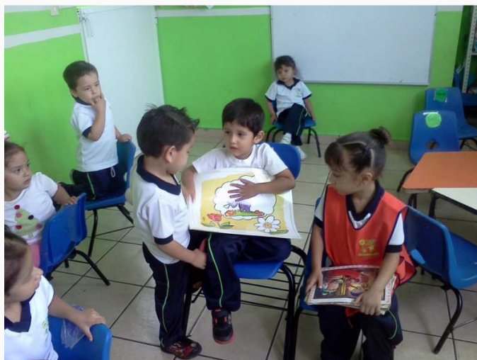
Niños organizándose para narrar el cuento

Esta actividad la comienzo invitando a los niños a representar y narrar un cuento, les mostré varios libros relacionados con el tema, fue así como ellos empezaron a escoger el que más les agradaba, la dificultad es que algunos querían el mismo, se me acerca un niño llorando y me dice una maestra yo quiero ese cuento, pero su compañero ya lo había escogido primero así que tuvo que escoger otro, al momento representar el cuento todos estaban muy atentos excepto uno que estaba molestando a un compañero.