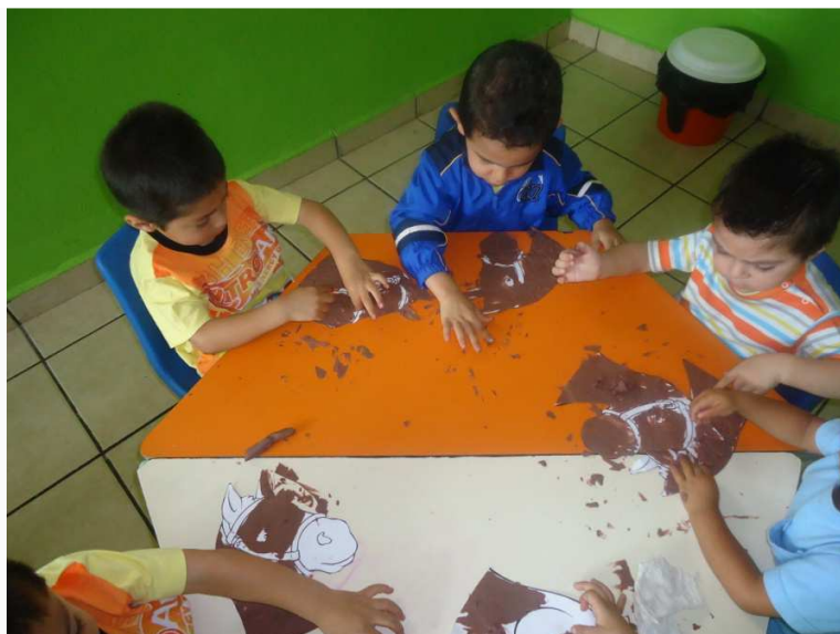
Niños realizando su títere.

Esta actividad se inició explicándole a los niños de qué se trata la actividad a realizar, pasé a explicarles de mesa por mesa, en qué consistía, a algunos niños les agradó la idea de hacer un títere ellos solos, otros niños querían trabajar otro tipo de material ,un niño hasta lloró pero después accedió, la mayoría trabajó bien , pero algunos pelearon por el material, cuando se llegó el momento de la obra, a algunos niños que son un poco tímidos no quisieron participar, pero la mayoría lo hizo, se divertieron mucho.