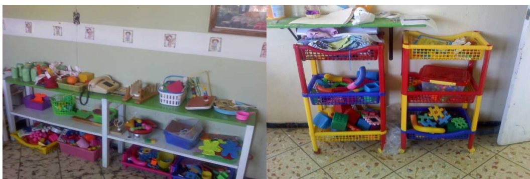
Imagen 5. Material del Aula

El material en el salón de clases está acomodado en un lugar apropiado donde los niños puedan alcanzarlo con facilidad.