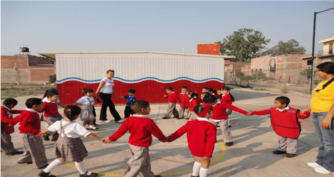
Imagen 9. Jugando con los niños “amo ato” y una madre de familia