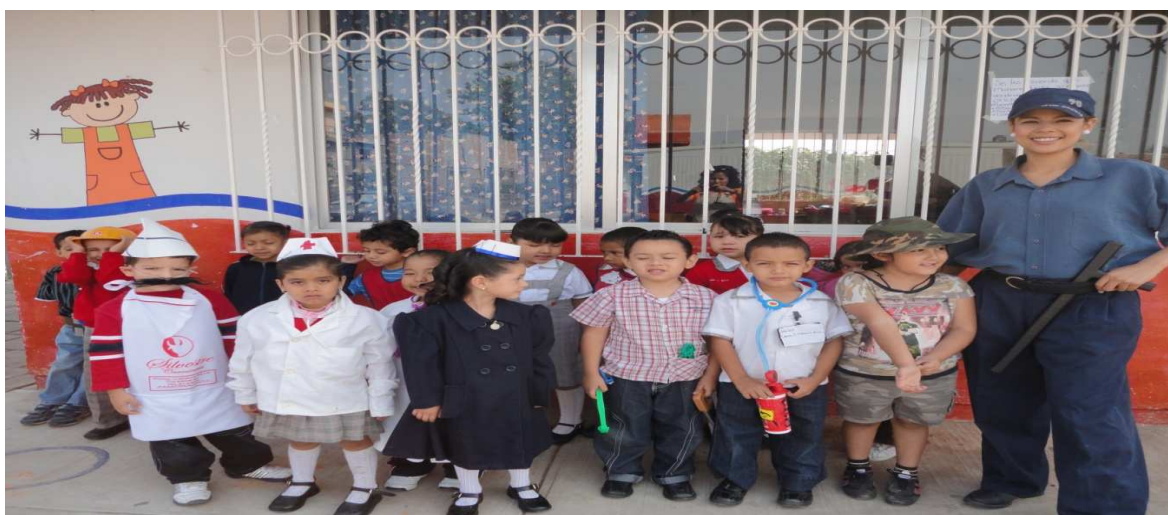
Imagen 8. Dramatización de personajes

Mi personaje fue de policía y al verme los niños vestida así su expresión fue grande, todos estaban sorprendidos porque me puse un bigote, tanto así que un niño se expresó libremente diciéndome que con eso me veía ridícula y que así no le gustaba porque yo era una mujer y que no tenía porque ponerme eso si también había mujeres policía.