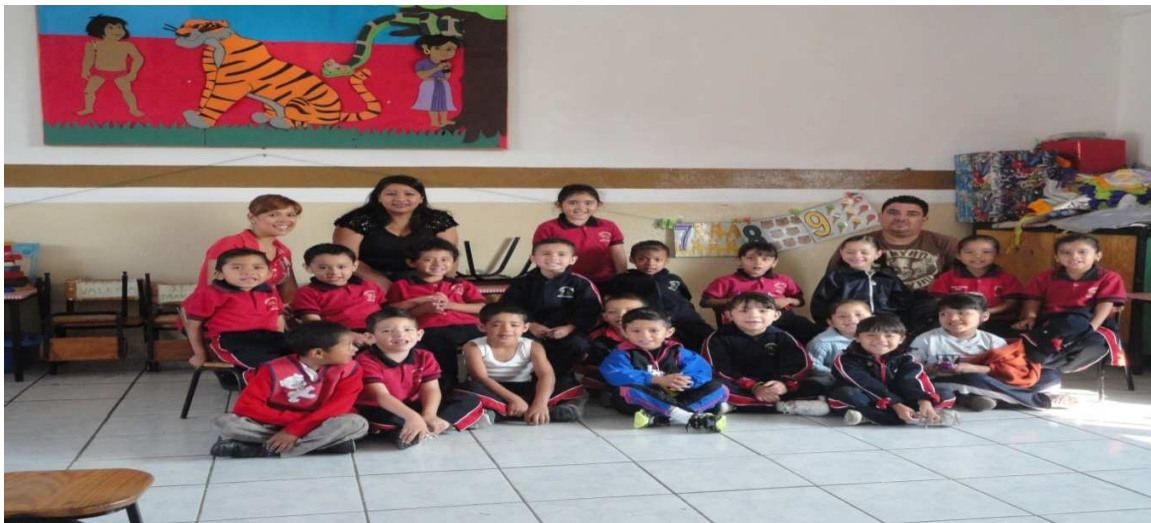
Imagen 7. Papás que me apoyaron en la actividad