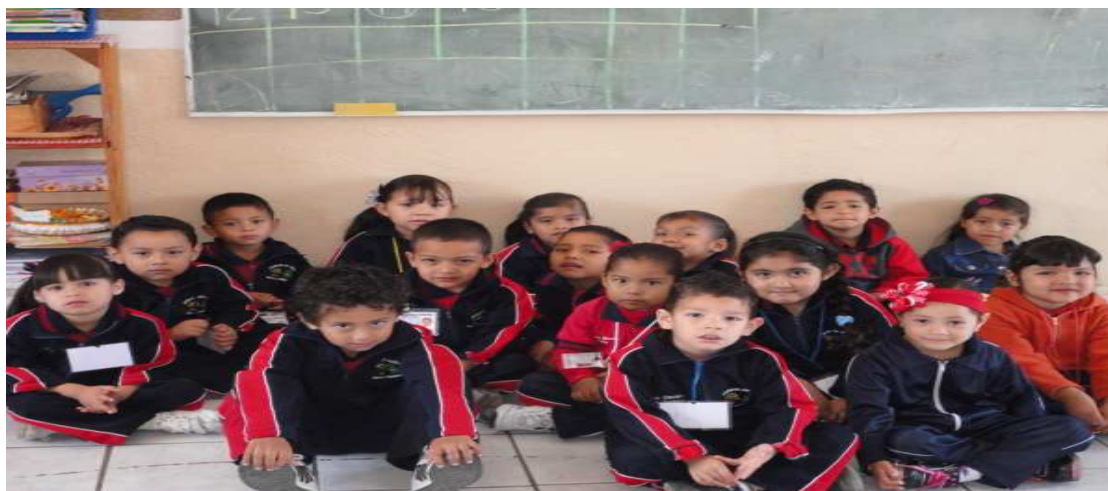
Imagen 4. Integrantes del grupo de segundo de preescolar

El grupo con el que trabajo es segundo de preescolar, lo integran 26 niños, 11 niñas y 15 niños, a cargo del grupo está una titular y yo como auxiliar.