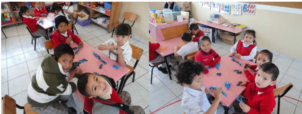
Imagen 6. Niños de segundo de preescolar en el aula

Los niños son muy amigables y hay mucho compañerismo, claro no puede faltar una que otra pelea, cuando surge una situación así la resuelvo platicando con los niños que la provocan.