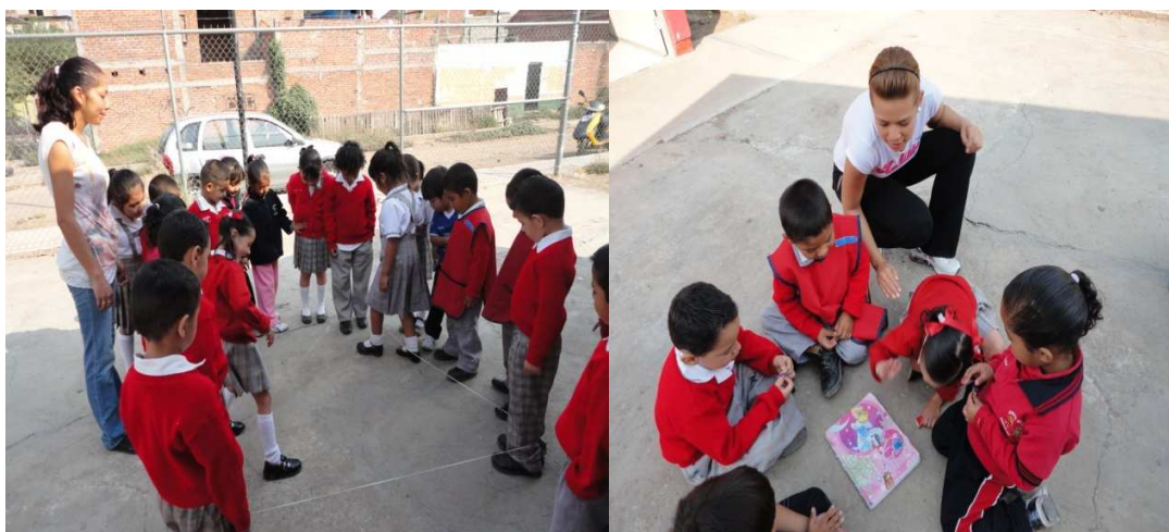
Imagen 10. Los niños y una madre de familia jugando “resorte” y “estampitas”

Se evaluó la integración de los niños entre compañeros, los valores, amistad, tolerancia respeto y amor, la responsabilidad de los papás con las tareas y el trabajo en equipo