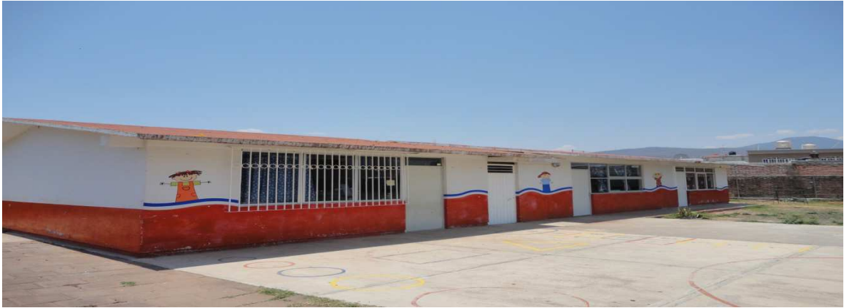
Imagen 3. Salones y patio del J/N "Emilia Ferreiro".