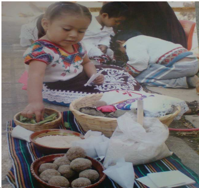
ANEXO 1. Niña participando en el trueque