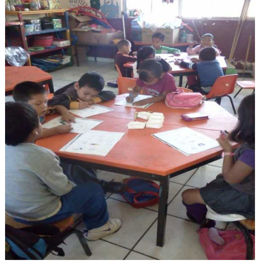
ANEXOS 3 Y 4. Niños trabajando en equipo