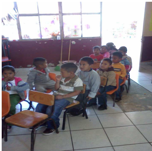
ANEXO 2. Jugando a transportarse en camión