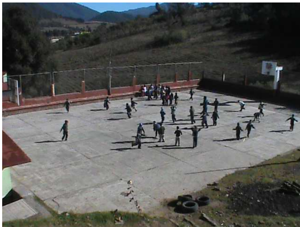
ANEXO 6: INFRAESTRUTURA GENERAL DE LA ESCUELA