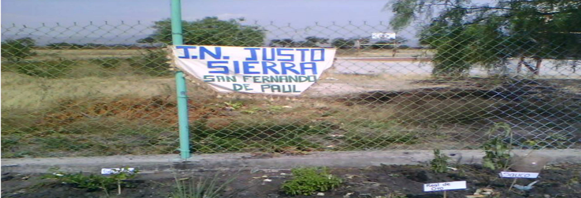
ANEXO 8: fotografía del valor de la esperanza y respeto.