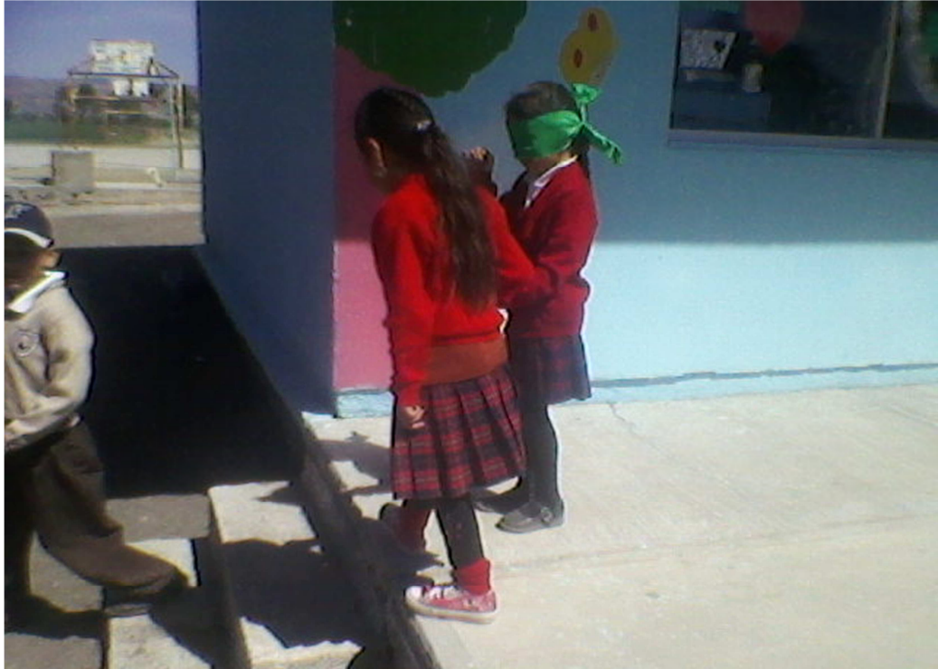
ANEXO 5: fotografía del valor de la seguridad.