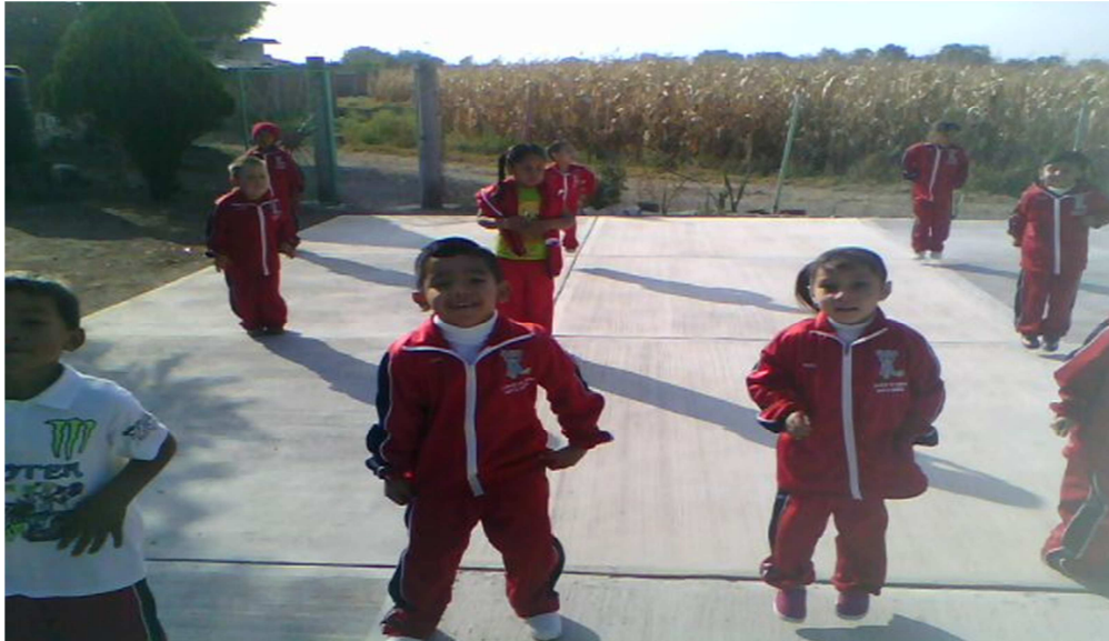
ANEXO 4: fotografía de los niños.