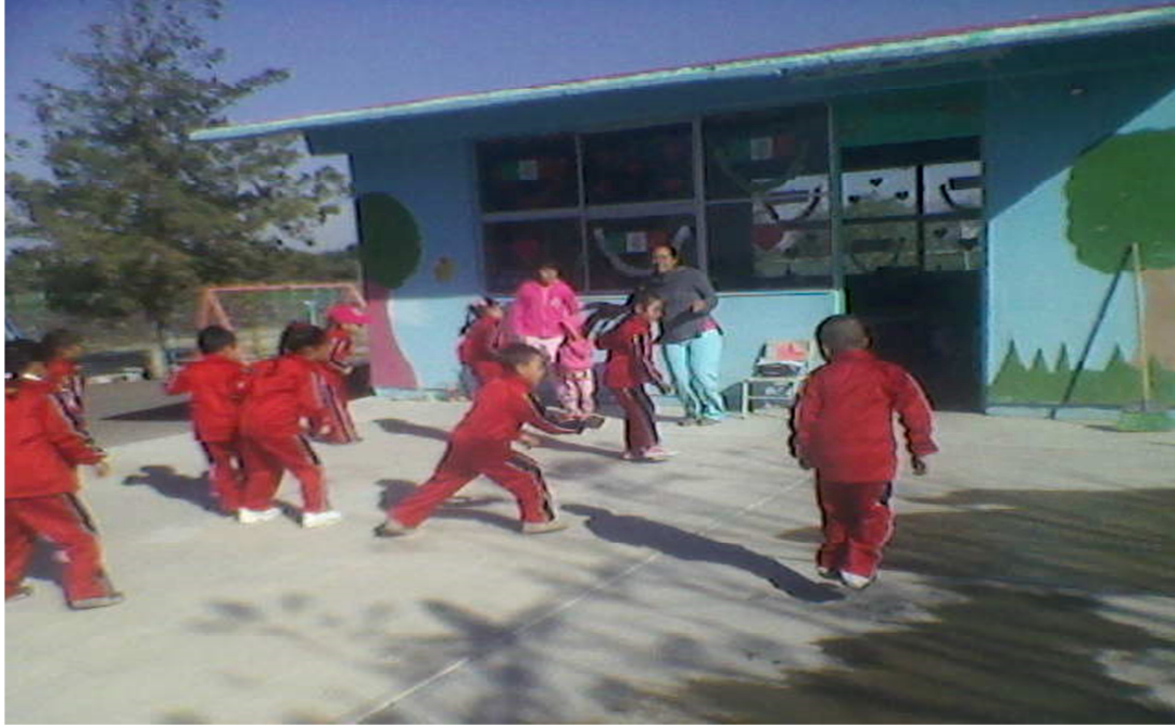
ANEXO 3: fotografías de la institución escolar.