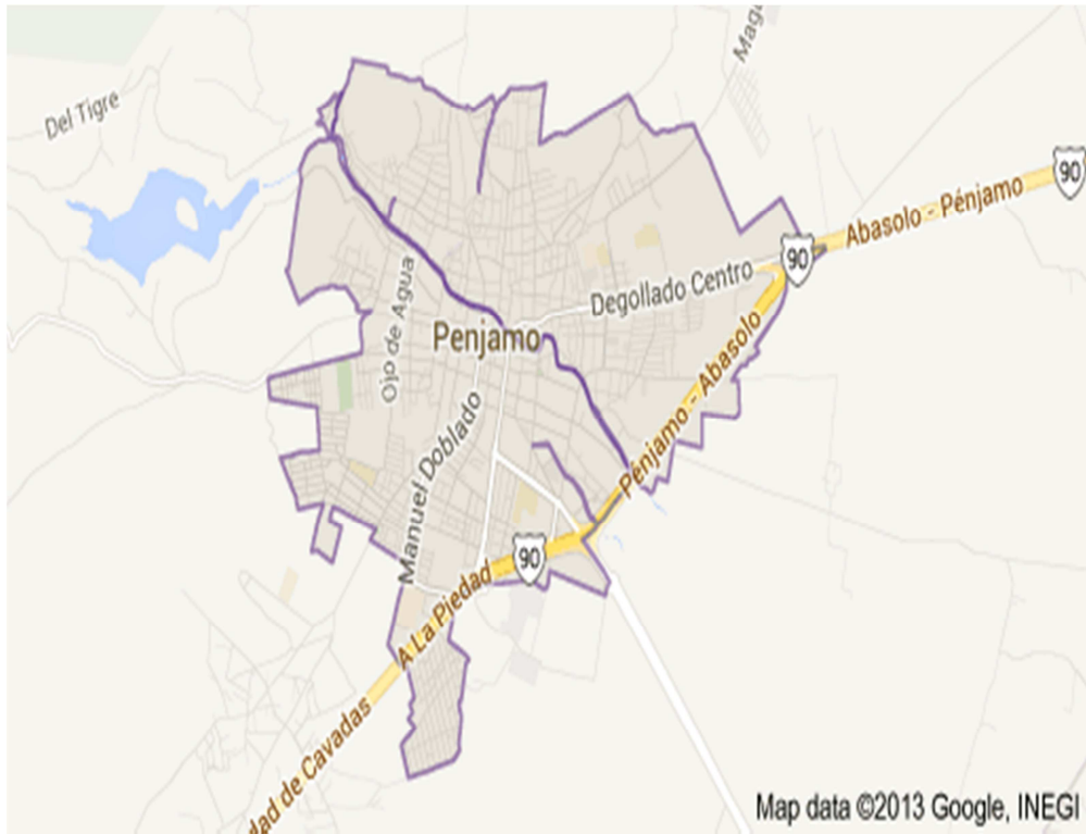
ANEXO 2: mapa de Pénjamo