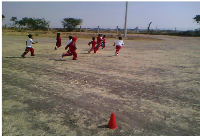
ANEXO 7: fotografía del valor de la honestidad.