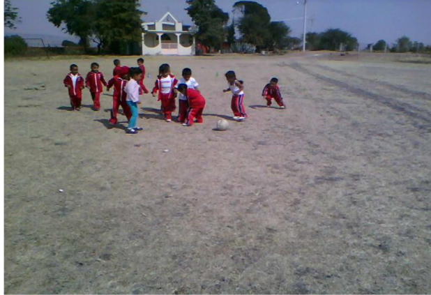
ANEXO12:fotografía jugando en equipo y con reglas