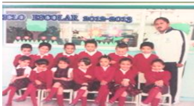
ANEXO 14: fotografía grupal ciclo escolar 2012-2013