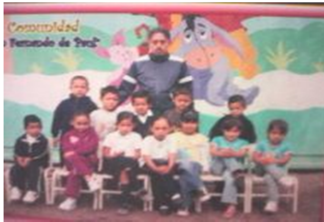
ANEXO 13: fotografía grupal ciclo escolar 2010-2011