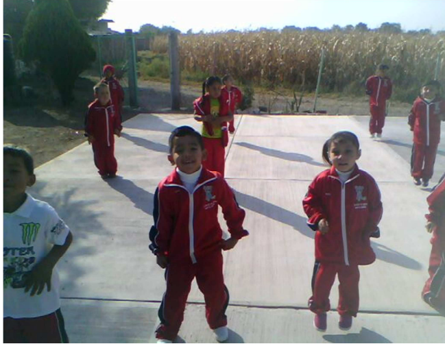
ANEXO 10: fotografía realizando activación física