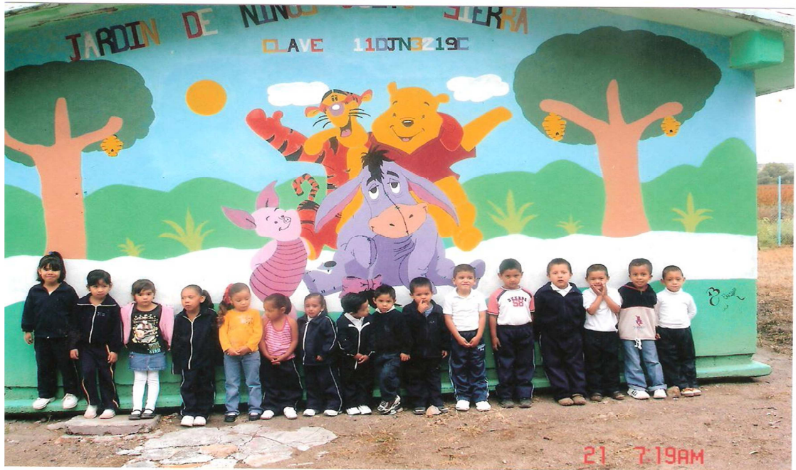
ANEXO 6 fotografía grupal