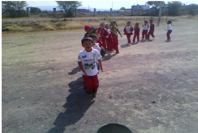
ANEXO 11: fotografía realizando educación física