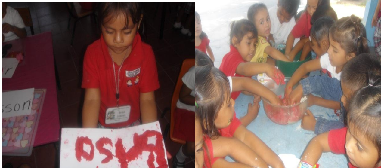
Haciendo el experimento de la masa de colores y colocándola sobre su nombre