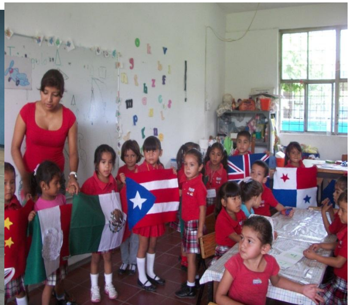
Exposición de las banderas de la ONU

a los demás grupos. Fotografía 6. Portafolio de evidencias 2012