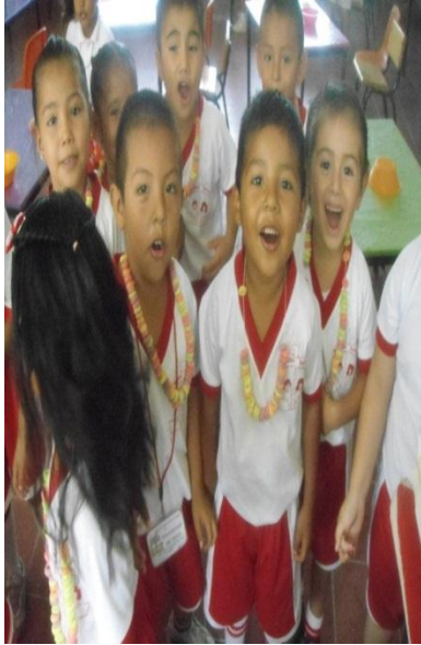
Formando su propio collar de cereal