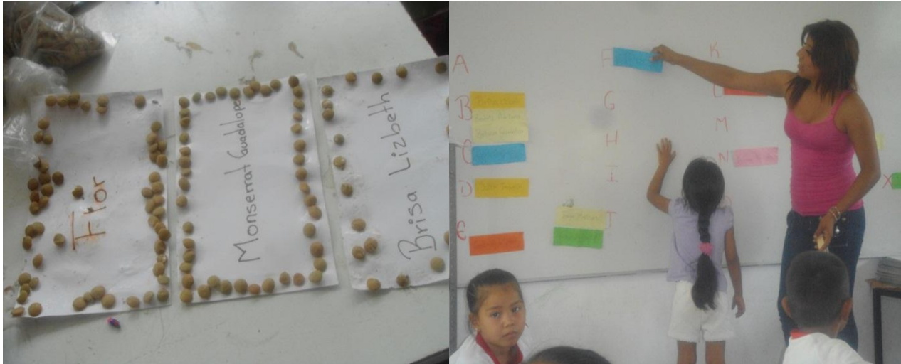
Realizando su gafete con semillas de lenteja e Identificando la letra inicial de su nombre