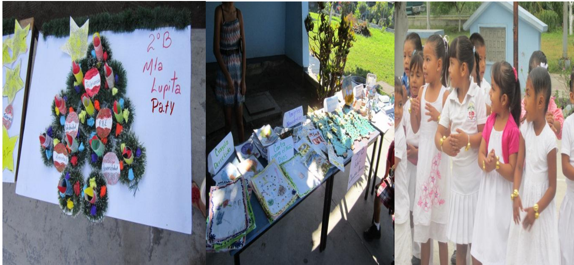
Exposición de trabajos navideños realizados por los alumnos