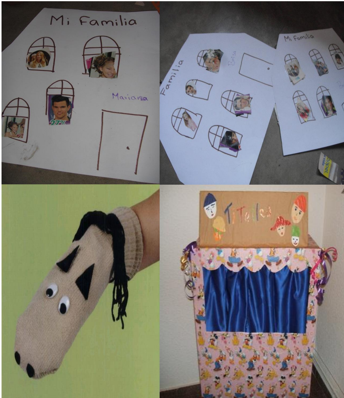
Fotografía 3. Elaboración de casitas y representación teatral, portafolio de evidencias, 2013.