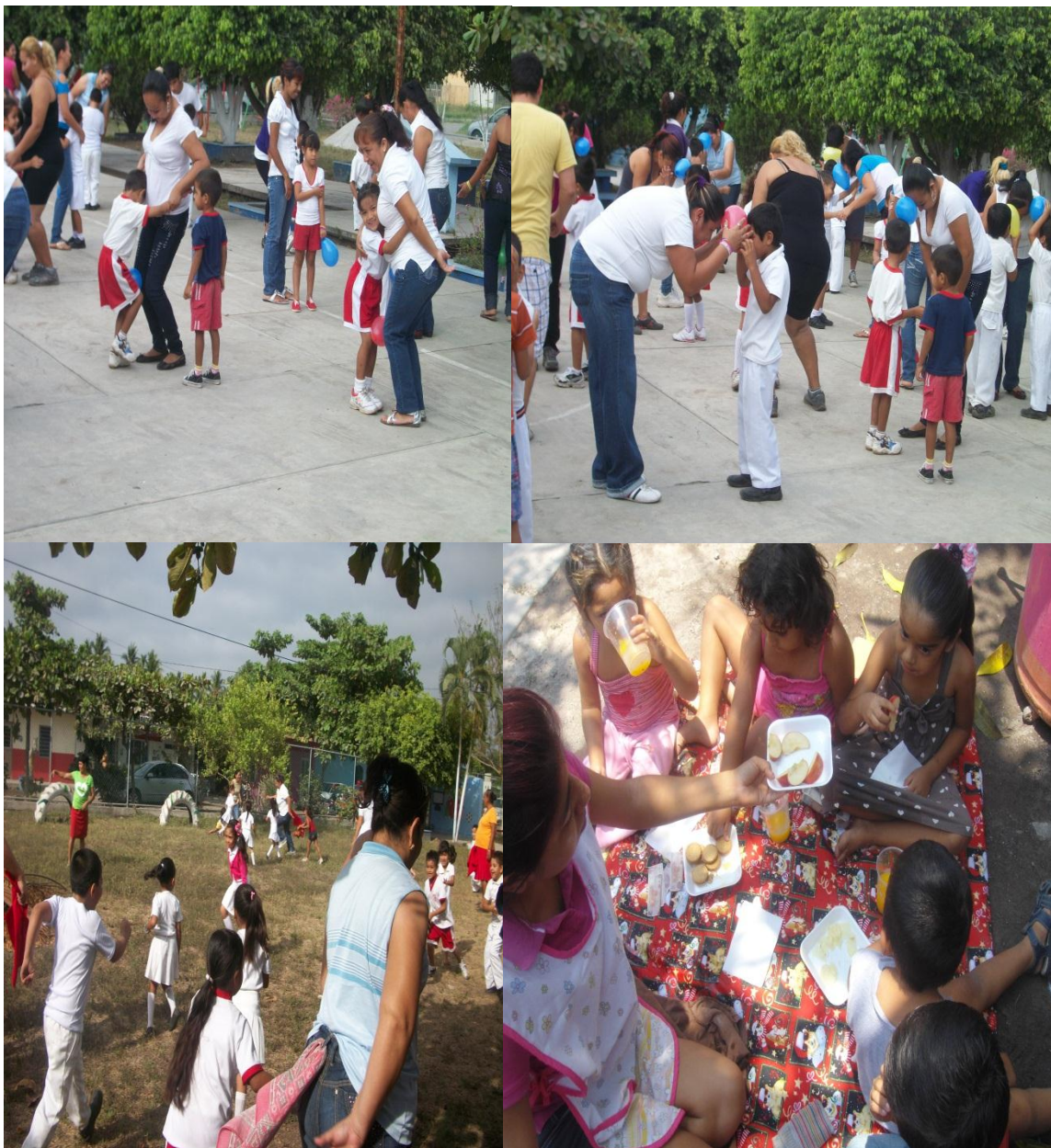
Fotografía 11. Convivencia con padres de familia y día de campo,