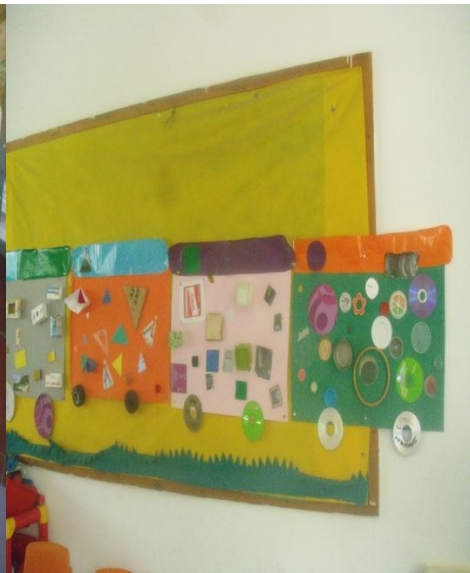
Tren realizado con objetos de figuras geométricas