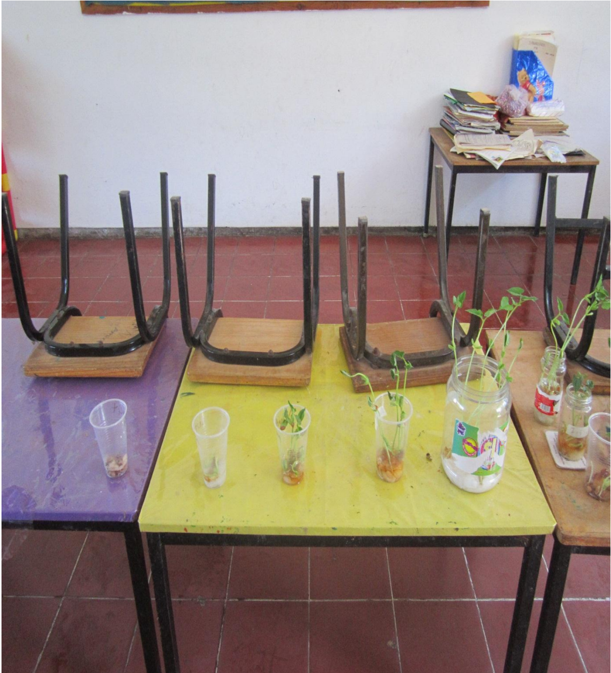
Fotografía 9. Germinación de la semilla de frijol, convertida en plantita, portafolio de evidencias, 2013.