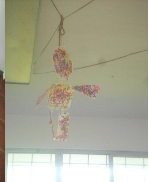
móvil de las figuras geométricas