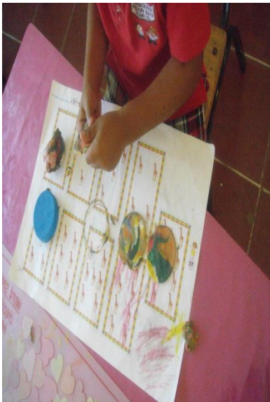
Confeccionando figuras círculos de plastilina