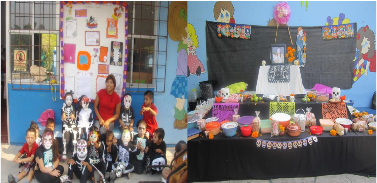
Altar prehispánico realizado por los niños y representación del baile (tumbas, tumbas)