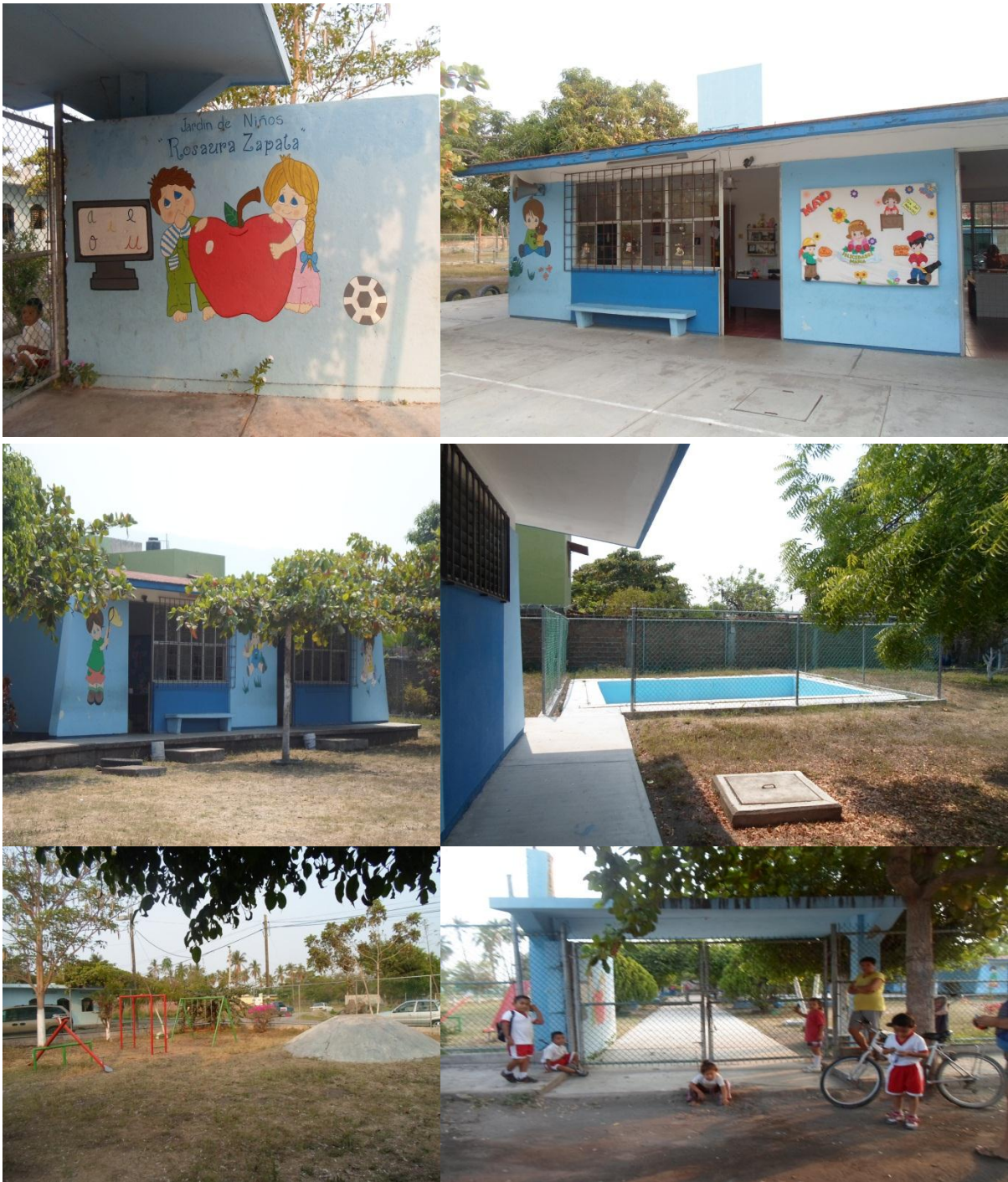
Fotografía 1. El plantel y los juegos que se encuentran dentro de ella, portafolio de evidencias, 2013.