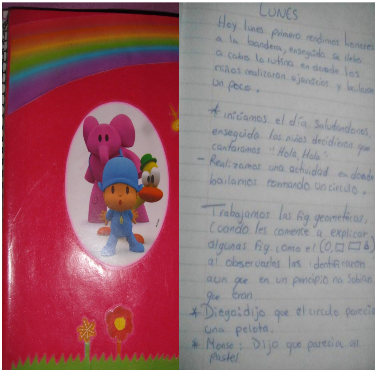
Fotografía 2. El diario de campo, portafolio de evidencias, 2013.