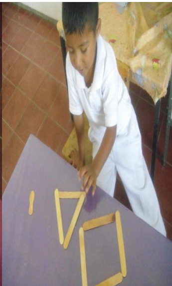
Realizando figuras con palitos de paleta