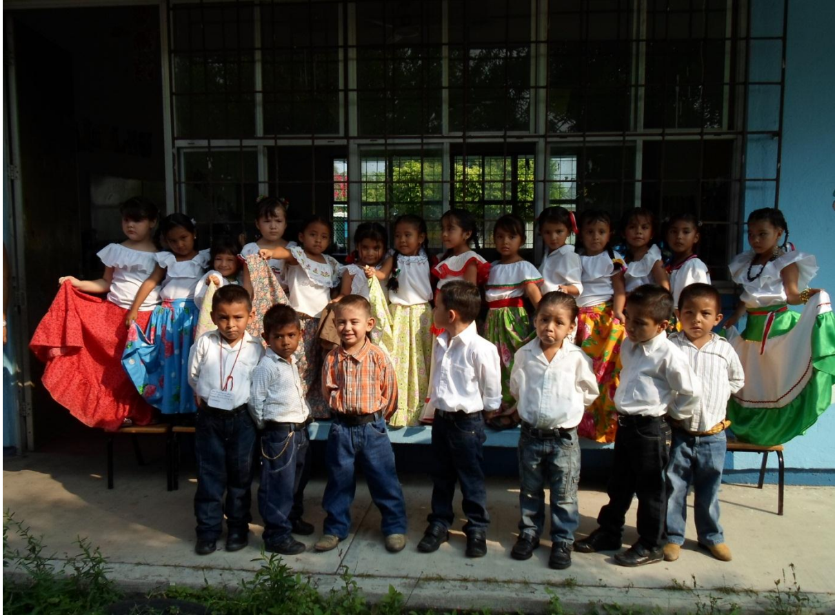
Representación del bailable del 20 de noviembre