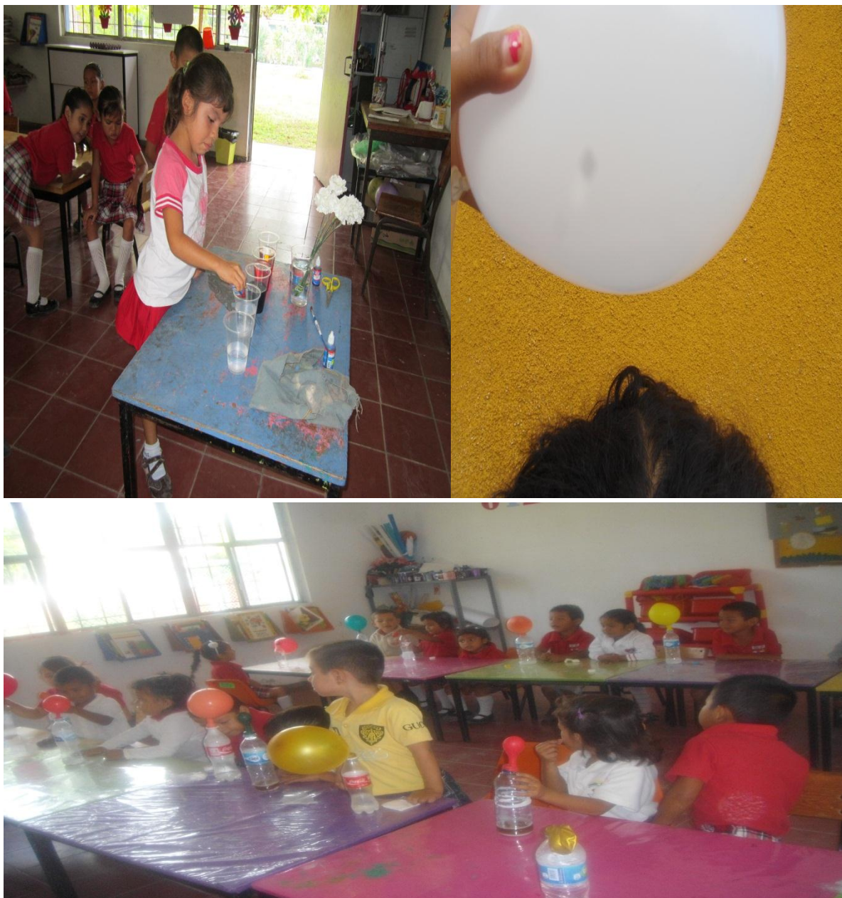
Fotografía 10. Experimento de la flor que pinta, la electrización y el globo que se infla con bicarbonato y vinagre, portafolio de evidencias, 2013.