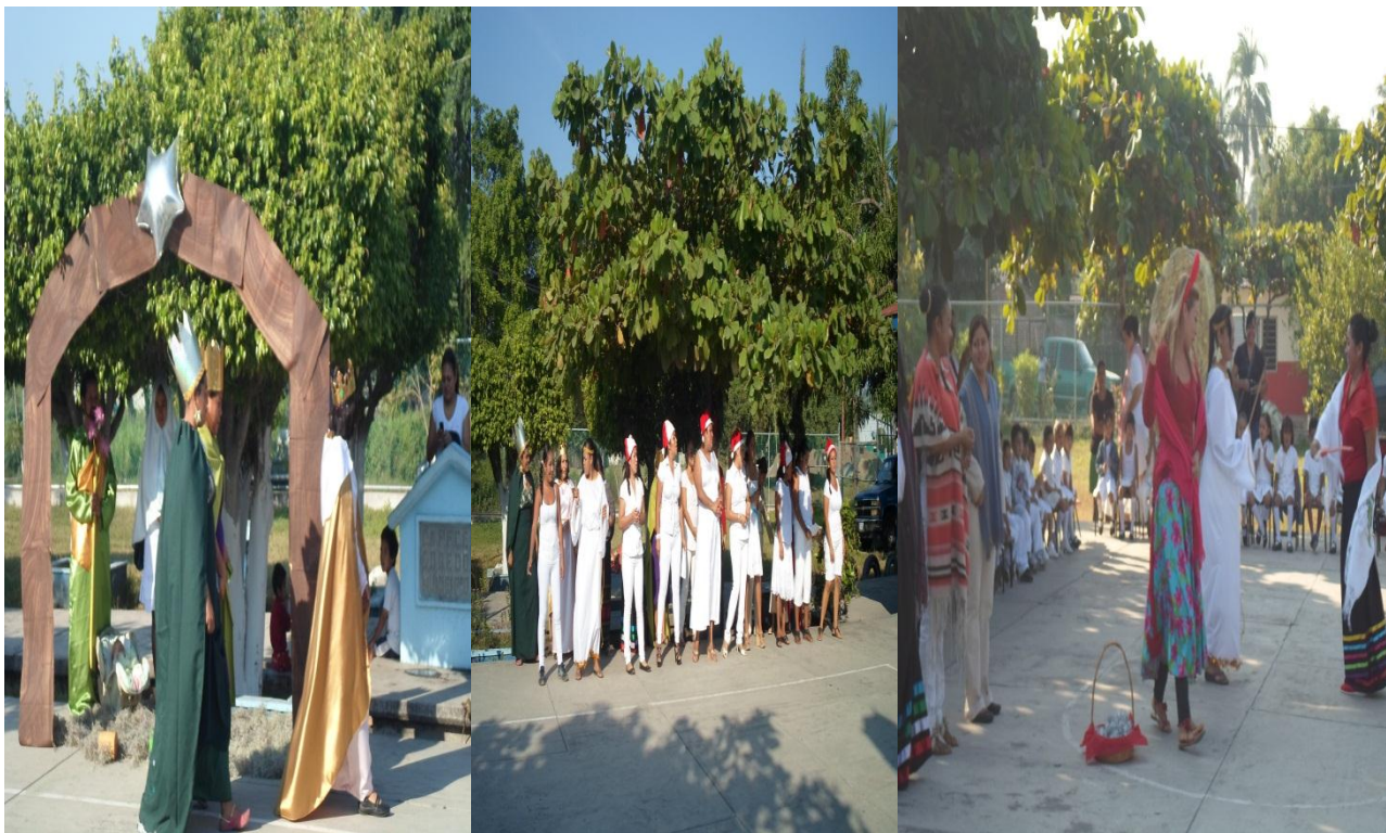
Representación de la pastorela y del villancico preparado por los padres de familia