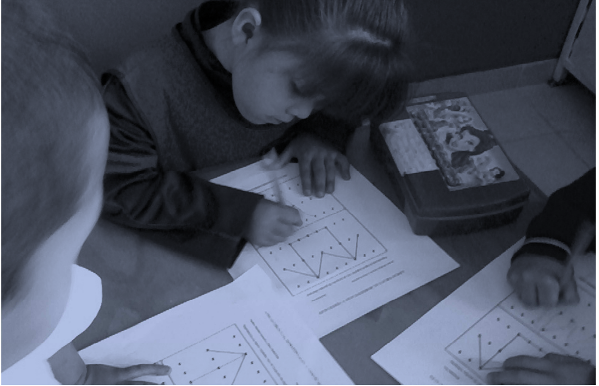
Foto 6. Alumnos realizando una actividad previa a la lecto- escriura.