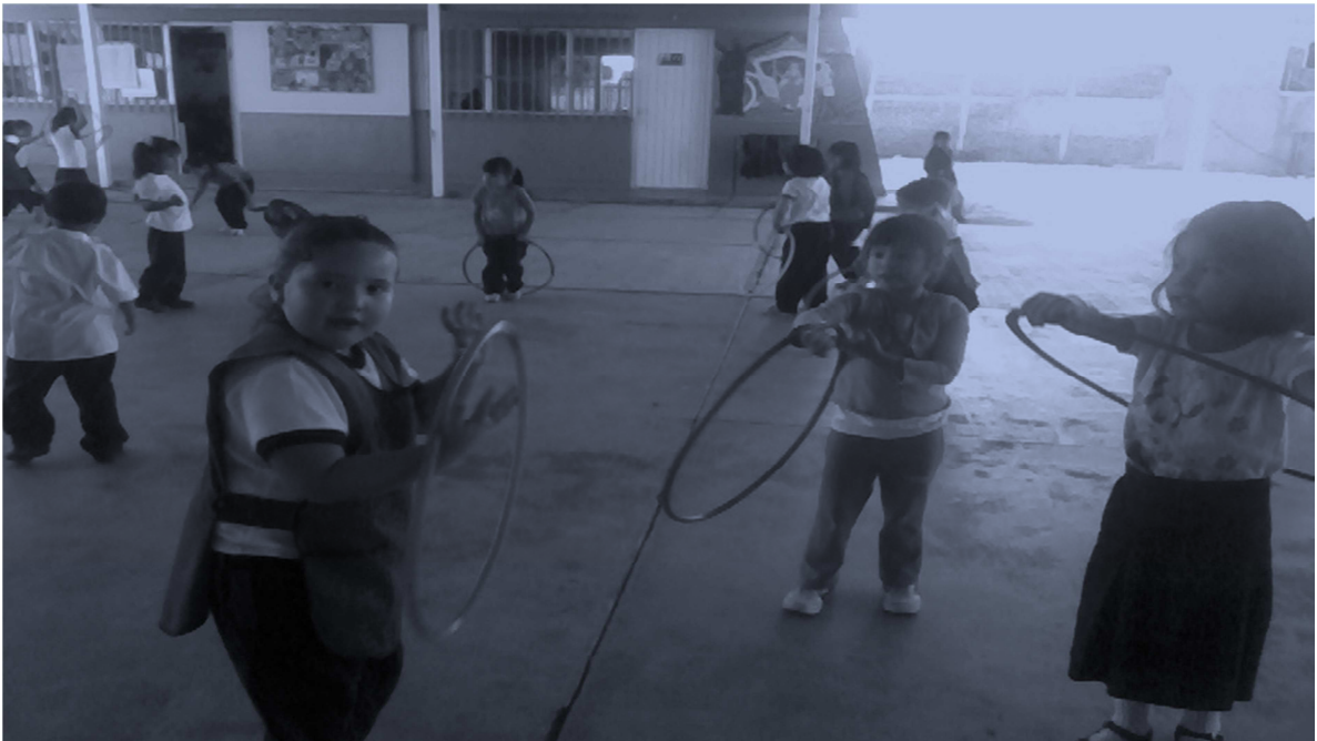
Foto 2. Alumnos realizando deportes para desarrollar sus capacidades cognitivas y afectivas.

Como inicio de actividad se entonó una canción para lograr una integración de grupo, y un clima favorecedor, se les cuestionó sobre el tema, en los cuales ellos estuvieron participativos, opinando, comentando, se les dio indicaciones sobre la manera en que se iba a trabajar, se les pidió que salieran al patio de la escuela para practicar algunos tipos de deportes (fut- bol, correr, brincar, trasladar la pelota de un lugar a otro, golpear la pelota con suavidad, caminar hacia atrás, saltar la cuerda, girar aros, etc). Después ellos sugirieron algunas formas de trabajar con el material, y para finalizar la actividad se tuvo una relajación corporal.