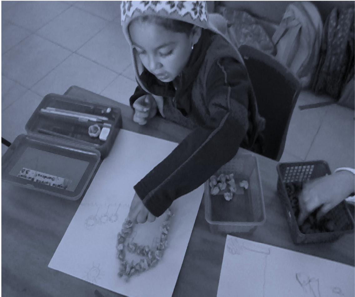
Foto 3. Alumna realizando boleado, como actividad motriz, para favorecer al posterior uso correcto del lápiz y pueda trazar con facilidad grafías.