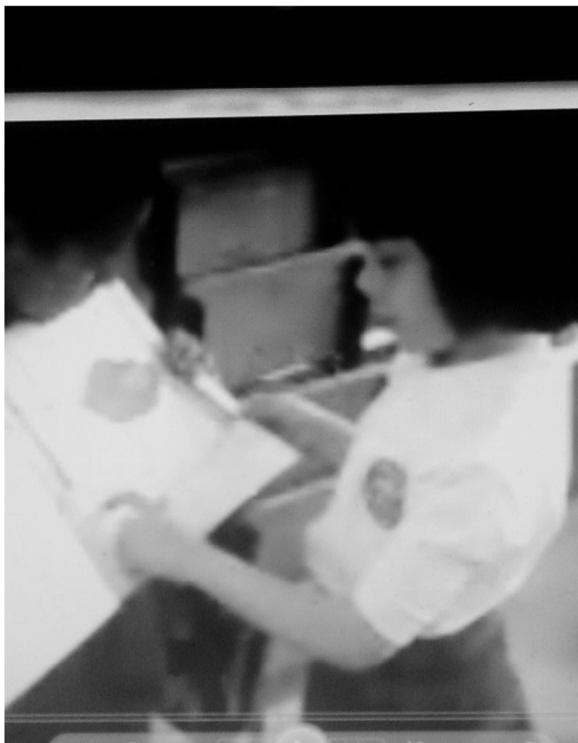
Foto 10. Alumna leyendo un cuento a sus compañeros.