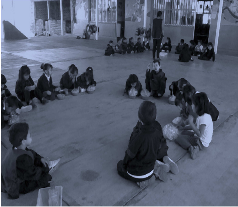
Foto 4. Alumnos realizando una actividad creativa para la realización de ejercicios buco- faciales.