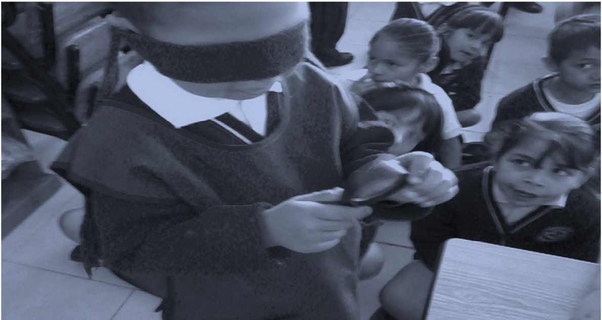
Foto 1. Alumno utilizando sus sentidos y haciendo una descripción del objeto que eligió.

Al retomar la importancia de la utilización de los sentidos se reafirma que los alumnos reconozcan que cada uno de ellos son importantes para acceder a los conocimientos y sobre todo enriquecer su lenguaje y alcanzar los objetivos plateados. Y esto se pudo lograr a través de esta actividad, despertando en ellos una curiosidad y experimentando a través de sus sentidos para saber el funcionamiento de cada uno.