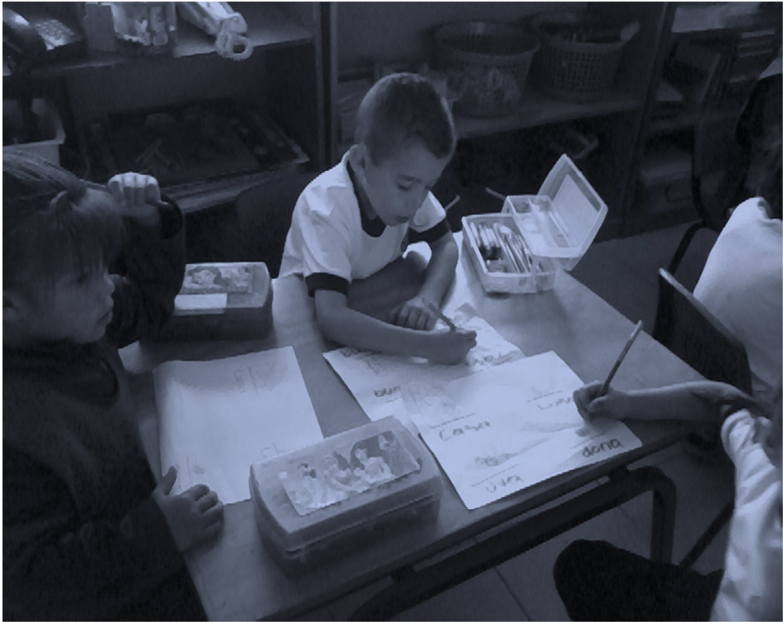
Foto 5. Alumnos copiando palabras a las que le encontrarán otra con la cual rimen.