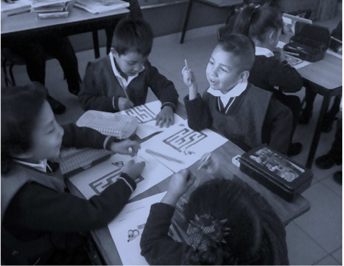
Foto 8. Alumnos realizando la actividad del cuidado de los animales.