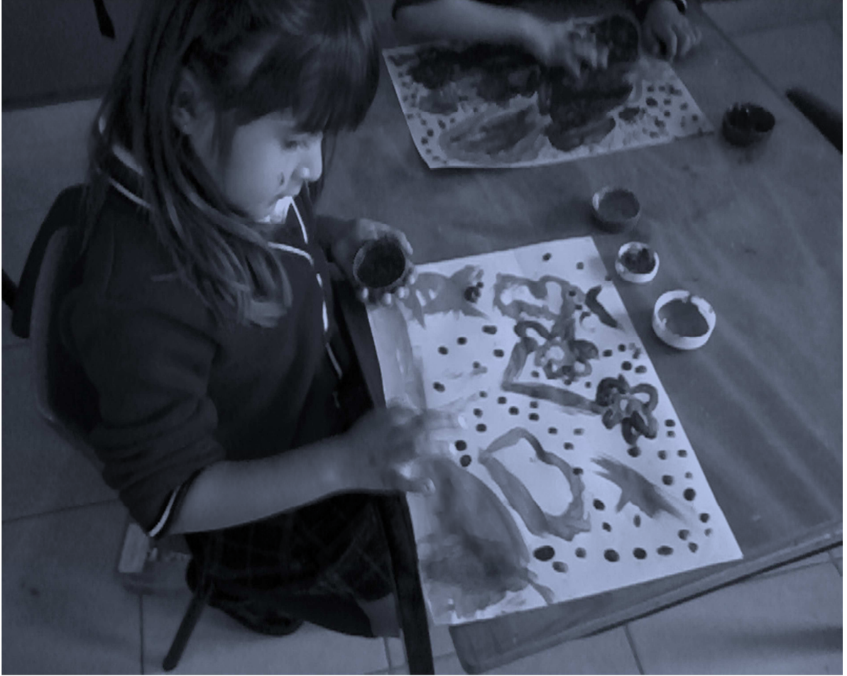
Foto 9. Niños plasmando gráficamente lo que escucharon de la lectura.