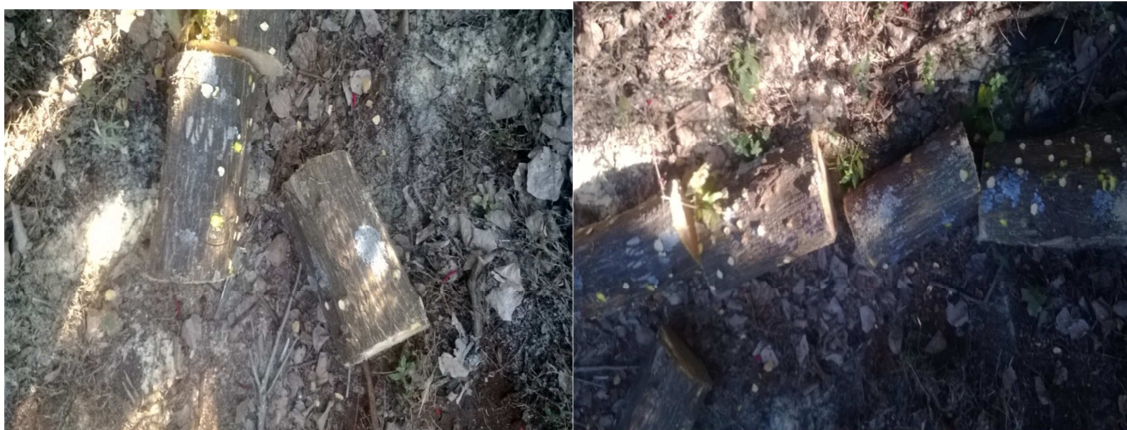
(Trozos que se utilizan para la elaboración de la máscara)

Para la elaboración de esta se utiliza la madera, el hacha la cual se utiliza para cortar el árbol en trozos de 30 centímetros.