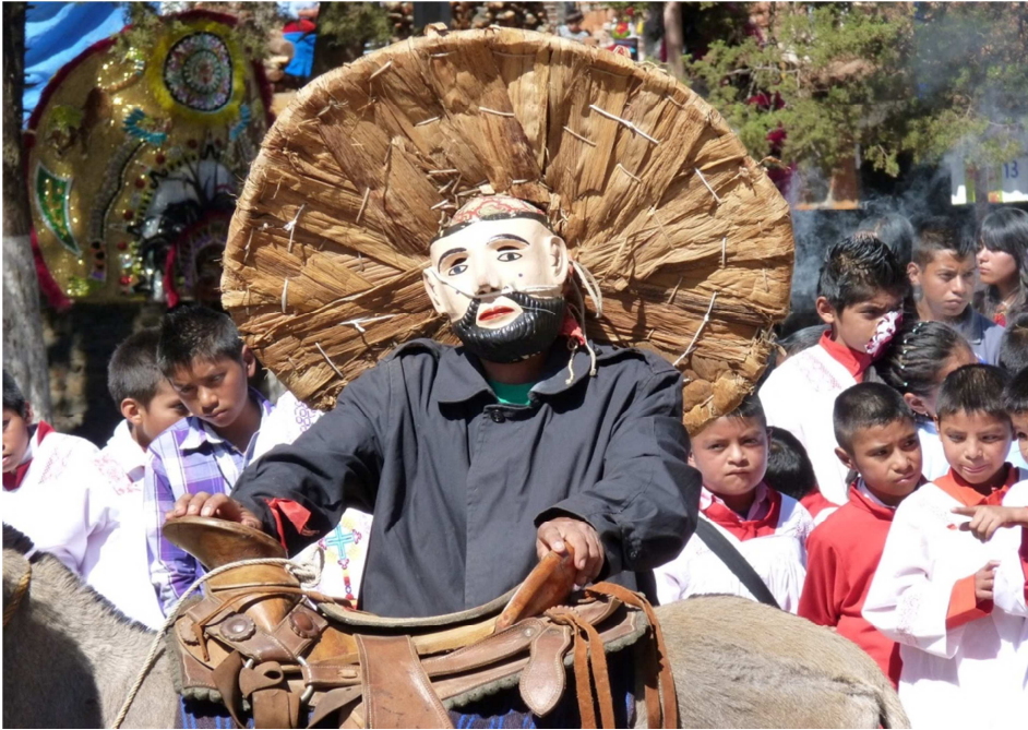
ANEXO 5 (aquí observamos como los niños están atentos ante la explicación que les doy sobre la máscara)