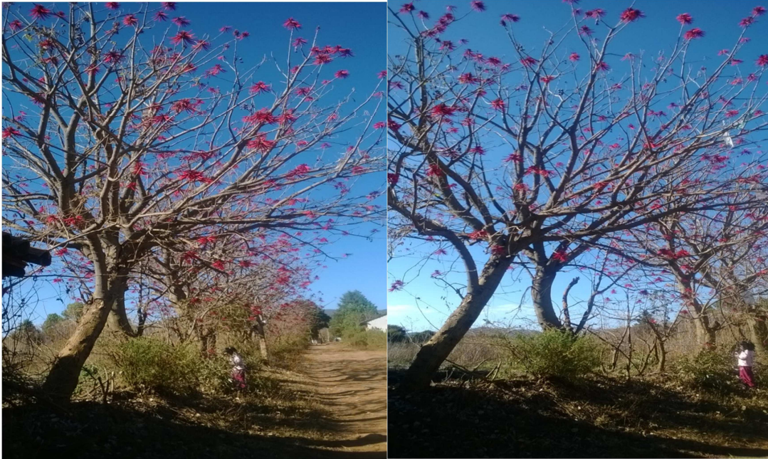
(Árbol donde se corta la madera)

Para la elaboración de esta se utiliza la madera, el hacha la cual se utiliza para cortar el árbol en trozos de 30 centímetros.