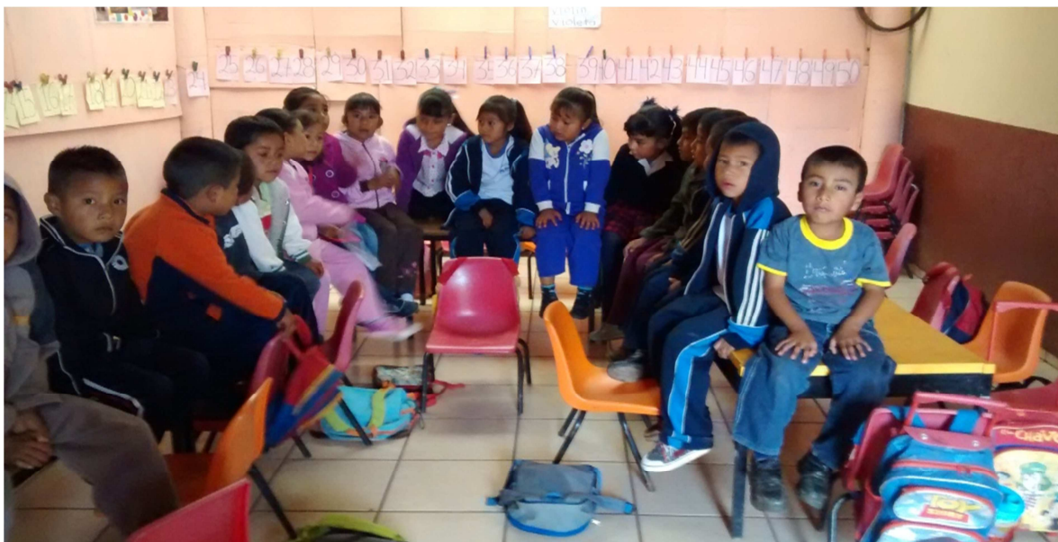
(Se observa a los niños atentos a la explicación y observan las fotos)

Pero les dije, yo les voy a enseñar las fotografías, cómo es que las hace y aquí yo les voy ayudar a realizarlas, todos dijeron si maestra, ¿cuándo? y les dije hasta el jueves porque hoy me van a dibujar, todo lo que vieron en las vacaciones, les di una hoja blanca y ellos sacaron su lápiz y sus crayolas y comenzaron a dibujar.