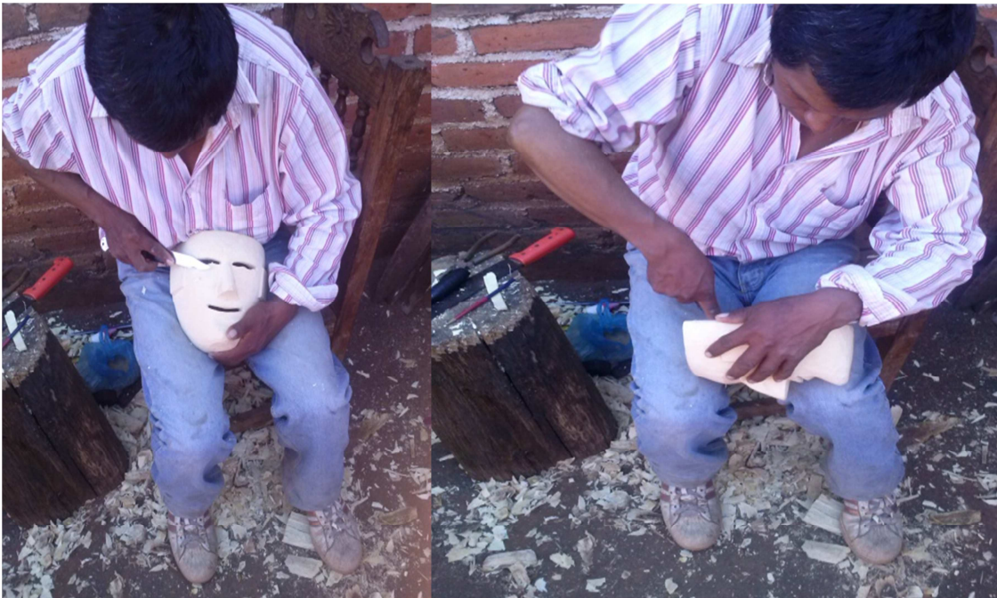
(Se observa el trabajo casi terminado)