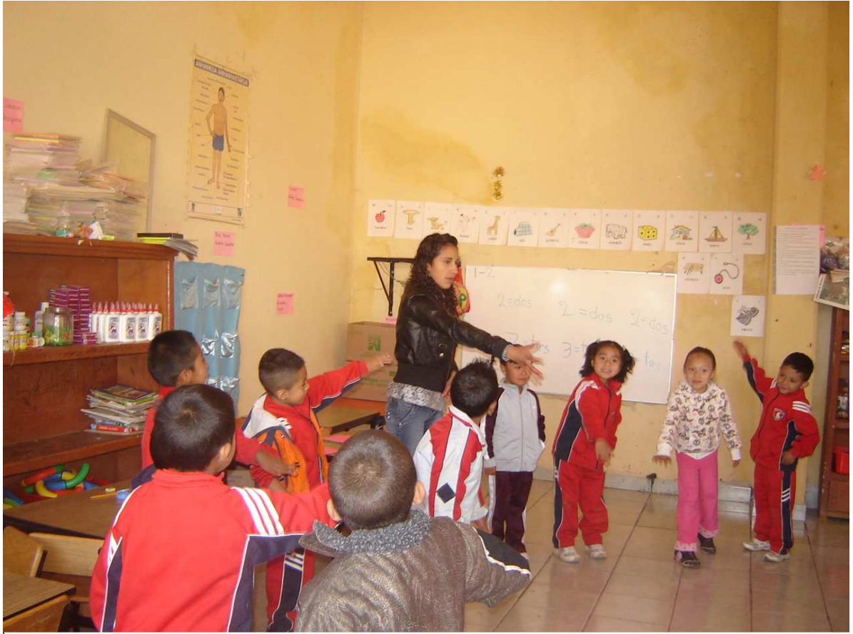
Juego: Hopy, Hopy.