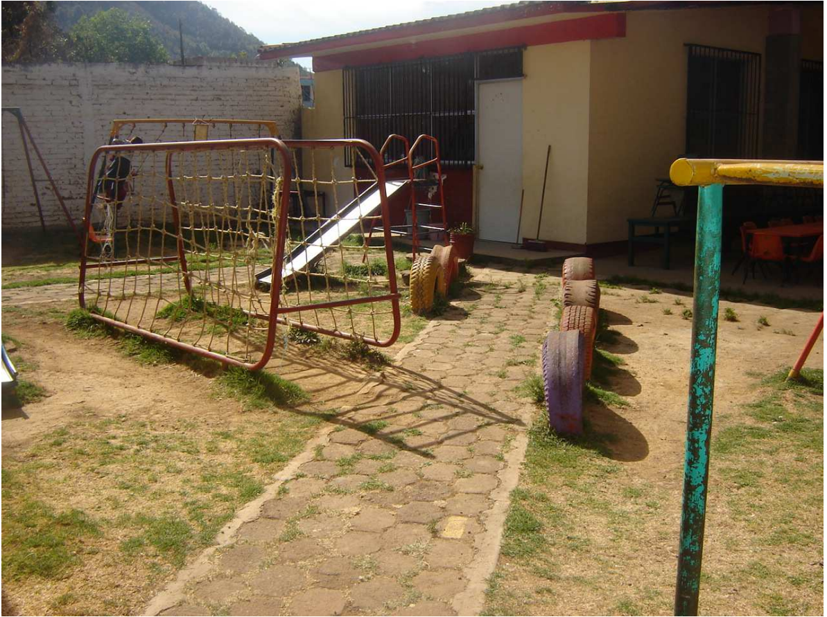
Área de juego del Jardín de niños Fray Bartolomé de las Casas.