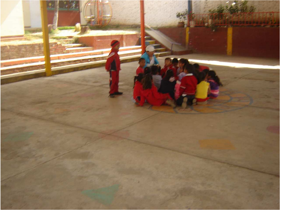
Alumnos del tercer grado, grupo "B", escuchando la narración del cuento infantil denominado: En un país lejano vivía un gran dragón.