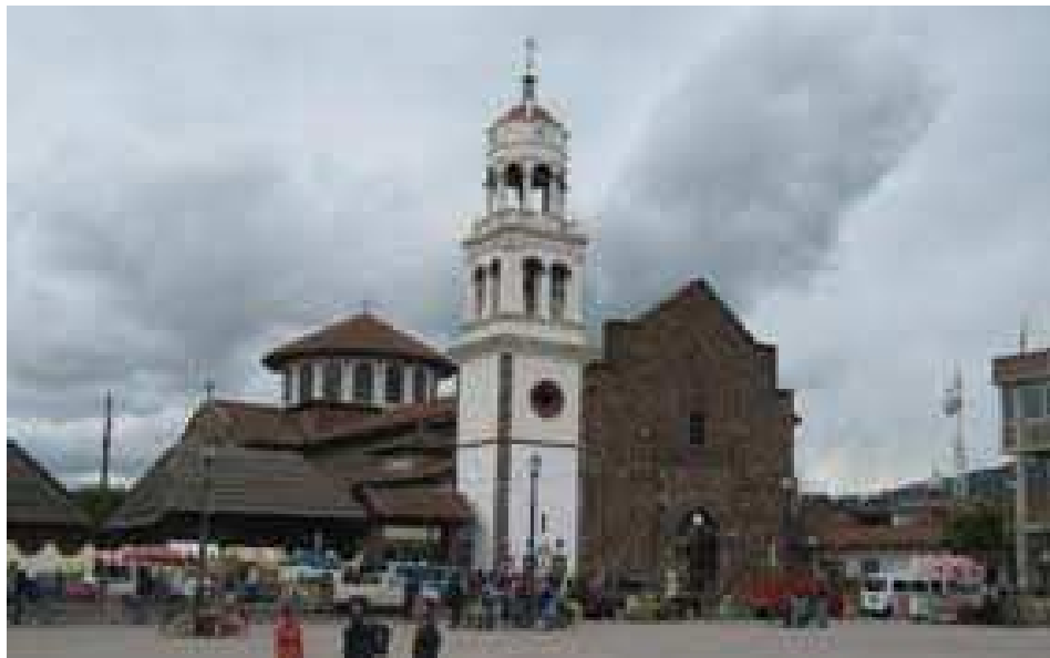
Plaza central de la comunidad de Cherán Mich.