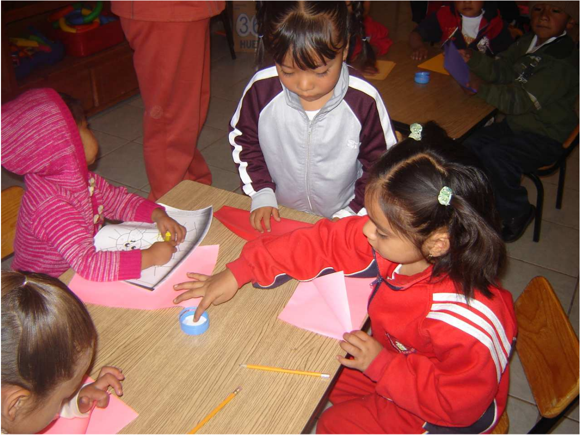
Los niños se encuentran realizando un sobre para la actividad: juguemos a construir notificaciones o cartas.