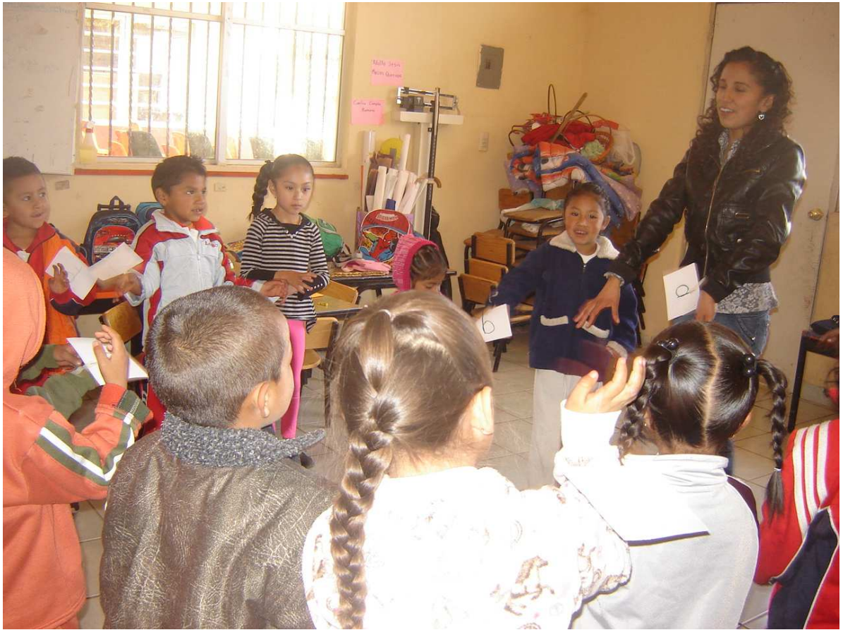
Juego del Hopy,Hopy, con las letras b,d,p y q.