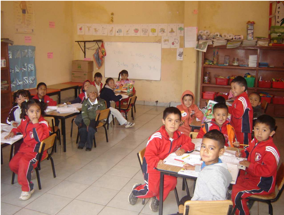
Presentación de los alumnos del tercer grado, grupo "B".