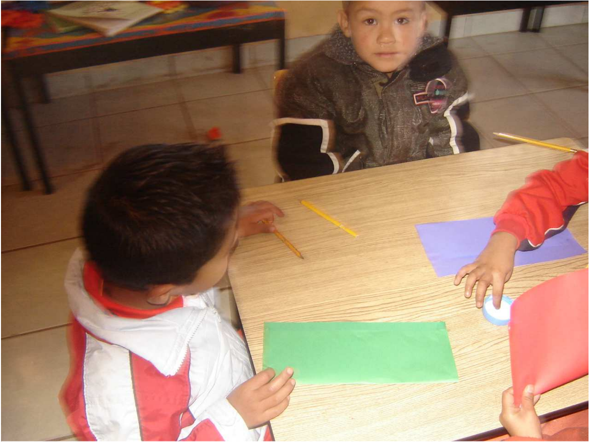
Los niños elaborando su sobre para las cartas.