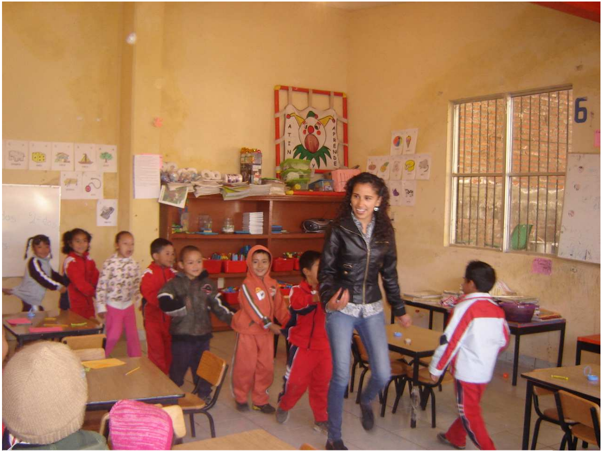
Juego: En un país lejano vivía un gran dragón.