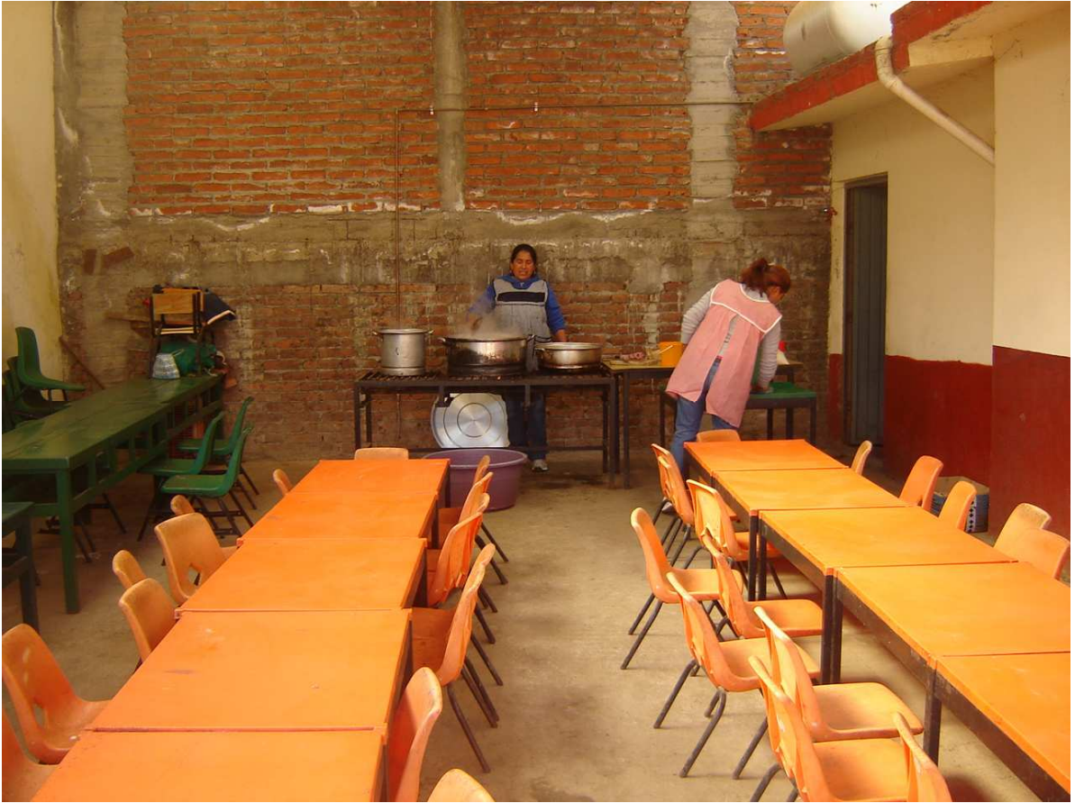
Área del comedor del Jardín de niños Fray Bartolomé de las Casas.