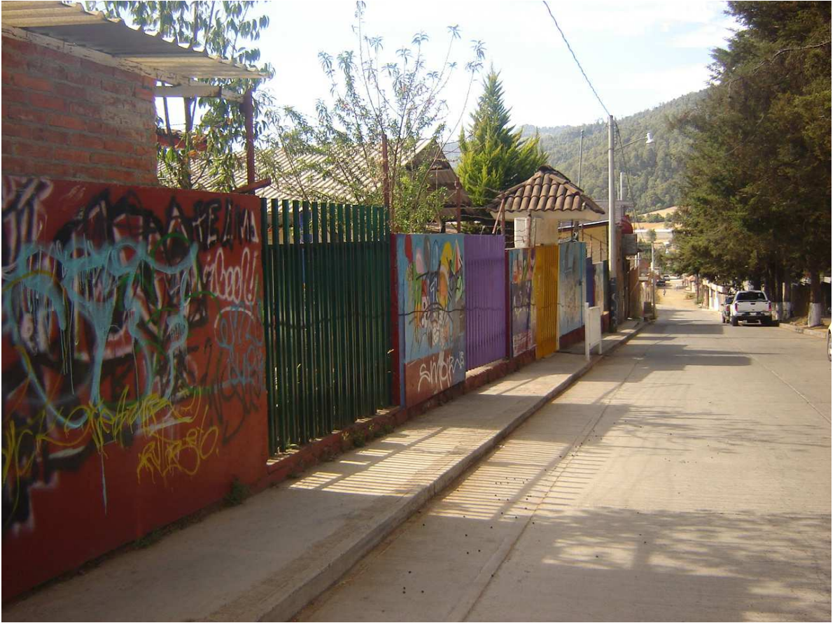
Preescolar Fray Bartolomé de las Casas