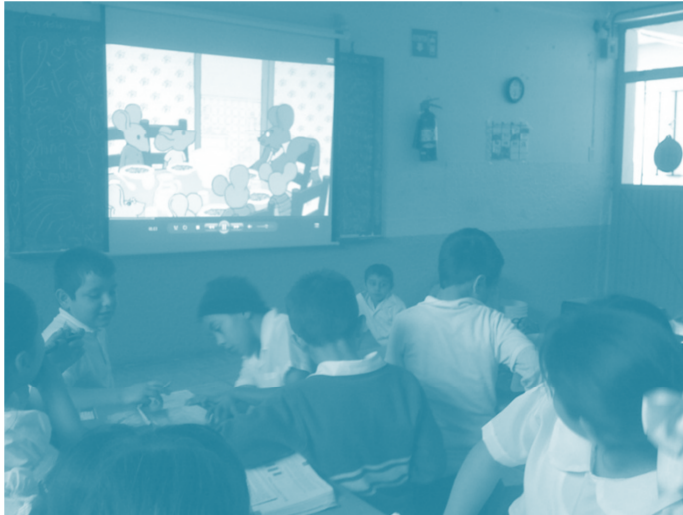
Imagen de arriba estan viendo el cuento. Imagen inferior en el clímax del cuento