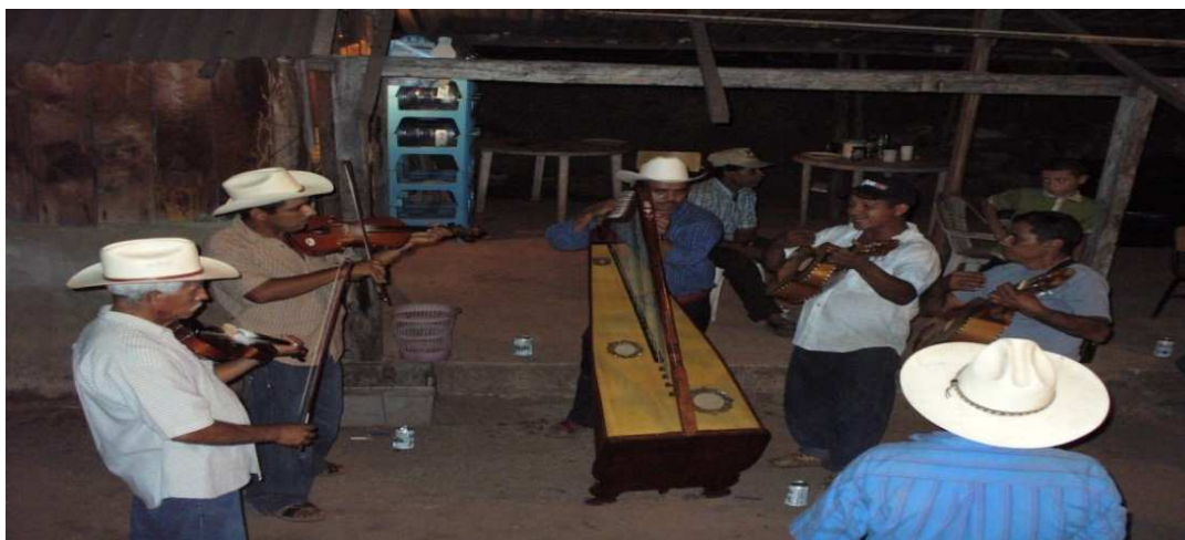
Música tradicional, que se utiliza durante las festividades y las danzas para el Santo del pueblo.

El grupo de arpa en ocasiones se visten con uniforme y en la gran mayoría de las veces cada quien se viste como puede, pero tratan de ponerse sus mejores ropas para dar su mejor presentación.