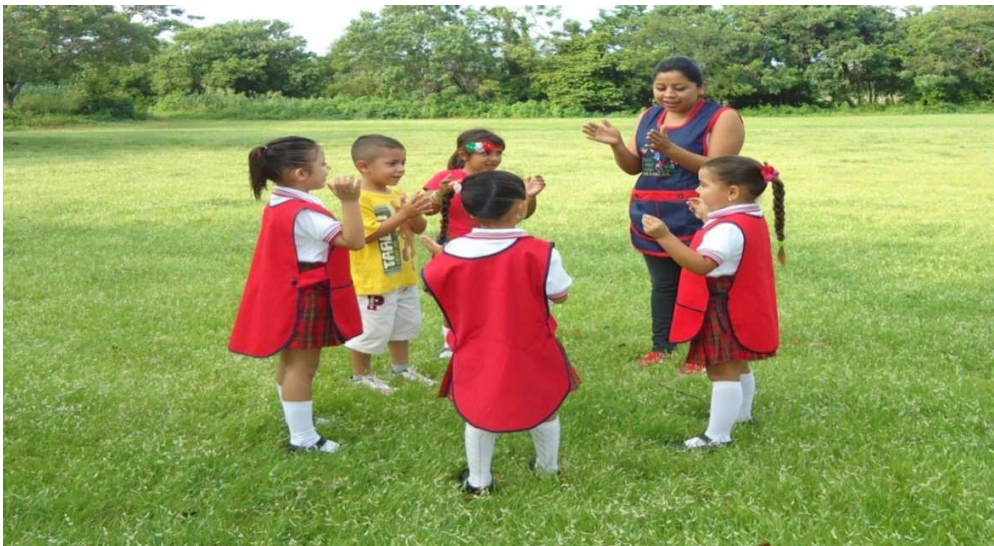
Juagando "caricaturas de amigos"