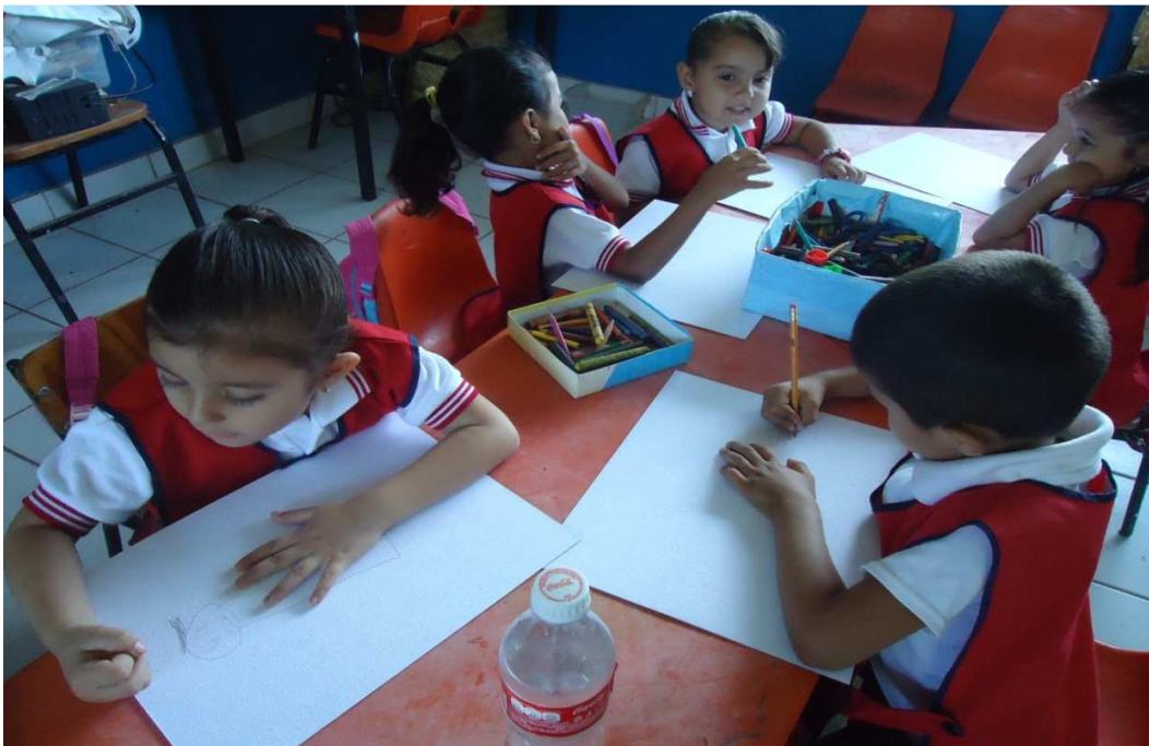
Los niños exponiendo “dibujemos a nuestros compañeros”