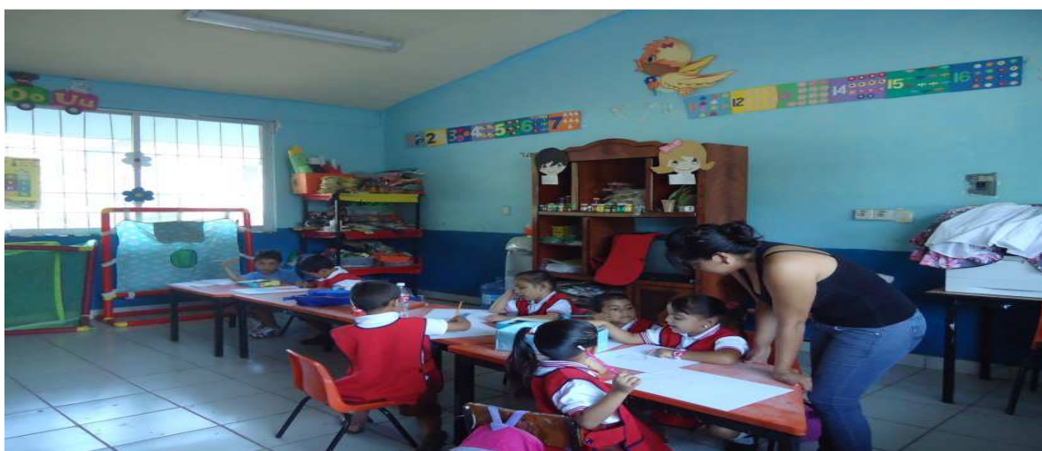
“Dibujemos a nuestros compañeros”