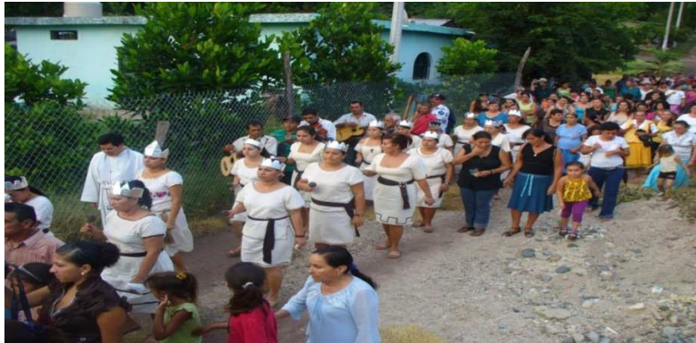
Danzantes, en procesión por las calles de Huahua, el 4 de Octubre.

La Caminata, La Culebra, El Retache, El Chiquilín Panzón, La Conquista, La Petenera, El Mono de Alambre, La Marcelina, La Llegada, La Borracha, El Tamalito, La Cuchilla, El Columpio, El Paso de Pollo, La Mangana, La Guerra, Paloteo, Danza de la Virgen, La Perica, Los Enanos, El Minuetón y muchos Minuetes sin nombres.