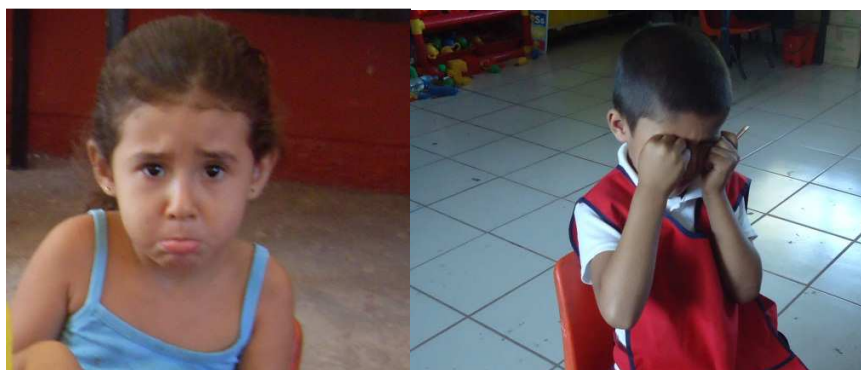
Niños en momentos que muestran enojo y agresión

Se utilizarán estrategias distintas por ejemplo: dinámicas, de juegos, cantos, para que vayan construyendo y reflexionando, dónde los niños se van a empezar a involucrar y analizar el valor que tiene no agredirse ni pelear con los demás.