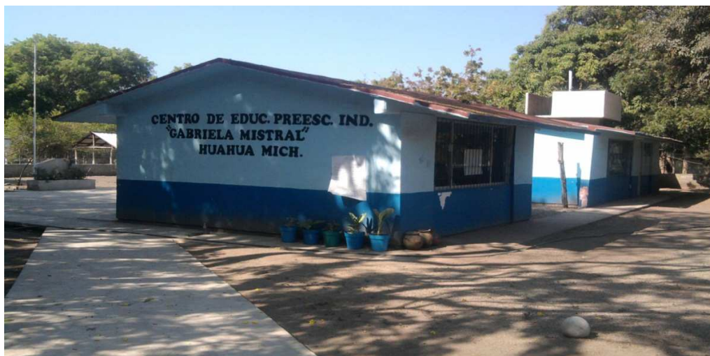
La escuela donde se llevó a cabo esta propuesta

El trabajo de propuesta pedagógica se lleva a cabo en el centro de educación preescolar “Gabriela Mistral”, con clave 16DCC0077G, ubicado en la localidad de Huahua, zona Escolar Núm. 103, y al sector 01; mismo que está conformado por 2 docentes, una de estas docentes con cargo de directora al igual como maestra frente a grupo, y una intendente de carácter municipal. Actualmente el centro cuenta con una población estudiantil, de 34 alumnos, de una edad aproximada de 3 a 6 años en el turno matutino, ubicada en la parte sureste.