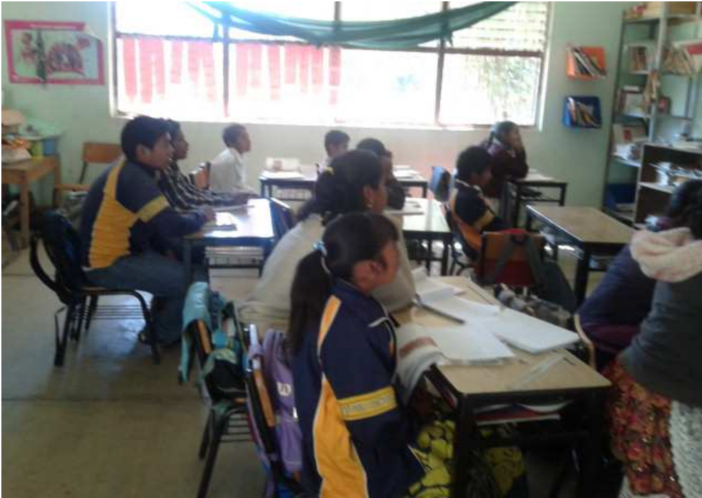
Los alumnos escuchan con atención las indicaciones de la estrategia 2