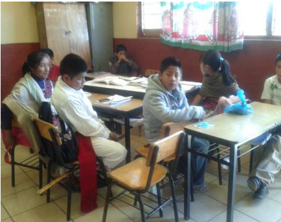
Trabajo en equipo estrategia 2