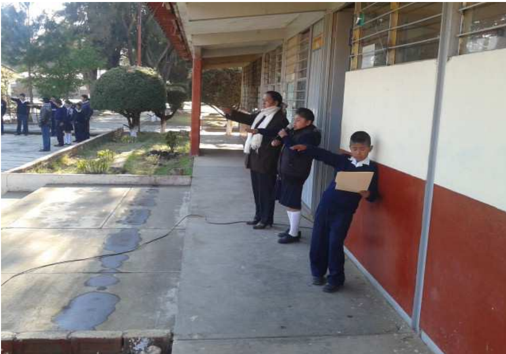
Alumna realiza el juramento a la bandera estrategia 5