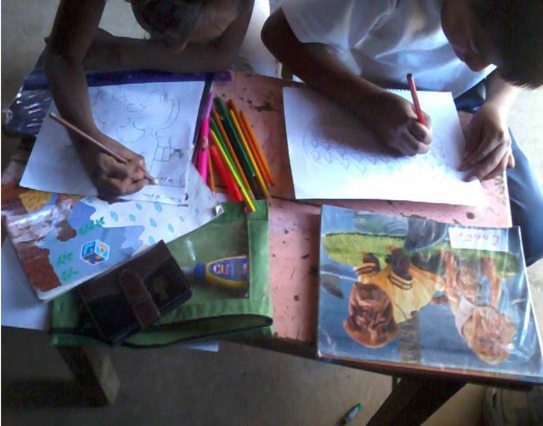
Dibujan lo que entendieron de acuerdo a la estrategia 4