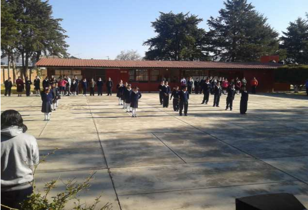
El grupo participa en el acto cívico de manera segura estrategia 5