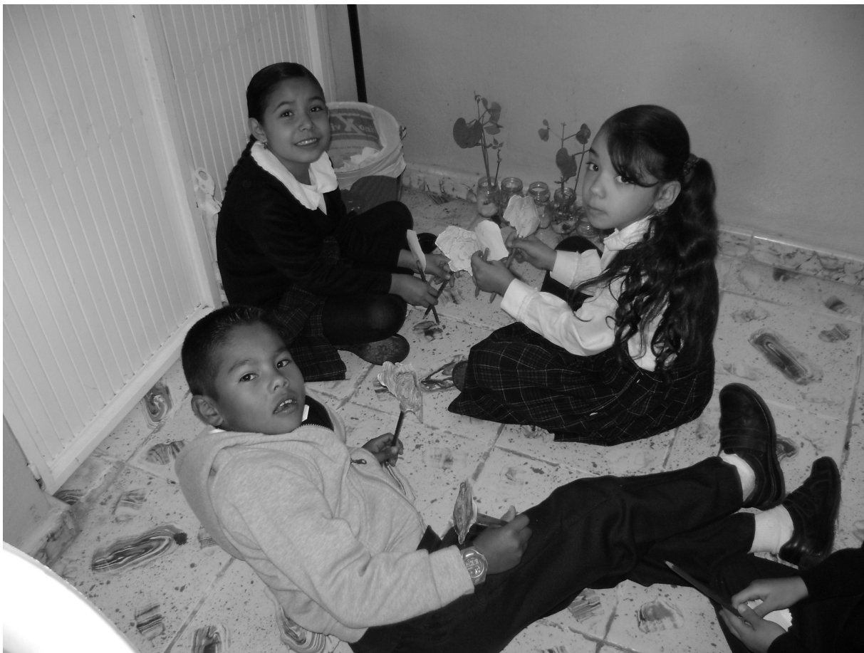
Fotografía 2. Los niños jugando libremente con su títere.