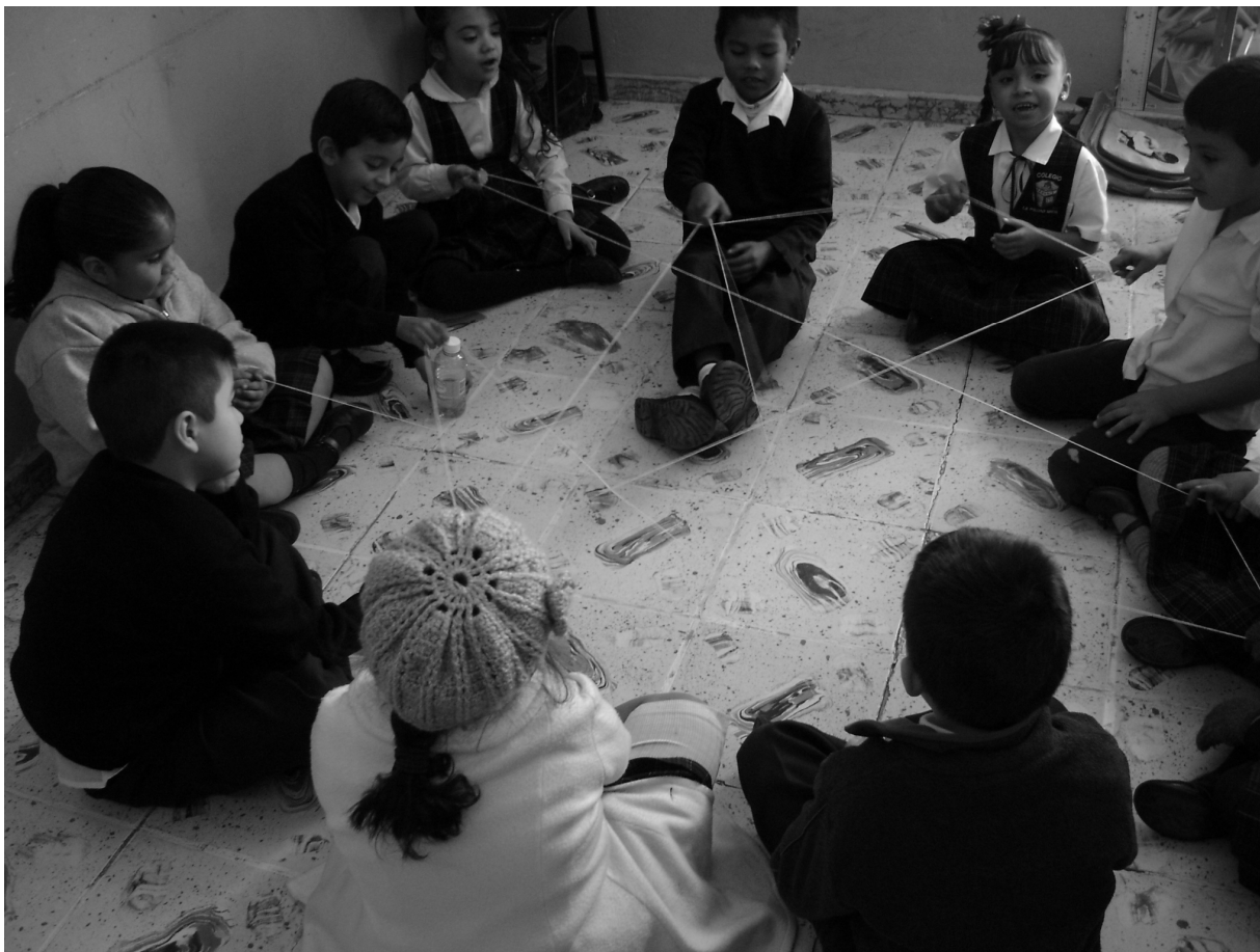
Fotografía 3. Los niños formando una telaraña y contando lo que los hace sentir felices y lo que los pone tristes.