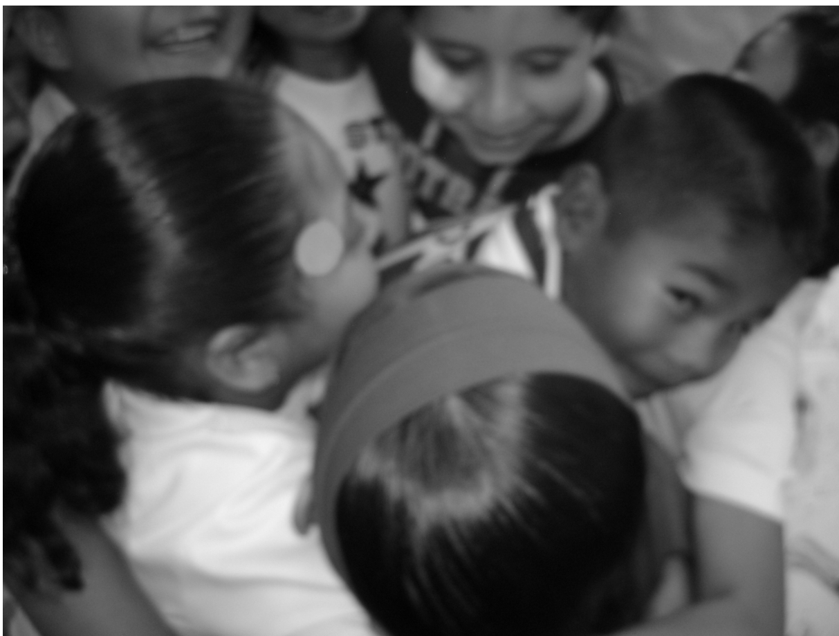
Fotografía 4. Los niños y niñas abrazándose como parte de la actividad 11.