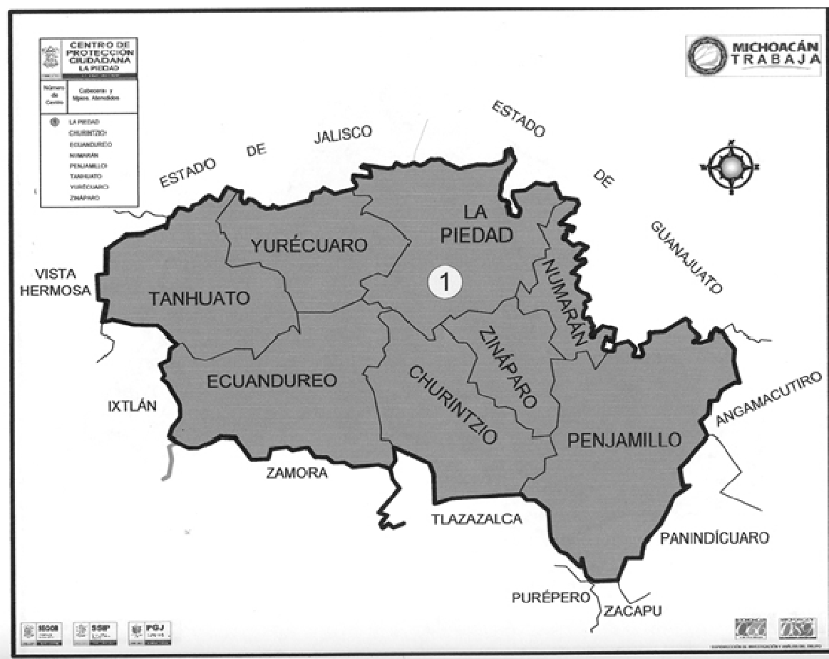
Mapa 1. Ubicación geográfica de La Piedad, y los Municipios que colindan con ella.