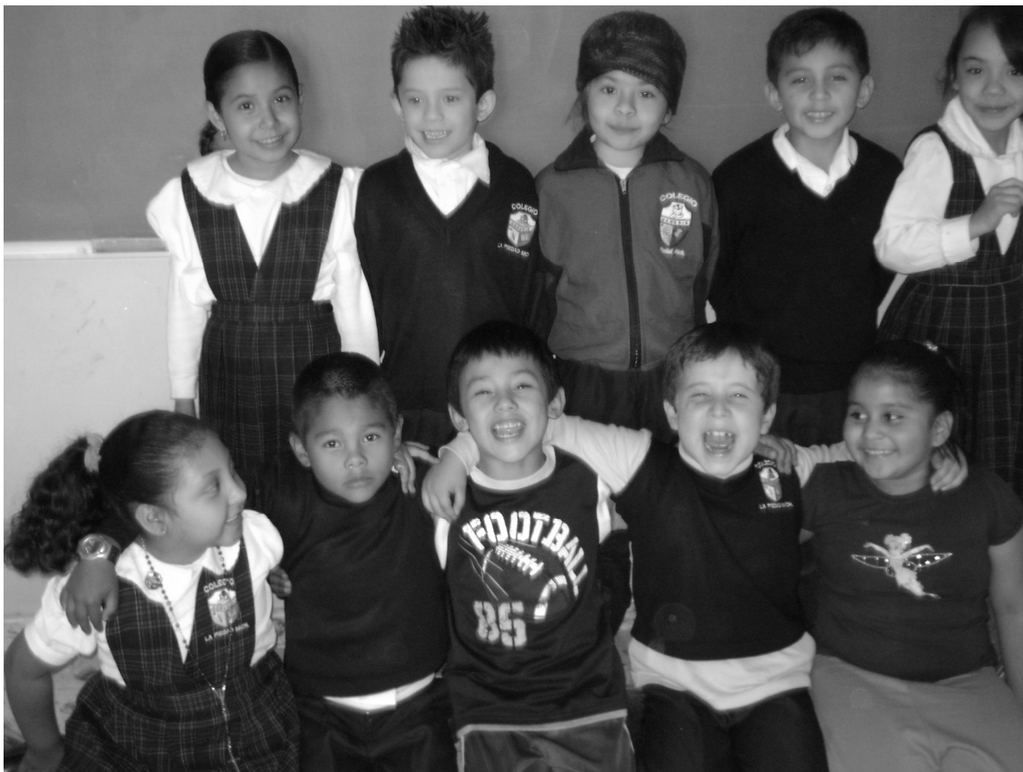
Fotografía 1. El grupo Portafolio de evidencias 2011