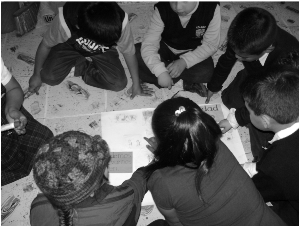
Fotografía 5. Los niños y las niñas elaborando un cartel alusivo a la equidad de género.