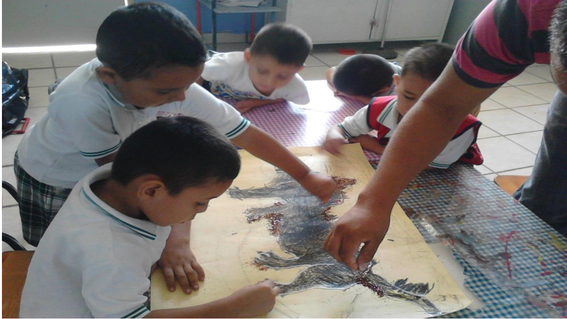
Madres de familia colaborando para hacer el periódico mural. Anexo 10