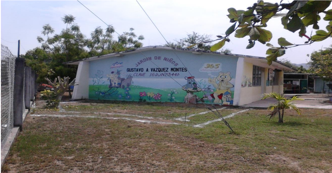
Aulas de trabajo del jardín de niños. Anexo 2