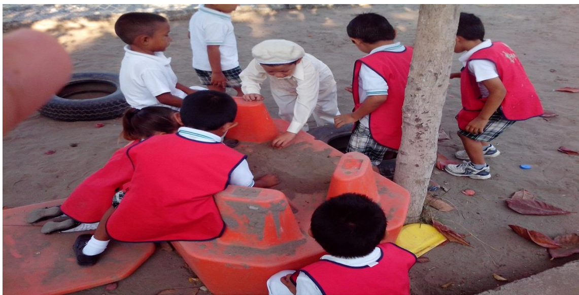
Trabajando matemáticas con el tema de los animales. Anexo 8