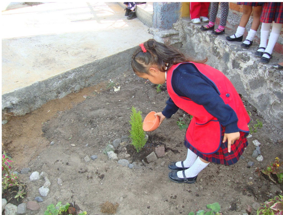
Anexo (27). Los cuidados que le dan al Jardín de Flores los pequeños.