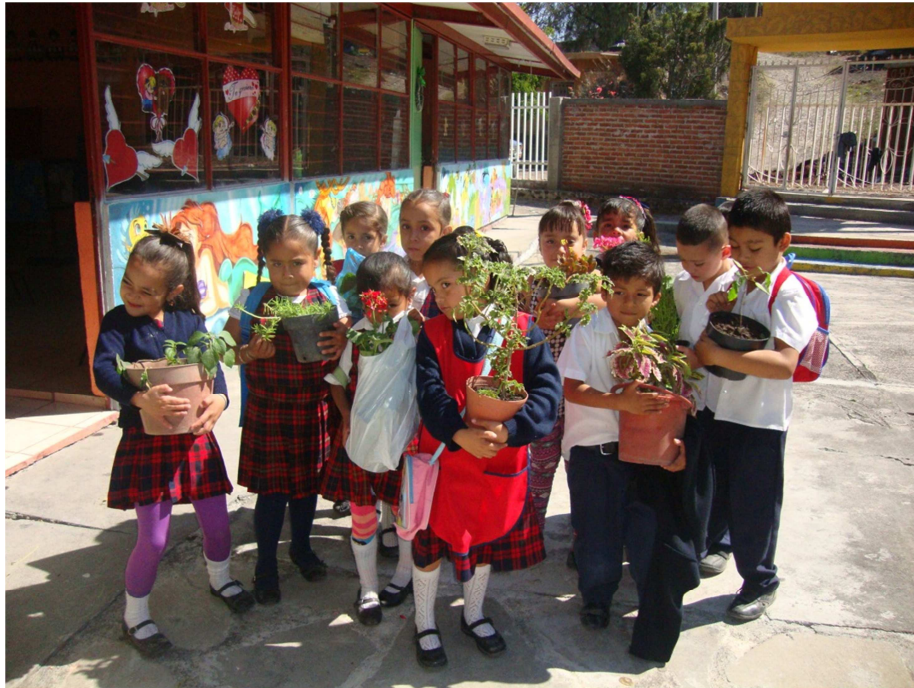
Anexo (25). Asistencia de las cuatro mamás que nos apoyaron para escarbar la tierra para la realización del Jardín de Flores .