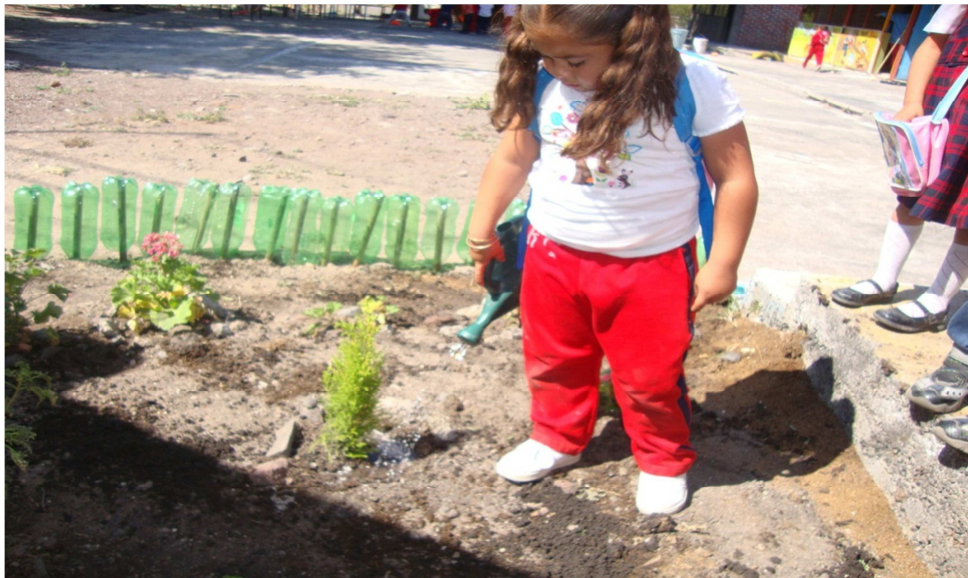
Anexo (17). Foto donde se puede observar que los niños se preocupan por preservar su Jardín.