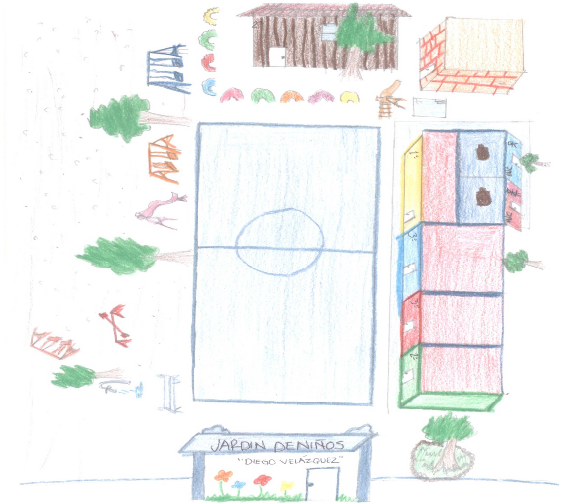
Anexo (4). Institución Preescolar. "Diego Velázquez".