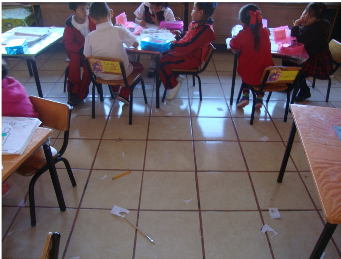
Anexo (12). Foto de detección de la problemática.