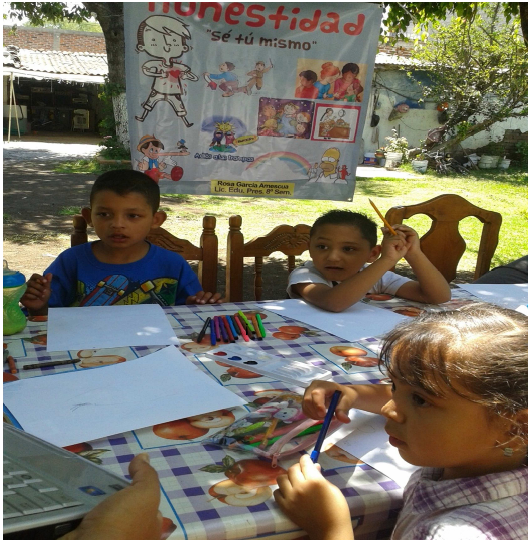
TRABAJANDO EL CUENTO "UNA CONDUCTA HONESTA"