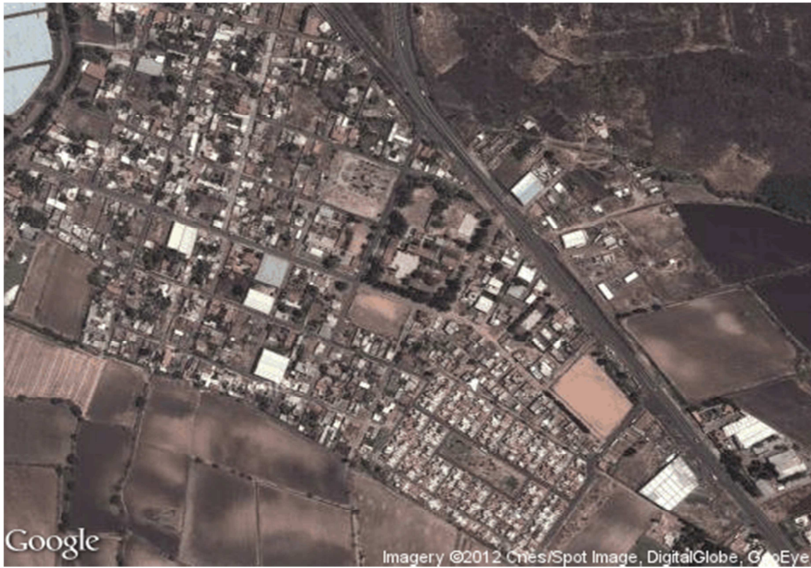
PANORÁMICA DE CHAPARACO