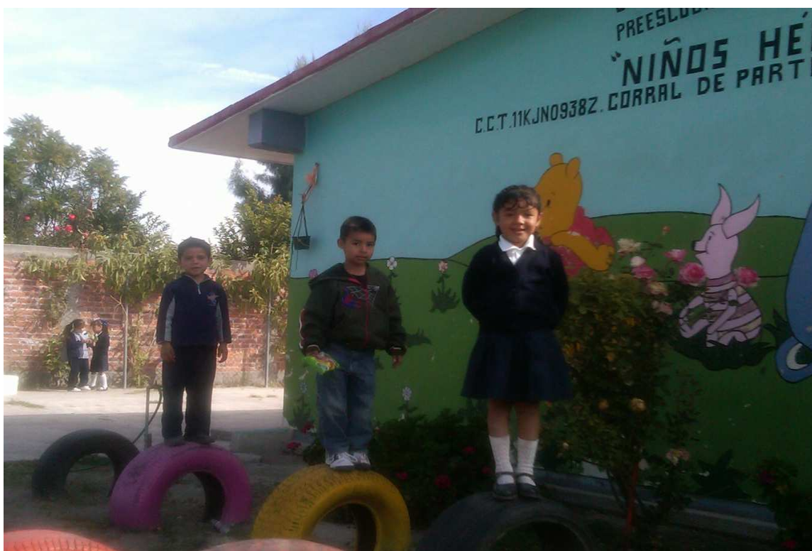
Anexo11: Aplicación de la actividad “Taller de cuento”