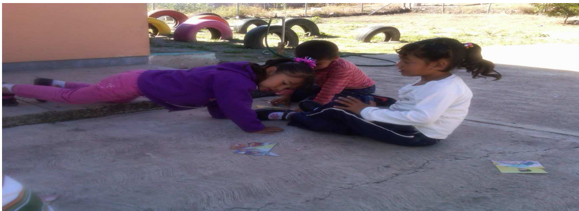
Anexo 9: Aplicación de la actividad “Me comunico sin hablar”