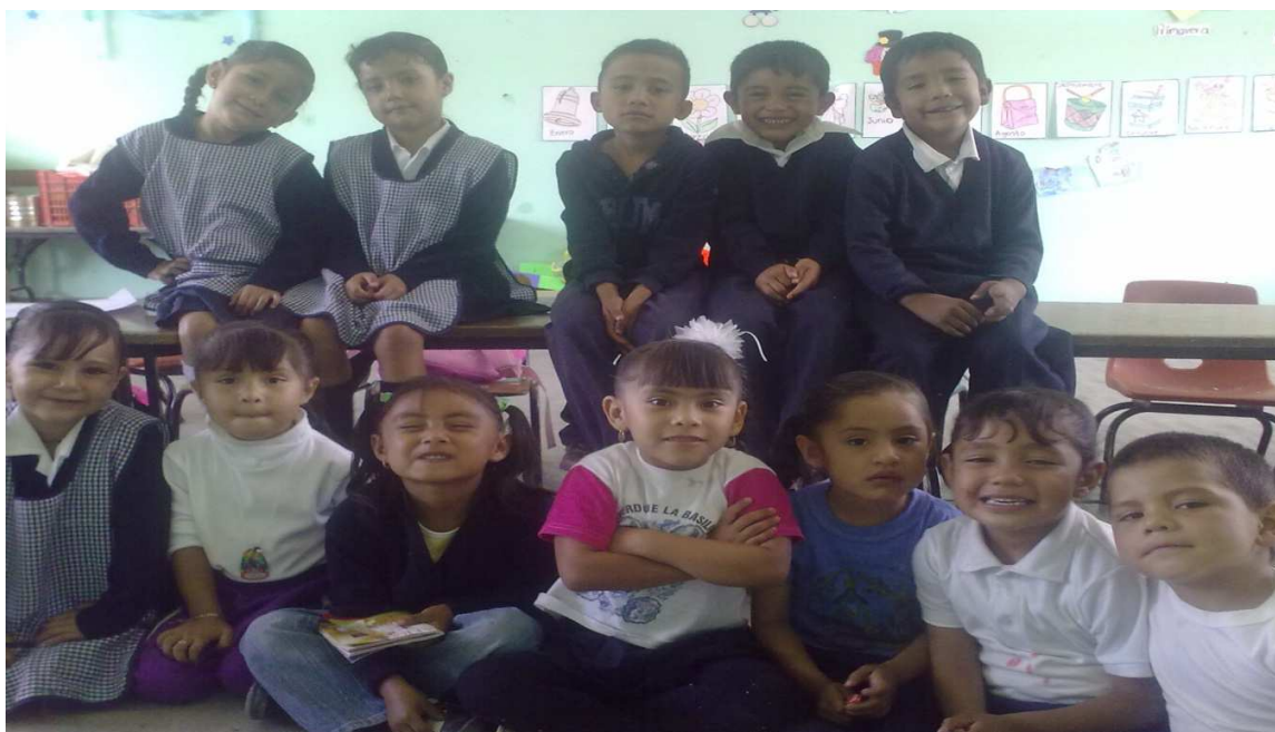
Anexo 7: Aplicación de la actividad “Me lo cambias”