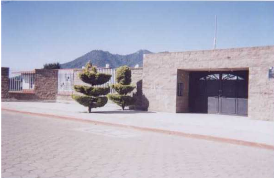
Fotografía 1. Se observa la entrada principal de la Escuela Emiliano Zapata