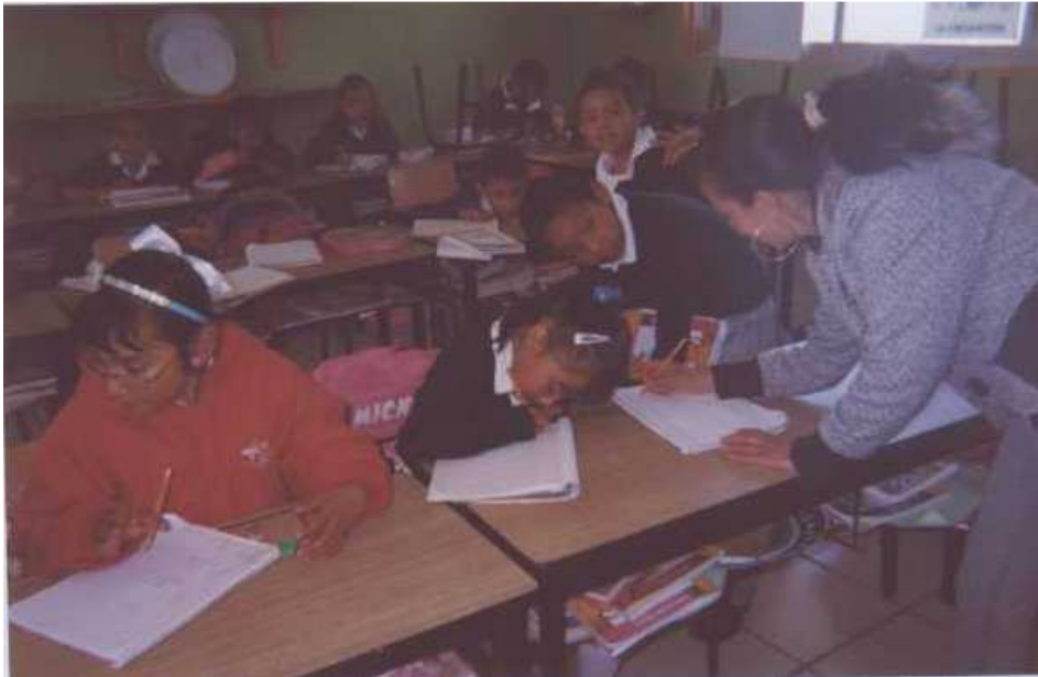
Fotografía 7. Observamos la descripción de personajes en su cuaderno