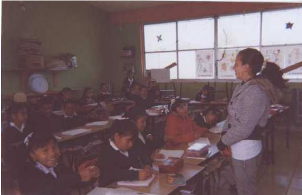
Fotografía 3. Se observa el grupo de 3 Grado Grupo "A" de la Escuela Emiliano Zapata.