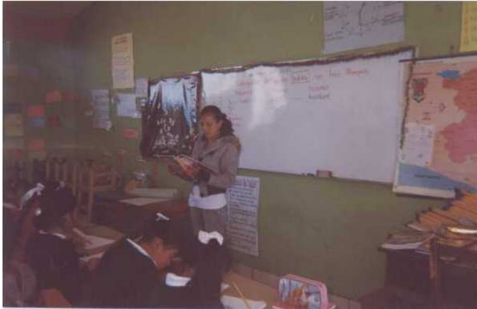
Fotografía 5. Se observa la narración de cuentos y lecturas.