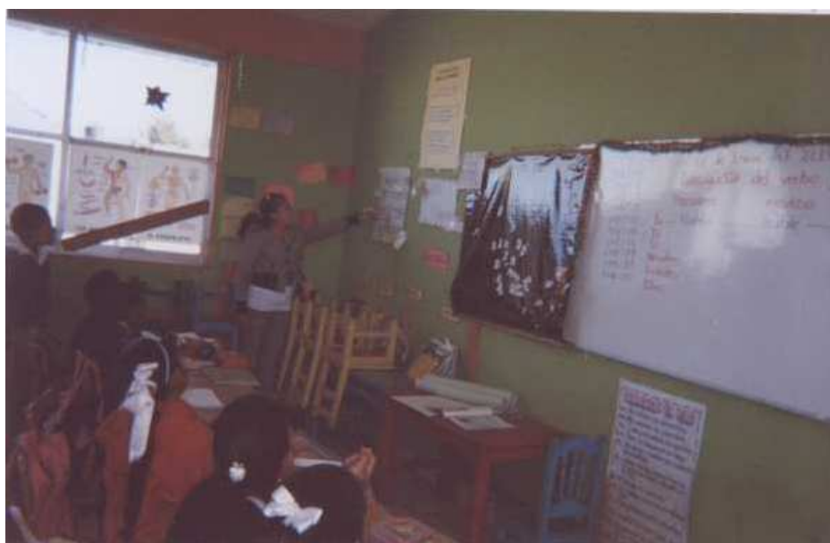
Fotografía 10. Descripción de escenarios de cuentos.