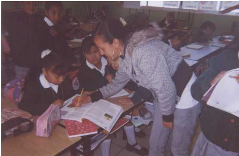
Fotografía 8. Observamos la actividad en parejas para leer y analizar un cuento.