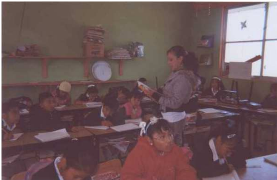
Fotografía 6. Narración de un cuento con modificaciones intencionales.