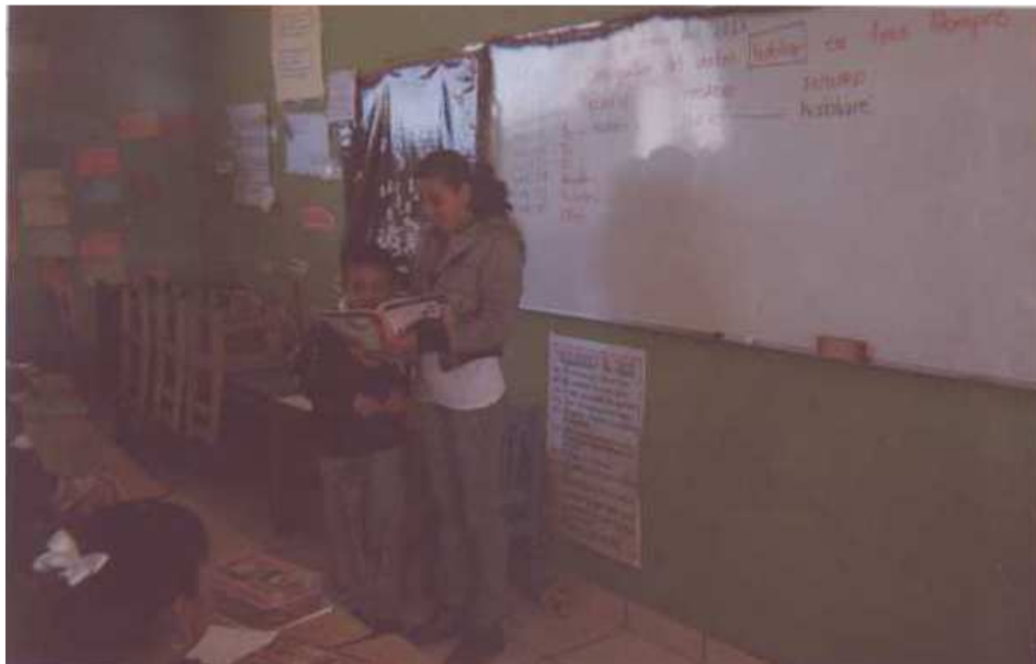
Fotografía 4. Se observa la actividad de la lectura en voz alta.