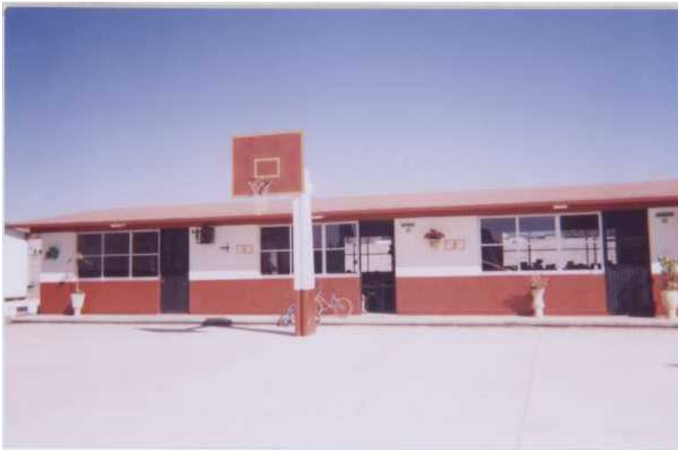
Fotografía 2. En la segunda fotografía se observa la cancha de básquet bol.