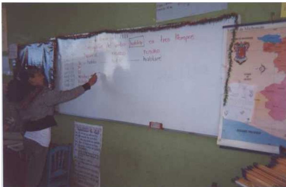
Fotografía 9. Se observa la identificación de adjetivos y adverbios.