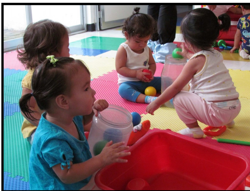
Foto 4. Niños de Lactante 3 del CENDI No.3 Armería. Realización de acciones de correlación. Introducir objetos. 2013

a). En Educación Inicial._ Se considera el proceso de desarrollo y transformación de las capacidades de los niños y las niñas, del nacimiento a los tres años de edad, donde se proporcionan oportunidades de aprendizajes, que permitan fortalecer los niveles de desarrollo alcanzados en su evolución, pero además llevarlos a que construyan capacidades para mejorar sus condiciones de vida y sentar las bases para un enriquecimiento de su vida personal, familiar, escolar y social, dentro de un ambiente estimulante, de confianza e interés, asimismo se cultiva la exploración, se fomenta la autonomía, se protege la salud emocional y se cuida el desarrollo integral de los infantes.