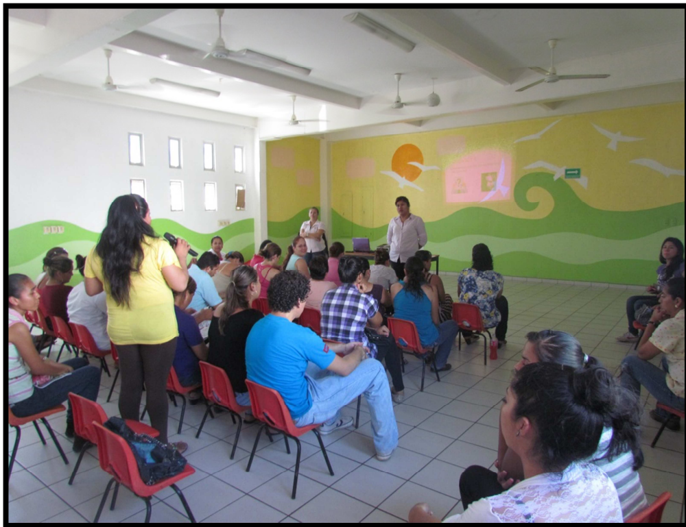
Fotografía 3. Taller “Aprendiendo a ser Mejores Padres”, 2014

También se realizan talleres mensuales con el nombre “Aprendiendo a Ser Mejores Padres”, estas con la finalidad de hacer más conscientes a los padres de familia de las responsabilidades que tienen para con sus hijos, dándoles temas en los cuales ellos puedan ponerlos en práctica. Algunos de los temas de los talleres impartidos son: “Educa No Lastimes”, “Salud Bucal”, “Apoyo de Tareas en Casa” y “Enfermedades de Vías Respiratorias”