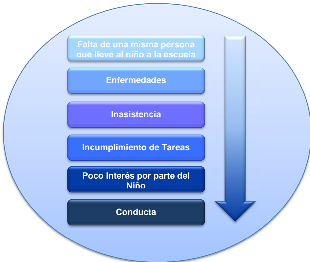
Gráfico 1. Jerarquización de situaciones o dificultades presentadas en el grupo de Preescolar 1 que afectan el desarrollo de la Motricidad Fina

Uno de los principales problemas es la falta de una misma persona que lleve y recoja al niño a la escuela , esto conlleva a la desinformación por parte de los padres de familia hacia la educadora acerca del estado emocional del niño.