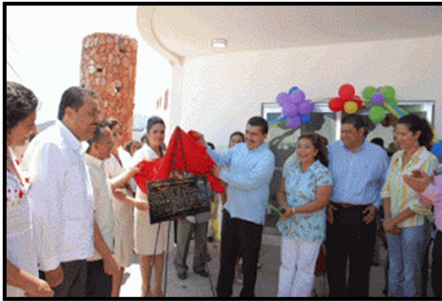
Fotografía 1. Inauguración de los CENTRO DE DESARROLLO INFANTIL "Tierra y Libertad" No.3, 2008

lactante 1, lactante 2, lactante 3, maternal 1, maternal 2, maternal 3, cocina, comedor, baños para maternas, auditorio, biblioteca, cuarto de circuito cerrado, alberca, patio de preescolares, patio de maternas, oficinas administrativas y recepción (filtro) (ver anexo Fotografía 1 y 2).