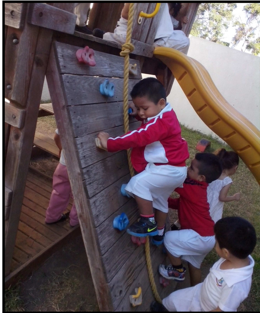
Foto 5. Niños de Preescolar 1 del CENDI No.3 Armería. Juego Libre. 2014

analíticos, alegres y felices, en un ambiente armónico, seguro, proyectado a su desempeño personal y social.