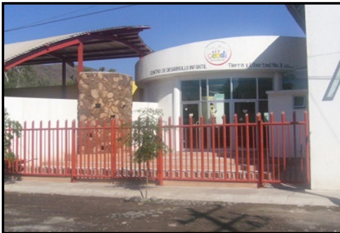
Fotografía 2. Fachada del CENTRO DE DESARROLLO INFANTIL "Tierra y Libertad" No.3, 2008

Como docente de esta institución es importante saber los orígenes de esta, pues es donde me desempeño y aplico mis conocimientos adquiridos, además de contribuir con la educación de los niños de Armería no solo en cuestiones pedagógicas sino culturales, sociales y de valores.