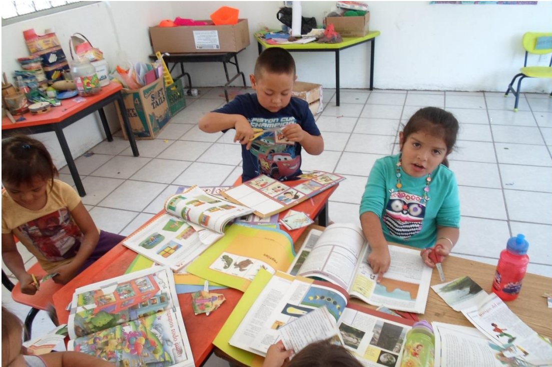
Investigando y recortando a los profesionales del pueblo y mi comunidad