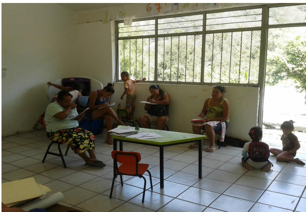
En la dramatización imitando ser alumnos