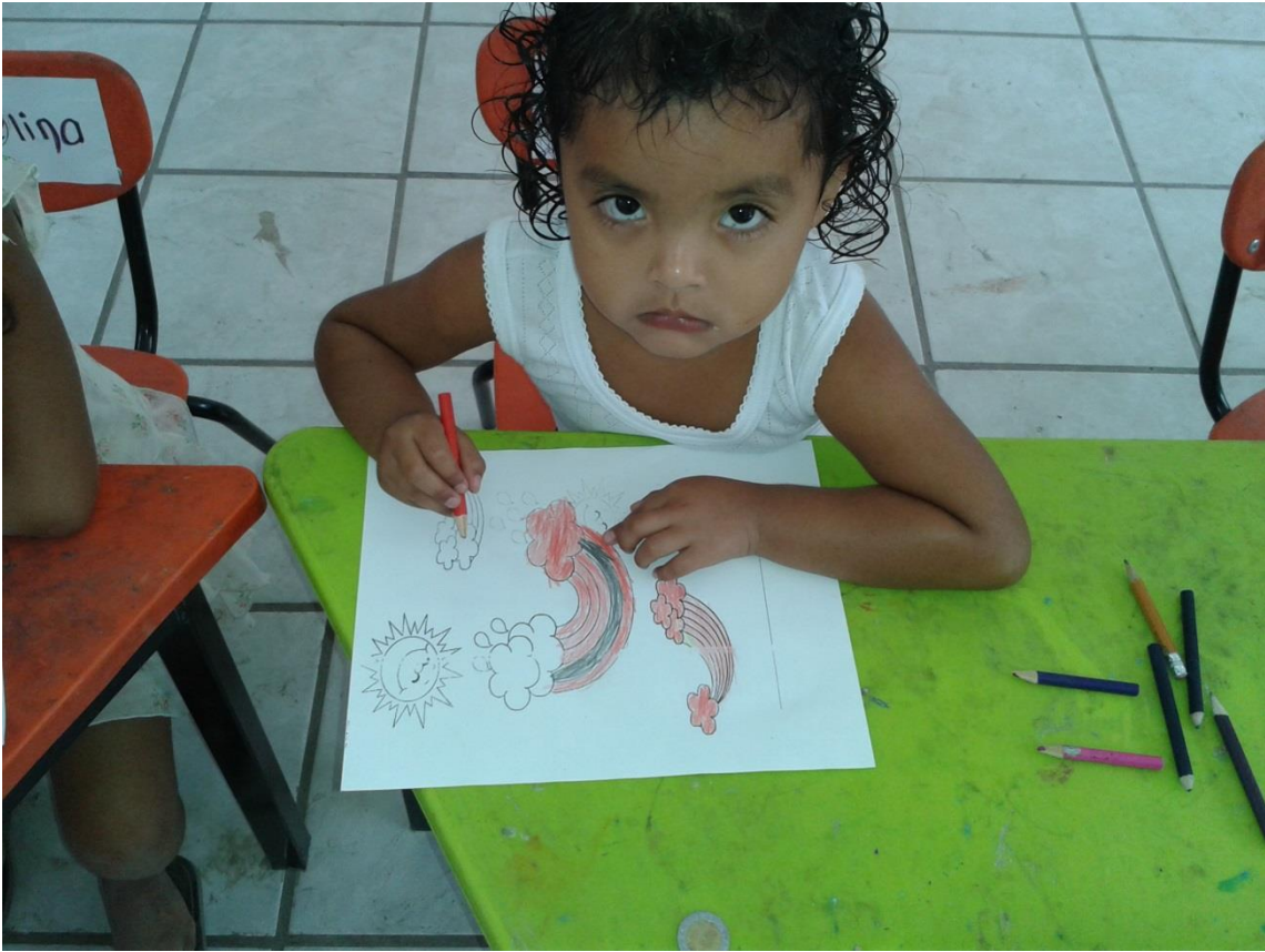
Realizando el conteo en el arcoíris uno a uno