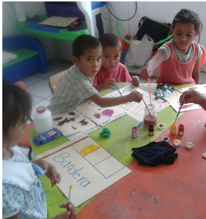
Trabajo en equipo y utilizando el material de su agrado para su obra de arte