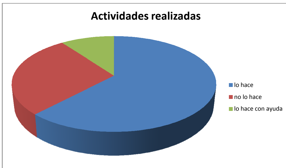
Gráfica 1: En esta gráfica vemos que poco más de la mitad de los alumnos logra realizar las competencias y obtener los aprendizajes esperados.

mucho para que las estrategias me dieran resultados positivos. Después de varias semanas de trabajo el ambiente en el aula fue mejorando.