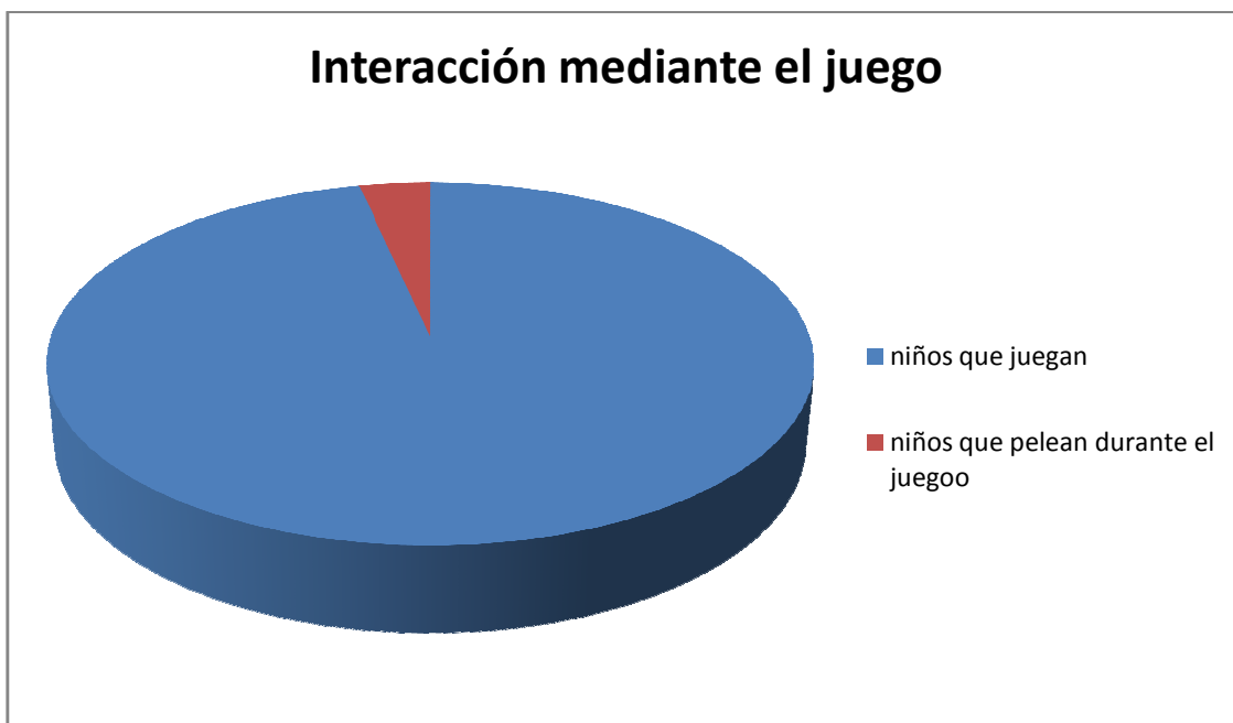
Gráfica 3: en esta gráfica vemos que conforme fueron realizando las estrategias disminuyó un gran porcentaje en los niños que pelean durante el juego