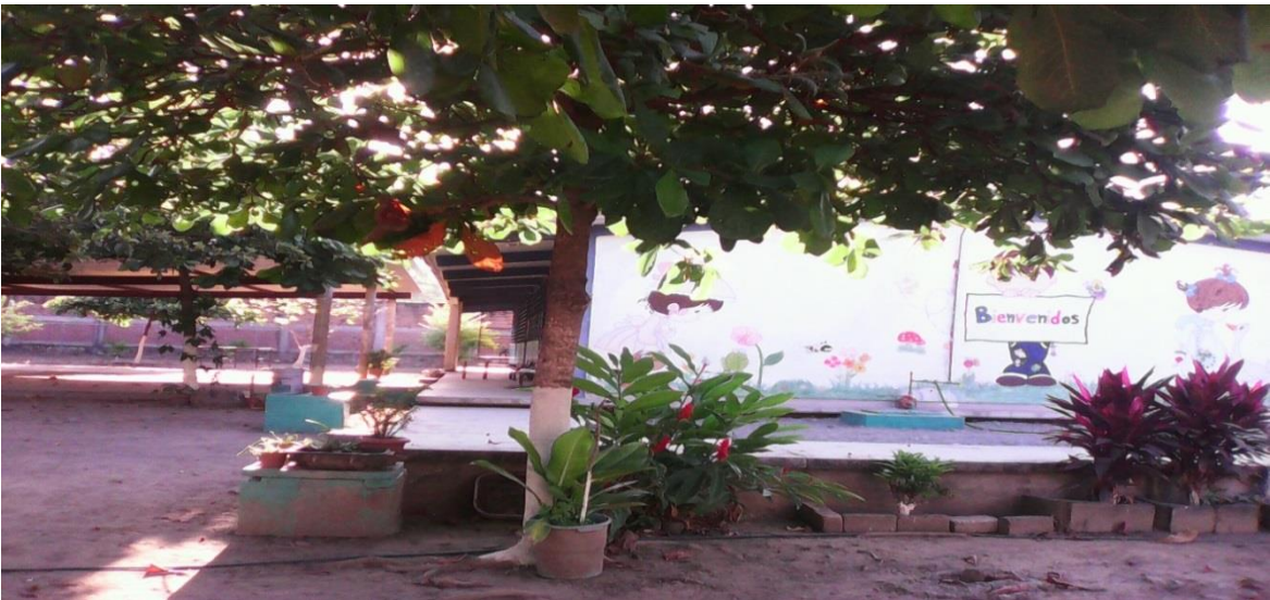
Fotografías tomadas de diferentes puntos del jardín de niños Manuel Gómez Pedraza.