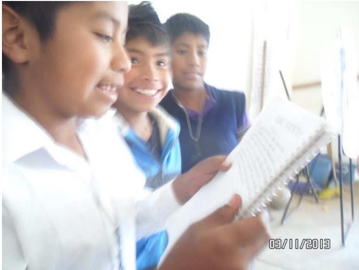
Foto: III los niños comentan ante el grupo lo que escribieron.