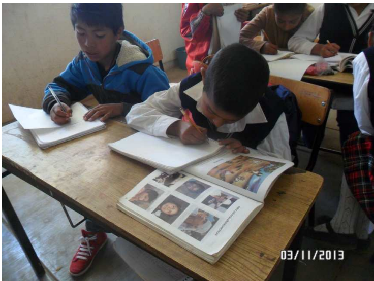
Foto VI: A través de imagen o dibujos desarrollan la lecto escritura en P´urhépecha.