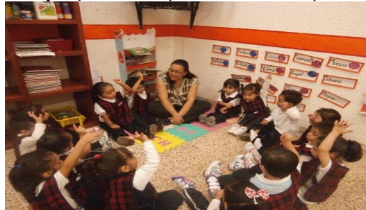
Foto 24.”Dando ejemplo de cumplimiento e incumplimiento de reglas”

Nos sentaremos en círculo y les expliqué brevemente en forma clara y sencilla la necesidad de las reglas y los límites para regular la vida de las personas (véase foto 24)”Dando ejemplos de cumplimiento e incumplimiento de reglas” y de los grupos, les pedí a los niños que ellos también aporten ejemplos del cumplimiento e incumplimiento de las reglas o normas, les di un ejemplo de las normas que yo seguía cuando era niña y si no se seguían cuál era su consecuencia.