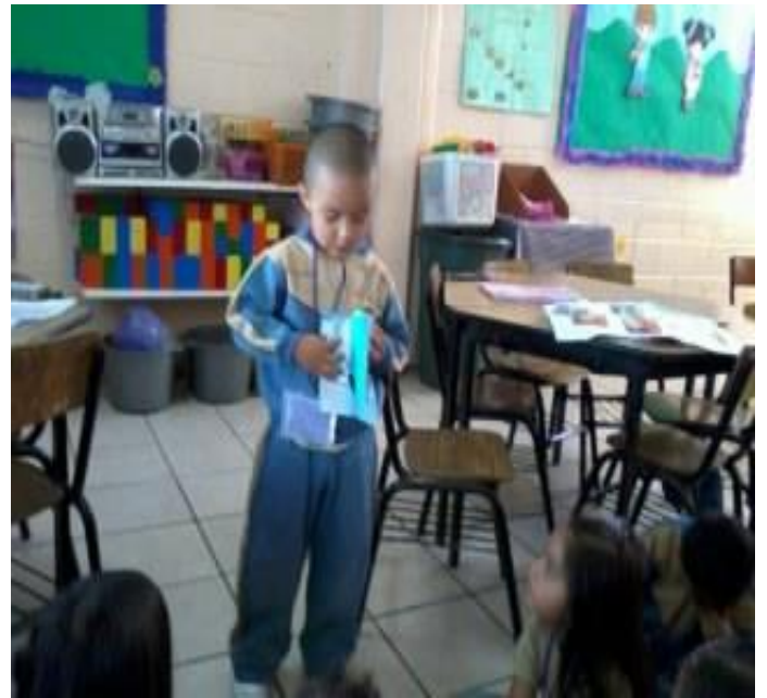
La explicación de normas de convivencia frente a sus compañeros.