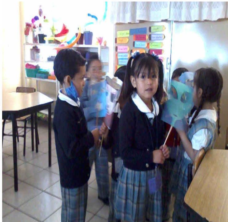
Actividad ¿Quién soy ahora?