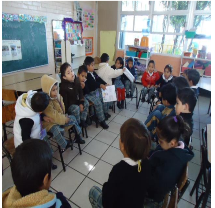
Las conversaciones en grupo un reto para convivir y conocer más de los otros.