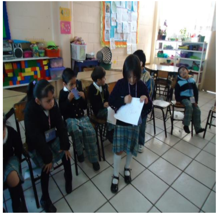
Las exposiciones en colectivo hicieron evidente mayor seguridad en sí mismos.