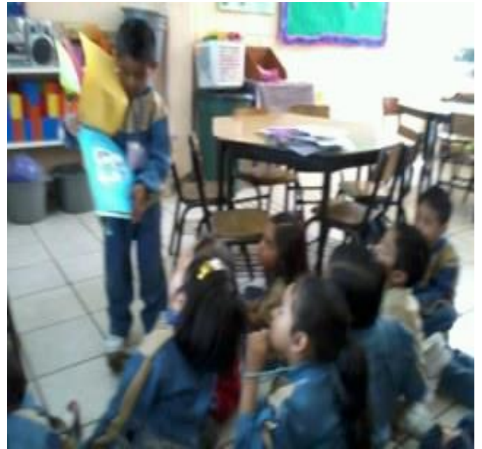
Actividad ¿Qué hacer cuando...?