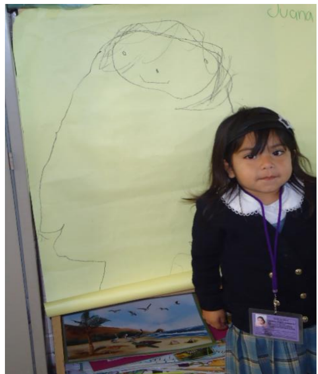
Las niñas y niños explicando sus experiencias en las actividades realizadas.