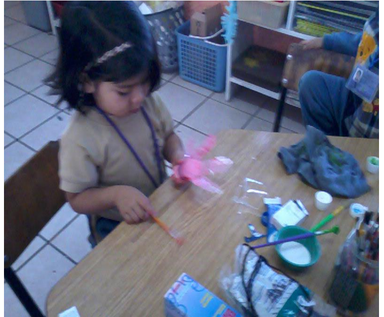
Preparando un pequeño pero significativo regalo para los mejores amigos.