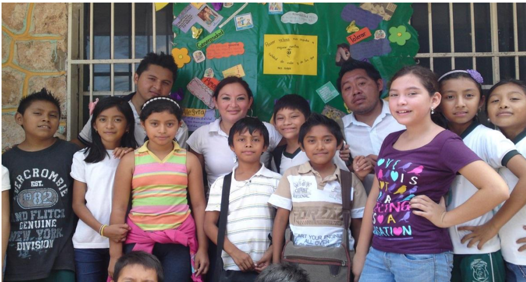
Figura 10: Plática con los padres de familia