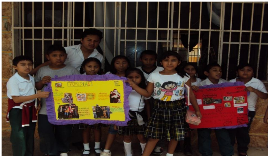
Figura 6: Producto final de la actividad “Lo carteles”