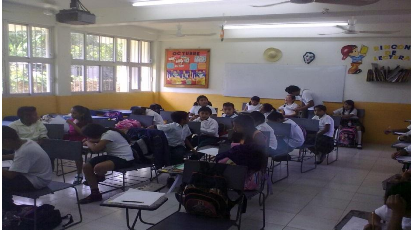
Figura 1: Aplicación de las entrevistas a los alumnos