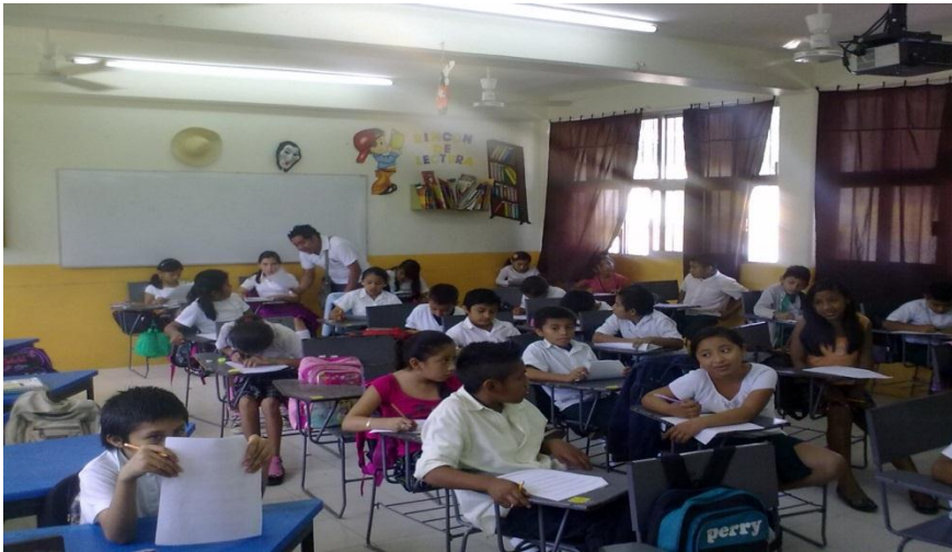
Figura 2: Los alumnos contestaban y eran asesorados por los interventores