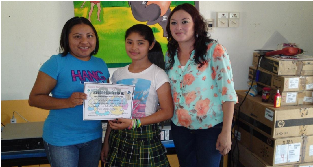
Figura 12: Entrega de reconocimientos a los maestros por su satisfactoria participación.