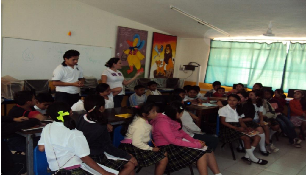
Figura 4: Desarrollo de la primera actividad “Introducción a los valores humanos”