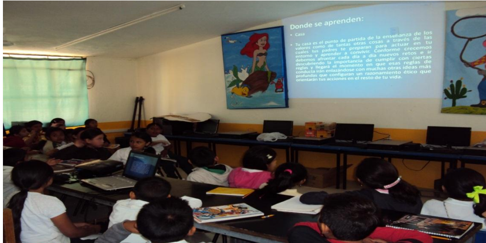
Figura 3: Desarrollo de la primera actividad “Introducción a los valores humanos”