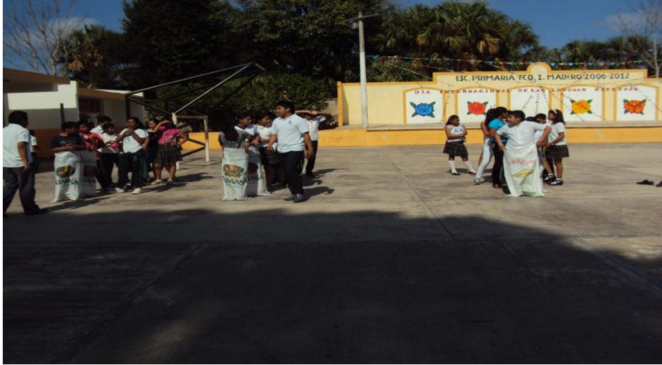
Figura 7: Explicación de la tercera actividad “El rally”