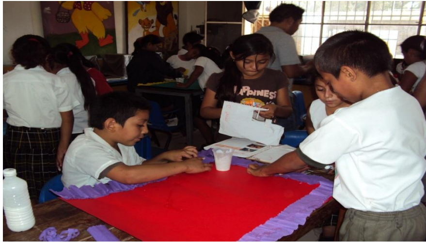
Figura 5: Los niños Realizando los carteles con referencia a la actividad 2