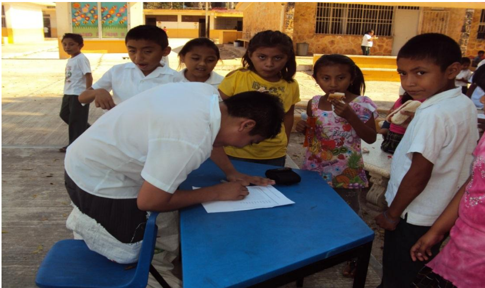
Figura 8: Desarrollo de la tercera actividad, los niños resolviendo un crucigrama.