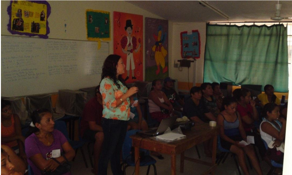
Figura 9: Producto final de la actividad “El árbol de los valores”