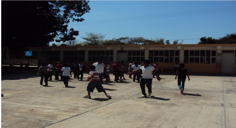
Figura 11: Proceso de la actividad “Mejorando mi entorno” vemos la interacción entre los niños