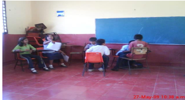
Formando equipos para trabajar