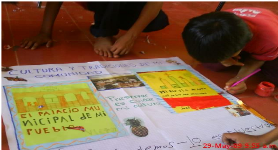
Trabajando en equipo