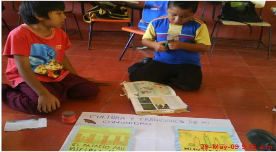
29-May-09 9:15 a.m.