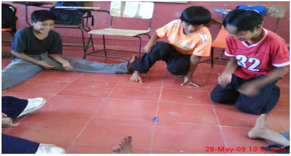
28-May-09 10:57 a.m.