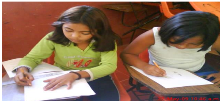
Realizando trabajos individuales