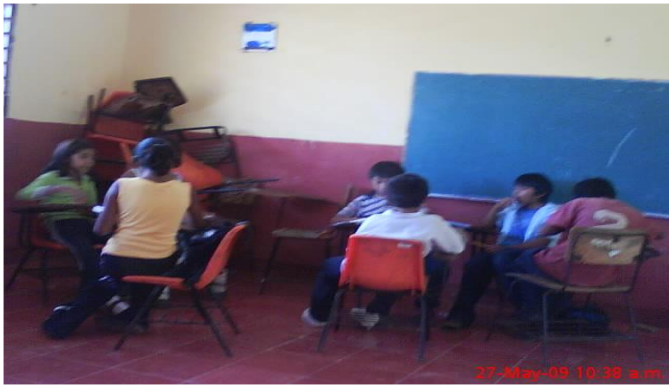
27-May-09 10:38 a.m.