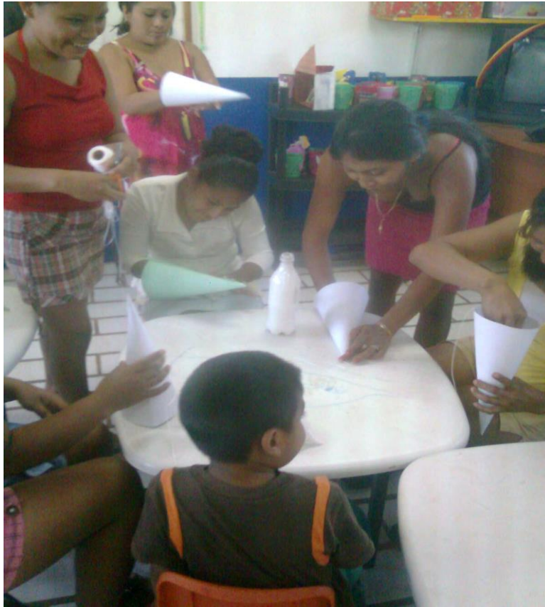
Mamitas con sus hijos realizando juegos y juguetes tradicionales.