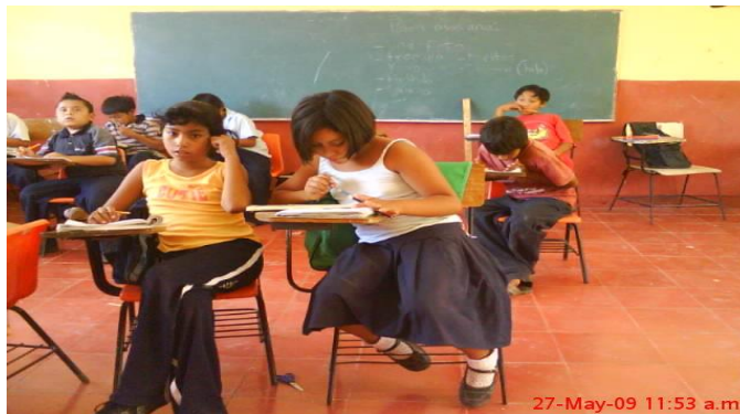
Niños tomando apuntes del tema presentado en diapositivas