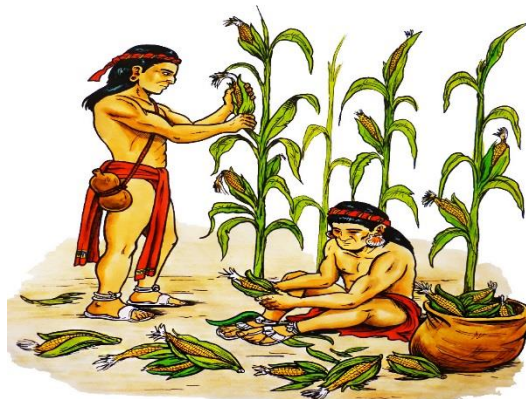
Ilustración 2: La cultura maya siempre ha cultivado el maíz para su sobrevivencia 8

“Dentro del contexto de las culturas mesoamericanas el maíz es considerado como el único alimento que reúne todas las propiedades nutritivas y el único que concentra todos los valores simbólicos y culturales como la vida, la muerte y el espíritu, entre otros” (Petrich, 1985:3).