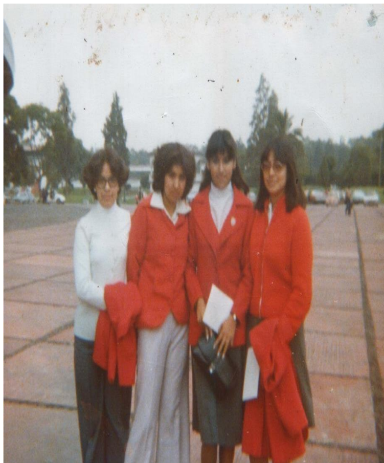
En 1979 con unas compañeras de la Escuela Nacional de Educadoras