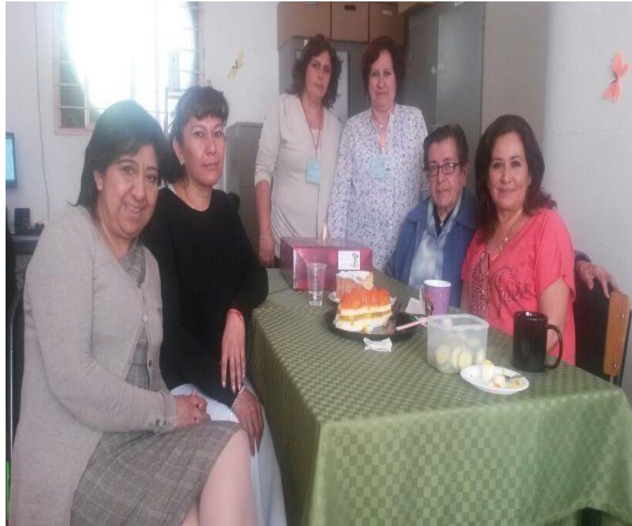
Actualmente con dos directoras y personal de la zona escolar 203