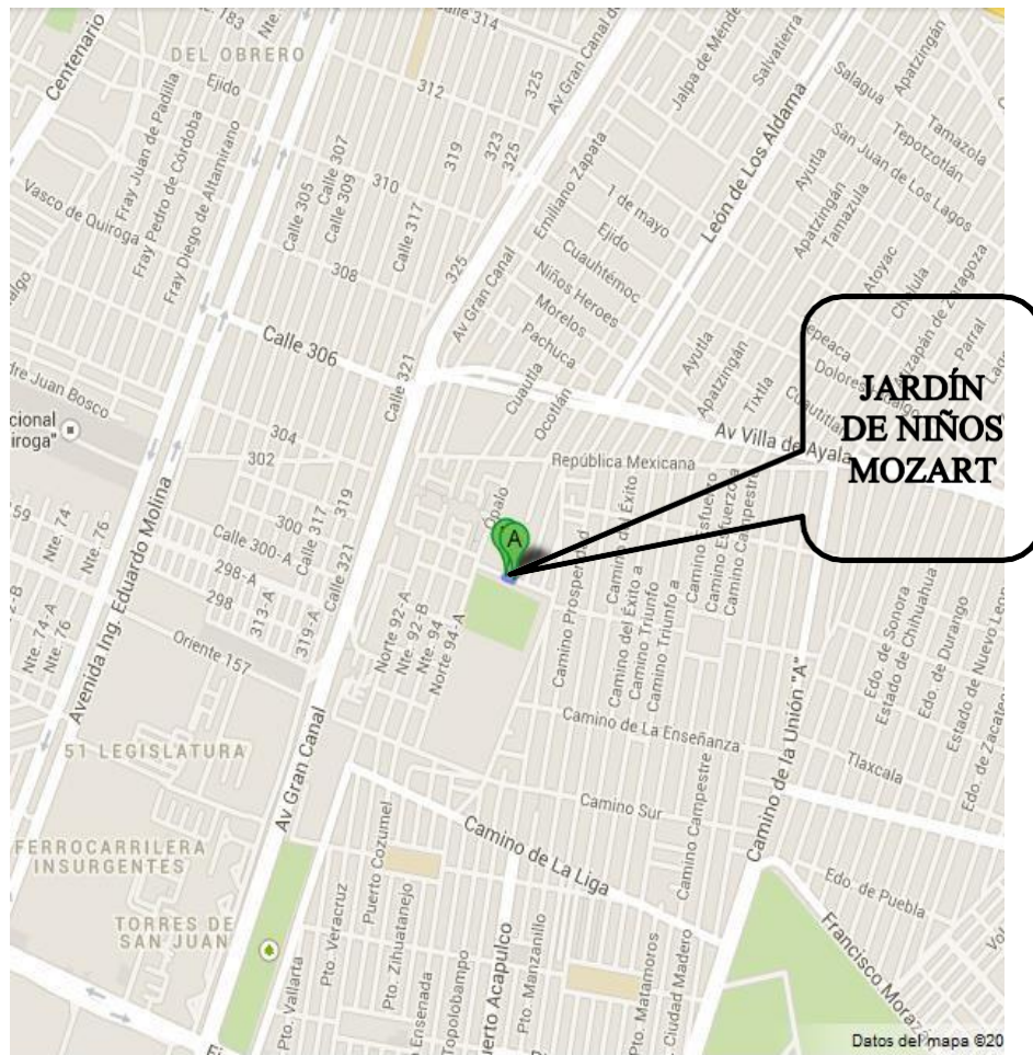
Ubicación del Jardín de Niños “Mozart”