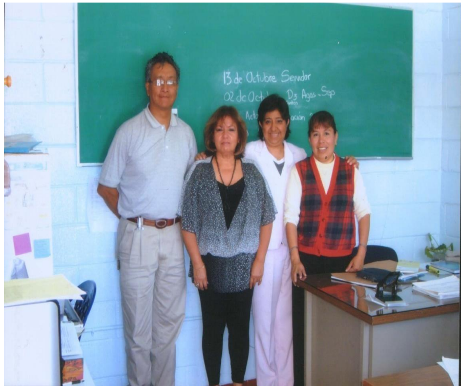
En 2009 con personal administrativo de la zona escolar 180