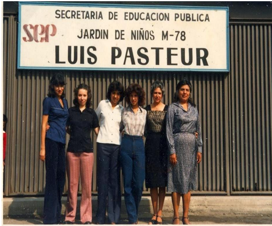
En 1982 con mis compañeras del Jardín de Niños “Luis Pasteur”