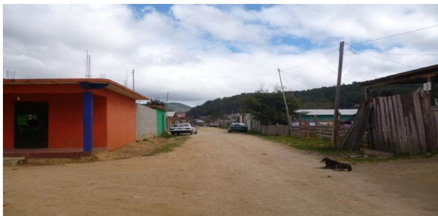
Calle Central. (23 de abril de 2014)

Actualmente la colonia “4 de Marzo” cuenta con dos calles de terracería. La primera tiene el nombre 13 de julio, fecha que se inicia los primeros trabajos para la realización de la calle. La segunda es nombrada, calle central, debido a que conecta con las colonias vecinas.