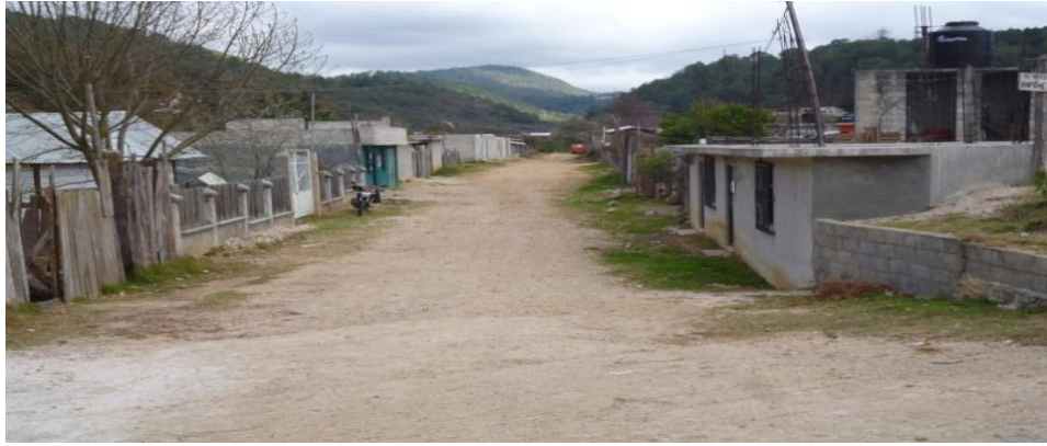
Calle 13 de Julio fotografía tomada por Raymundo López Pérez. (23 de abril de 2014)

Dentro de la colonia, aún no se cuenta con alguna estructura escolar. Pero a unos 200 metros de ella, se encuentran dos escuelas primarias. La escuela Miguel Hidalgo que pertenece a la colonia Peje de Oro y la escuela Miguel Utrilla que se encuentra en la colonia Molino de los Arcos. Cada una de las escuelas primarias cuenta con seis aulas y por cada grado escolar cuenta con un aproximado de 40 o 50 alumnos. Y al frente de la colonia “4 de Marzo” a unos 100 metros, se encuentra la escuela preescolar Juana de Arco, que se equipa de tres salones y con un aproximado de 40 alumnos en cada grado escolar. Para poder ingresar en las tres escuelas mencionadas piden como primer requisito saber hablar el español. Estas escuelas se encuentran saturadas de alumnos, lo que ocasiona que muchos NNA, no encuentre espacio para entrar en uno de los grados escolares.