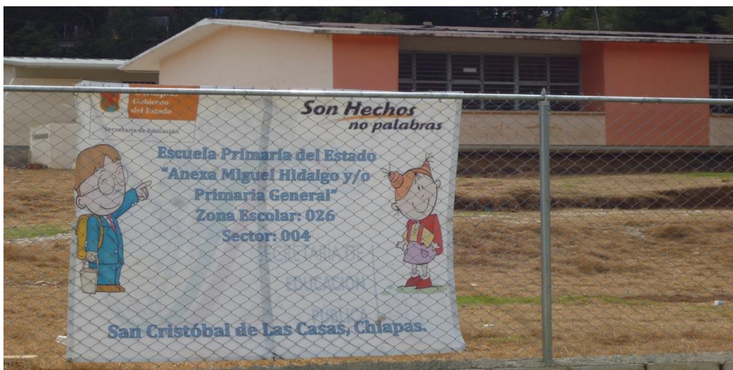
Escuela Primaria Miguel Hidalgo. (23 de abril de 2014)

Dentro de la colonia, aún no se cuenta con alguna estructura escolar. Pero a unos 200 metros de ella, se encuentran dos escuelas primarias. La escuela Miguel Hidalgo que pertenece a la colonia Peje de Oro y la escuela Miguel Utrilla que se encuentra en la colonia Molino de los Arcos. Cada una de las escuelas primarias cuenta con seis aulas y por cada grado escolar cuenta con un aproximado de 40 o 50 alumnos. Y al frente de la colonia “4 de Marzo” a unos 100 metros, se encuentra la escuela preescolar Juana de Arco, que se equipa de tres salones y con un aproximado de 40 alumnos en cada grado escolar. Para poder ingresar en las tres escuelas mencionadas piden como primer requisito saber hablar el español. Estas escuelas se encuentran saturadas de alumnos, lo que ocasiona que muchos NNA, no encuentre espacio para entrar en uno de los grados escolares.