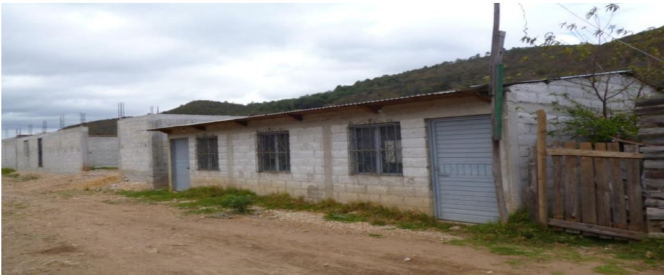
Casa de reuniones de la Colonia "4 de Marzo". (23 de abril 2014).

Así, entra una nueva oleada de personas para ocupar los predios, con el fin de ganar legalmente las propiedades. Lo cual, cambia totalmente el rumbo de obtener el predio de las tres hectáreas. Se crea una nueva asamblea y se unen los pocos invasores que aún quedaban, se eligen los representantes (presidente, secretario y tesorero), también se comisionan dos personas encargadas del patronato de agua y dos personas encargadas del patronato de luz. Y cada fin de mes se reunía en la casa de juntas que construyeron ellos mismos, donde se trataban asuntos para ver las necesidades, y sobre todo, el proceso de llegar a urbanizar y escriturar las tres hectáreas.